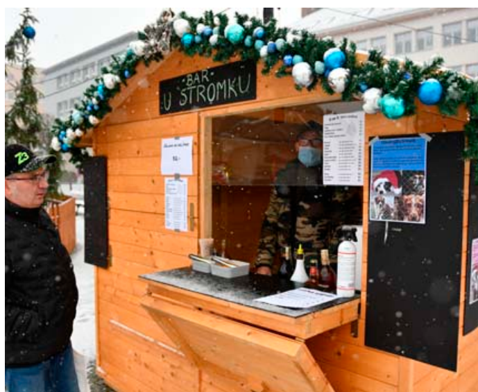
V centru města se také letos otevřel tradiční Bar U stromku.