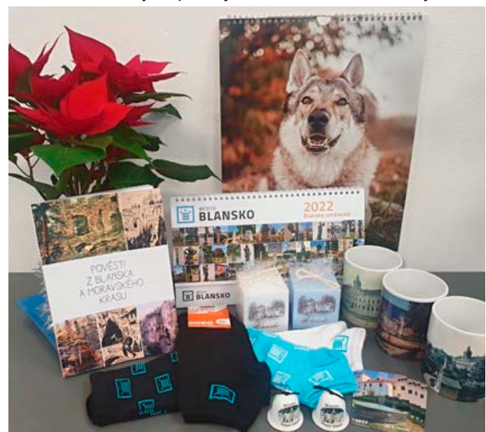
Nabídka v infocentru Blanka.