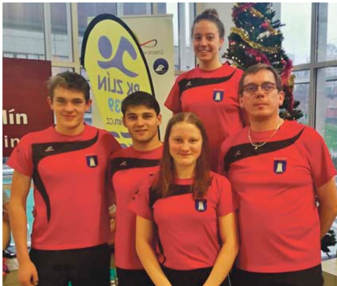
Blanenští plavci na závodech ve Zlíně.