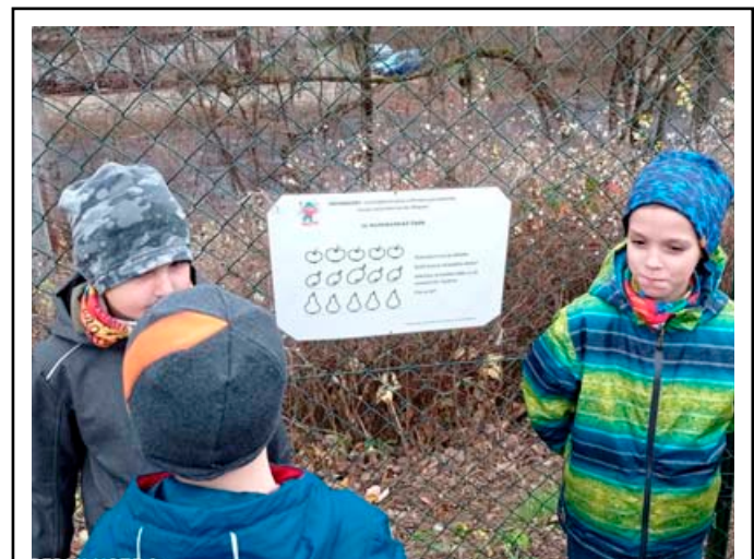
Protože v naší škole máme rádi, když je učení hravé a zábavné, zrodily se listopadové hrátky. Tato venkovní podzimní hra čekala od 19. do 21. listopadu 2021 na všechny zvědavé budoucí prvňáčky v nejbližším okolí ZŠ a MŠ Salmova 17.

Předškoláci si tak hravou formou ověřili, jak jsou na vstup do školy připraveni a také si vyzkoušeli něco málo z toho, co je v první třídě čeká. Po cestě za úkoly si prohlédli okolní prostředí školy a krásnou přírodu, která se kolem dokola rozprostírá.