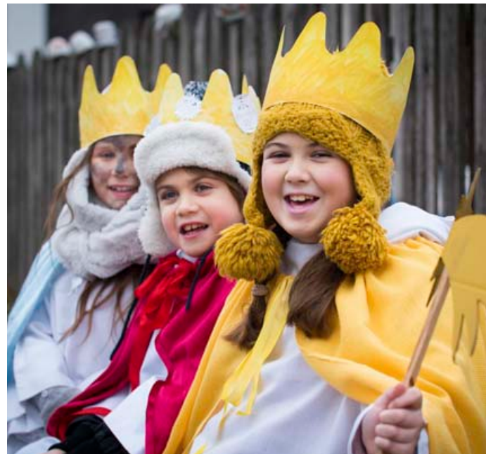
Na začátku roku vyjdou do ulic koledníci.