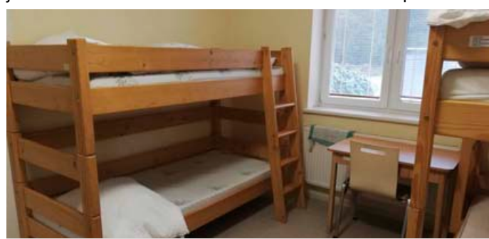
Interiér azylového domu.