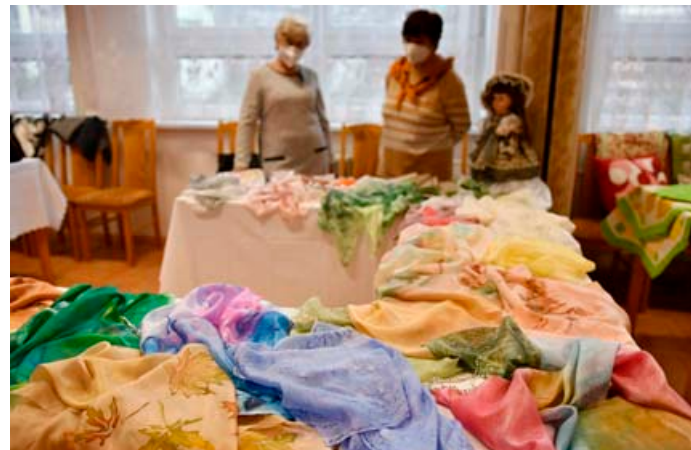
Členky městského klubu důchodců na začátku prosince uspořádaly prodejní vánoční výstavu. K dostání byly kožené brože, šály a šátky malované na hedvábí, nákrčníky, dívčí teplé sukýnky, moderní svetry, mikinové šaty nebo patchworkové výrobky.