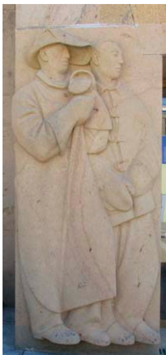
Detaily figurálních kamenných reliéfů od akademického sochaře Josefa Kaplického.