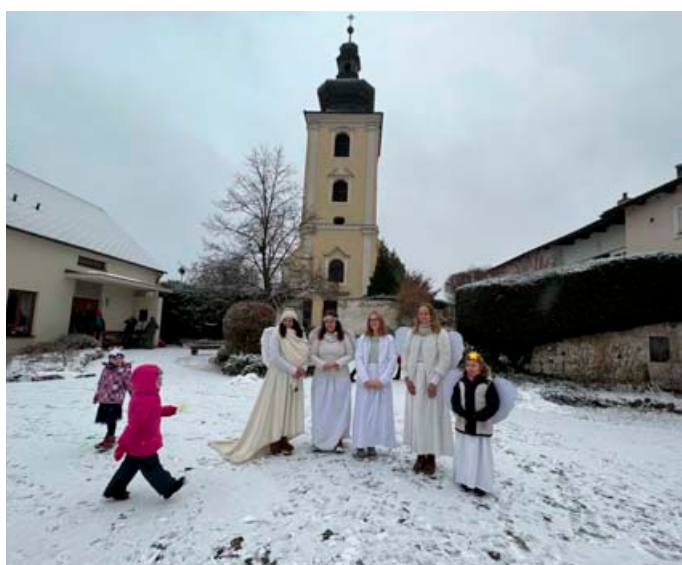
Andělská sobota na farním dvoře.