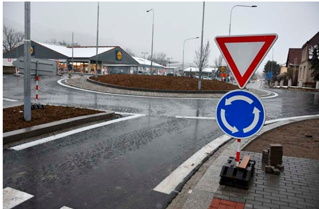
Nový kruhový objezd se pro dopravu otevřel v úterý 30. listopadu.

„Pracovat nyní budeme ještě na dokončení chodníků a obrub u napojení Fügnerovy ulice a také na terénních úpravách v okolí nové křižovatky, proto je zatím možný pouze obousměrný průjezd Svitavskou ulicí, tedy na hlavním tahu Blanskem a kruhový objezd lze používat pouze v režimu „Projíždíte stavbou“.