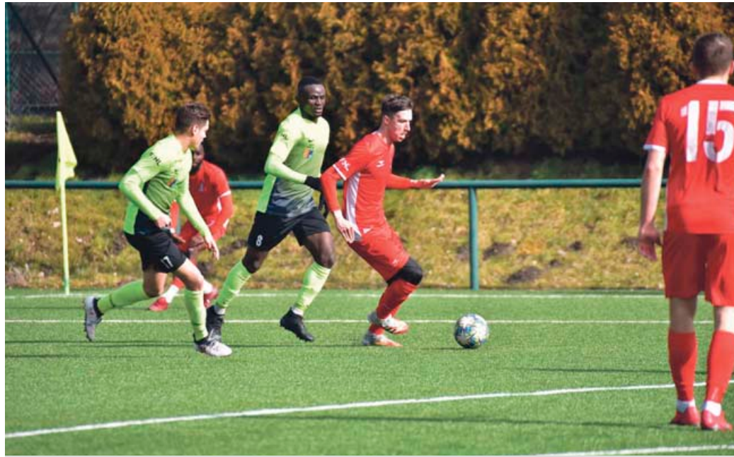
Fotbalisty čeká zimní příprava.

O týden později se Blansko setká s ligovým soupeřem z Vrchoviny, který na podzim okupuje patnáctou příčku MSFL. V rámci přípravy dojde také na regionální derby. 5. února totiž blanenští fotbalisté narazí na Boskovice, které aktuálně působí v krajském