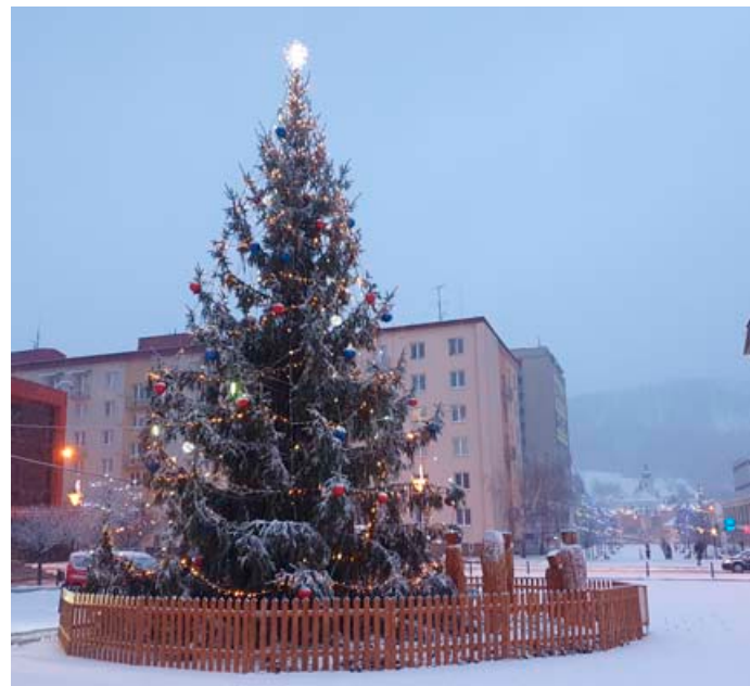
Vánoční strom na náměstí Republiky se rozsvítil v pátek 26. listopadu.