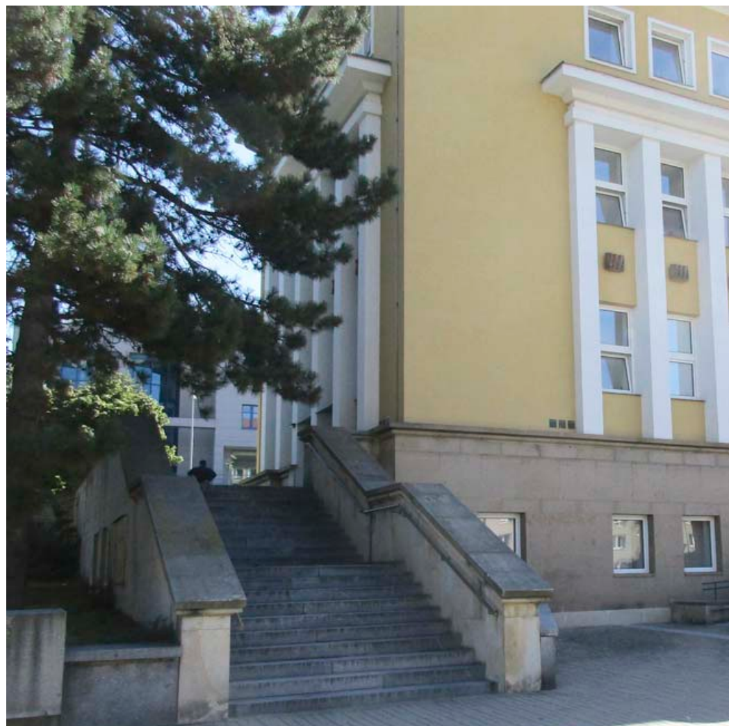
Výškový rozdíl mezi náměstím Republiky a Seifertovou ulicí vyrovnávají schody, které jsou z obou stran budovy banky.

Po ukončení studia na AVU, pravděpodobně ještě pod vlivem profesora Maxe Švabinského, se orientoval na krajinářskou tradici české figurativní malby. Následně během svého působení na Uměleckoprůmyslové škole jako asistent profesora Brunnera, se věnoval velmi úspěšně i užitému uměleckým oborům. Jednalo se o grafiku (knižní grafika,