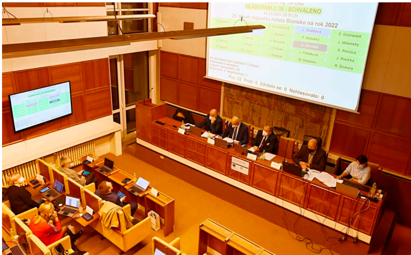
Návrh rozpočtu na rok 2022 podpořili všichni přítomní zastupitelé.