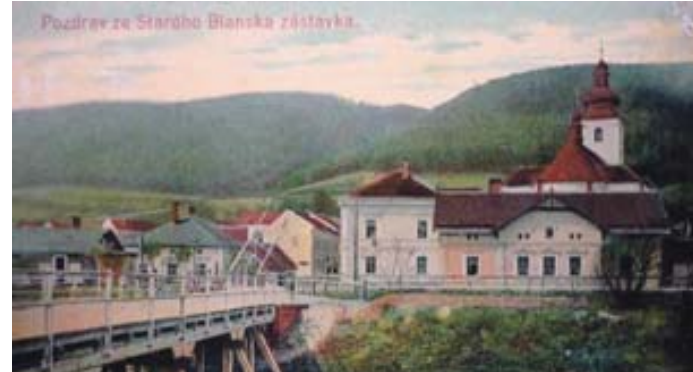
Vpravo na pohlednici dům velkozávodů firmy Antonín Sedlák. Dům stával v ulice Komenského 2. Byl zbourán.