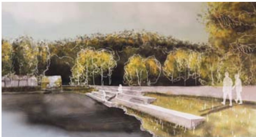
Gabiony, dřevěné platformy u hráze – na návodní straně hráze přibude zřejmě ještě v letošním roce nové posezení. Návštěvníkům lokality budou k dispozici gabionové zídky s dřevěnými sedacími plochami (na mapě č. 6).