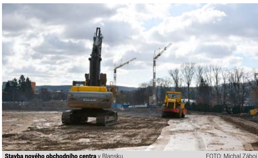
Stavba nového obchodního centra v Blansku.

Společnost M.S. Blanenská má podle něj podepsané smlouvy s firmou Datart, Su-