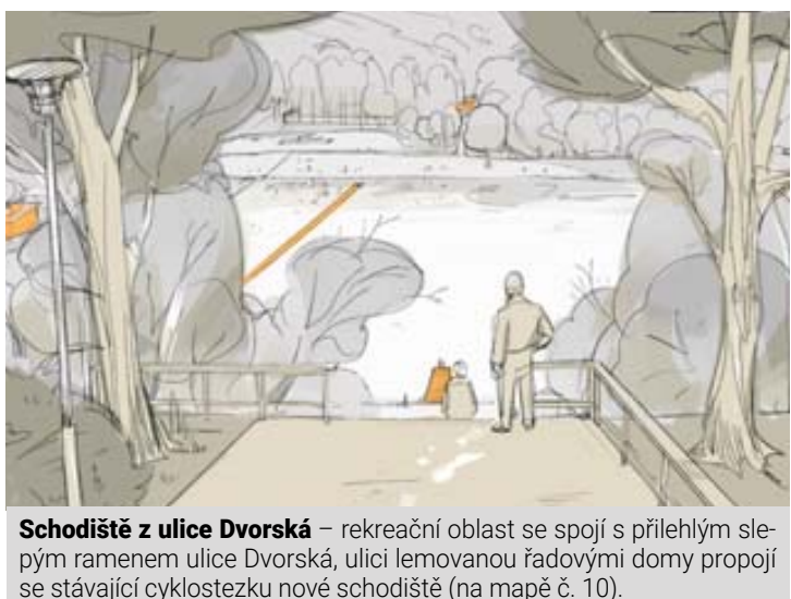
Schodiště z ulice Dvorská – rekreační oblast se spojí s přilehlým slepým ramenem ulice Dvorská, ulici lemovanou řadovými domy propojí se stávající cyklostezkou nové schodiště (na mapě č. 10).