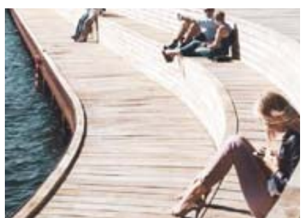
Nové stupňovité molo u restaurace Gizela – jihovýchodní břeh v blízkosti nynějšího občerstvení Gizela zatraktivní dřevěné stupňovité molo umožňující relax i přístup k vodní hladině (na mapě č. 5).