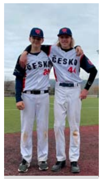
Blanenští baseballisté na soustředění v Barceloně.

Blanenští hráči si tak užili první zápasy proti evropskému