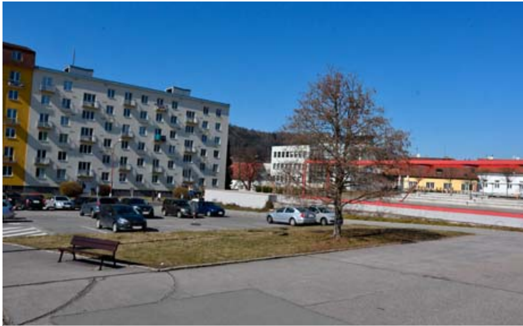
Severní část náměstí Republiky připomíná jedno velké parkoviště. Po rekonstrukci by měla nabídnout také prostor pro relax, podobně jako nedaleké Poduklí.