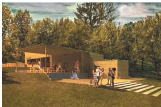
Novostavba zázemí „U hřiště“ – stávající bufet u dětského hřiště nahradí v případě získání dotace nový multifunkční objekt se sociálním zařízením, zázemím pro správce, půjčovnou nářadí a vybavení i prostorem pro menší občerstvení (na mapě č. 12).