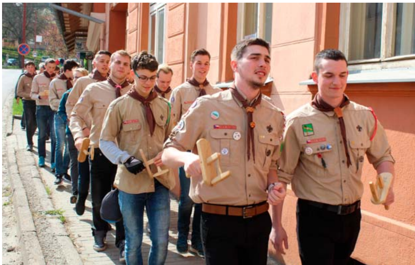
Městem by měli na Velký pátek projít skauti s klapačkami , podobně jako v roce 2016.