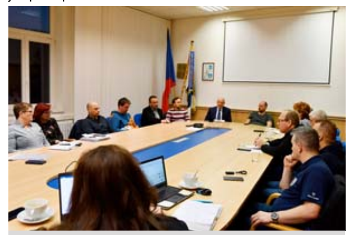
Starostové jednali o nabídce míst pro lidi prchající z válkou postíženě Ukrajině.