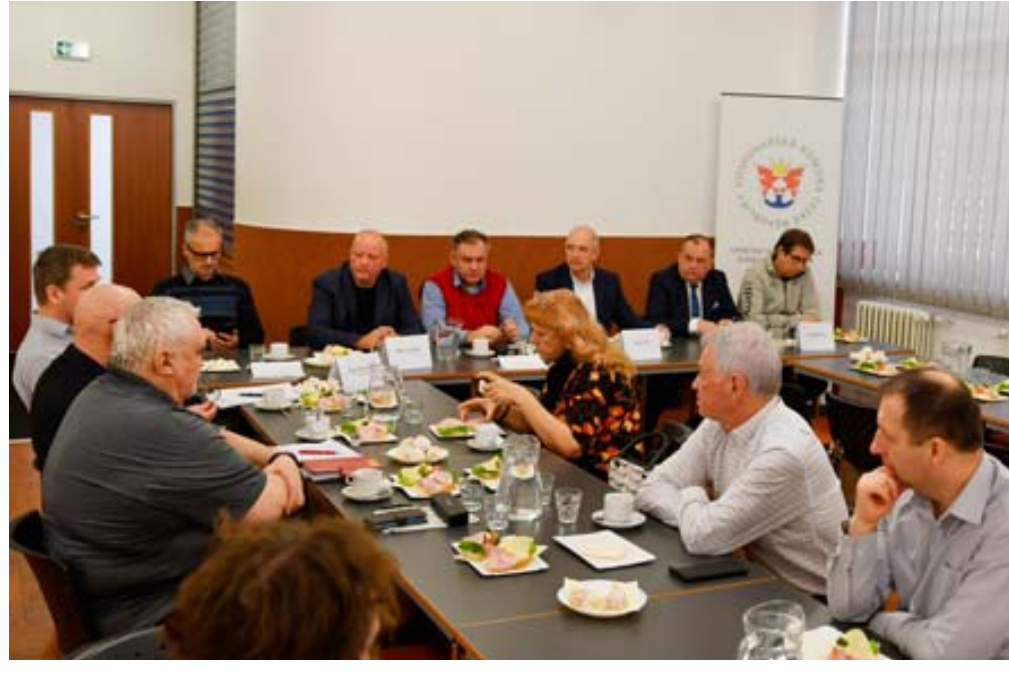
Ve spolupráci s Okresní hospodářskou komorou Blansko se v Dělnickém domě uskutečnilo setkání vedení města s podnikateli . Akce má přispět k lepší spolupráci i předávání informací o klíčových projektech, investicích i plánech města.