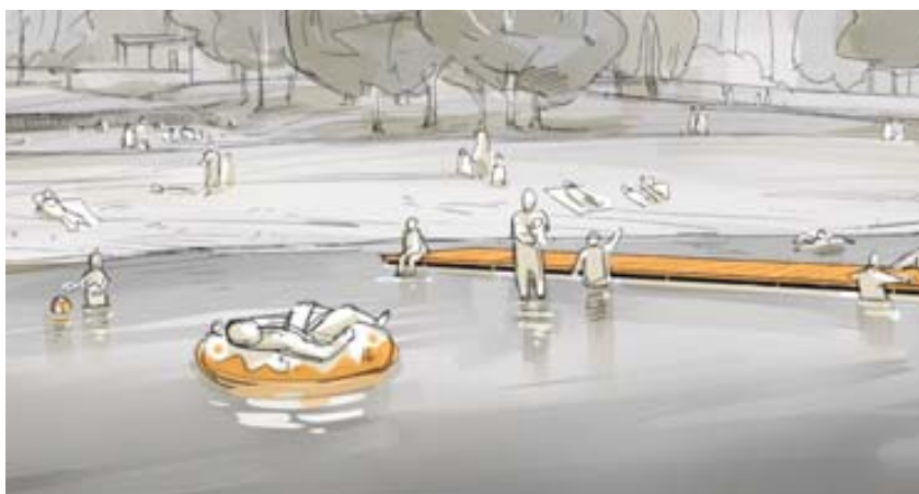
Vytvoření mola – současné zábradlí oddělující plaveckou a neplaveckou část nahradí nové pobytové molo z kompozitního materiálu ve vzhledu dřeva, doplněné madlem a schůdky pro snadnější výstup z vody (na mapě č. 2).