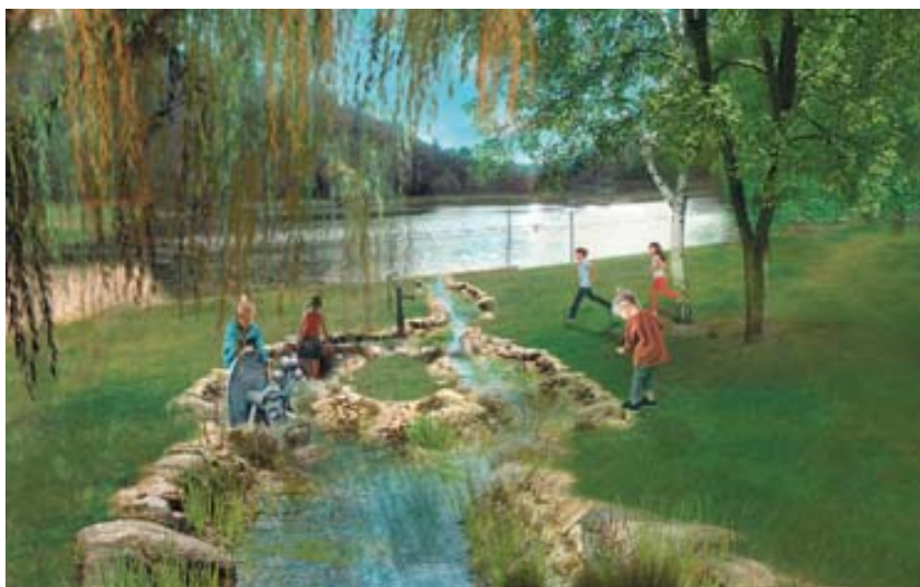
Otevření zatrubněného toku – uzavřené koryto Palavského potoka bude v části od Myslivny po přítok do vodní nádrže odkryto, potok doplní vodní herní prvky, jako jsou vodní stavidla či mlýnky (na mapě č. 3).