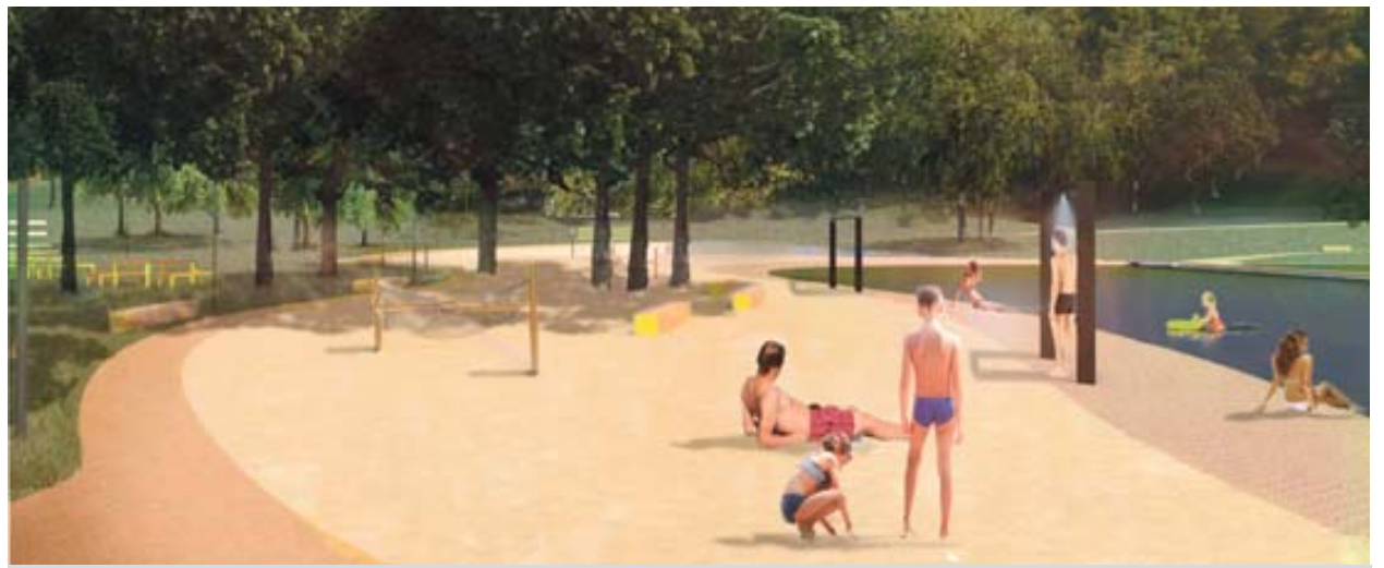
Úprava břehů vodní nádrže – v severní části u restaurace Myslivna vznikne nová písčná pláž, stávající betonovou obrubu nádrže nahradí pozvolný přechod do vody, v okolí bude doplněn mobiliář, obnovy se dočká také nedaleké beachvolejbalové hřiště (na mapě č. 1 a 23).