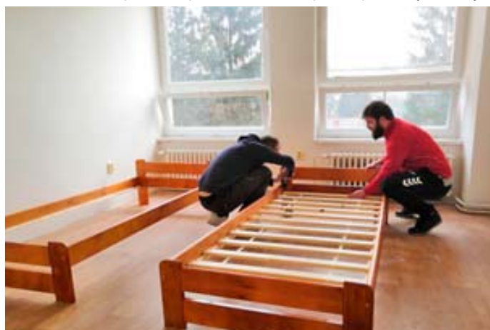
Zaměstnanci městského úřadu na brigádě v objektu ve Sladkovského ulici.

Aktuálně až do neděle trvá humanitární sbírka vyhlášená Oblastní charitou Blansko hned na čtyřech místech regionu. Pomoc lidem prchajícím před válkou ale už třetím týdnem denně poskytují zaměstnanci města ale také dalších organizací včetně složek integrovaného záchranného systému. Jen na Blanensku pokračování na straně 3 >