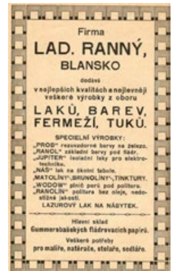
Dobová propagace firmy Ladislav Ranný Blansko.