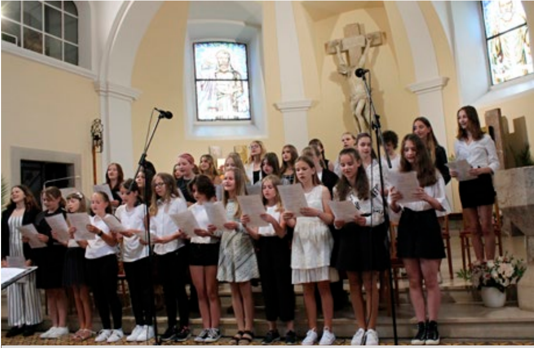
Letošní sváteční atmosféru Noci kostelů v Blansku obohatil svým vystoupením pěvecký sbor ZŠ a MŠ Blansko, Salmova 17. V prouluněném pátečním odpolední 10. června se v blanenském kostele sv. Martina sešlo přes 30 účinkujících zpěváků a recitátorů.