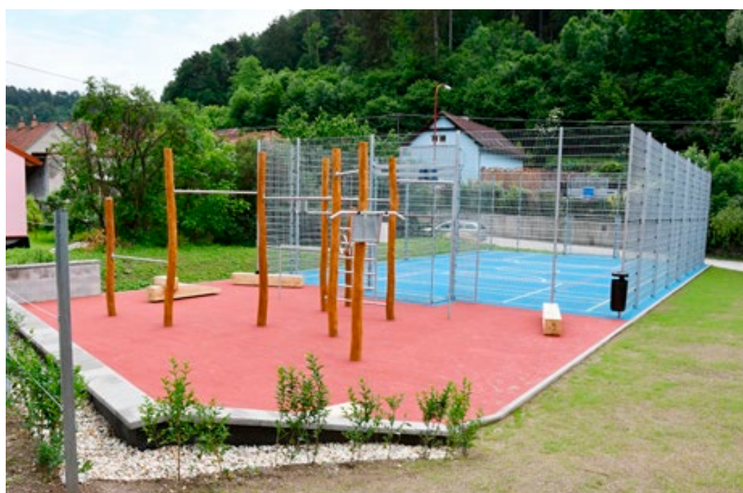
Na nové multifunkční hřiště navazuje prostor pro workout.

Na podobě úprav se podíleli i místní. Na návrhu projektu i během vlastní realizace byl totiž partnerem města místní občanský aktiv, jehož zástupci se pravidelně účastnili také kontrolních dnů.