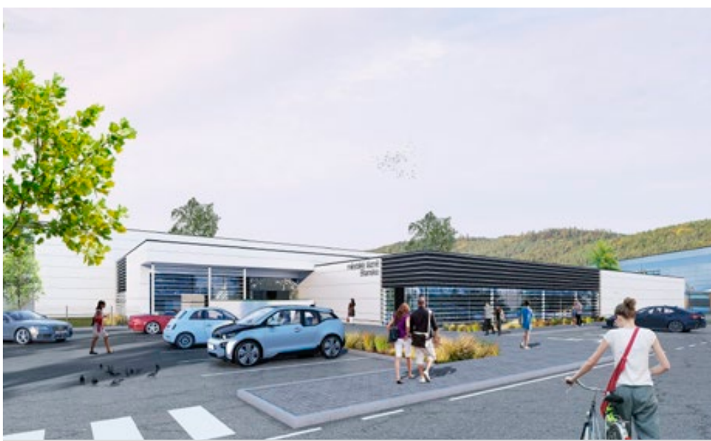
Architektonická studie nových krytých lázní.

Podle předloženého termínu by se ještě do prázdnin měla podat žádost o společné územní a stavební řízení a také vypsát výběrové říze-