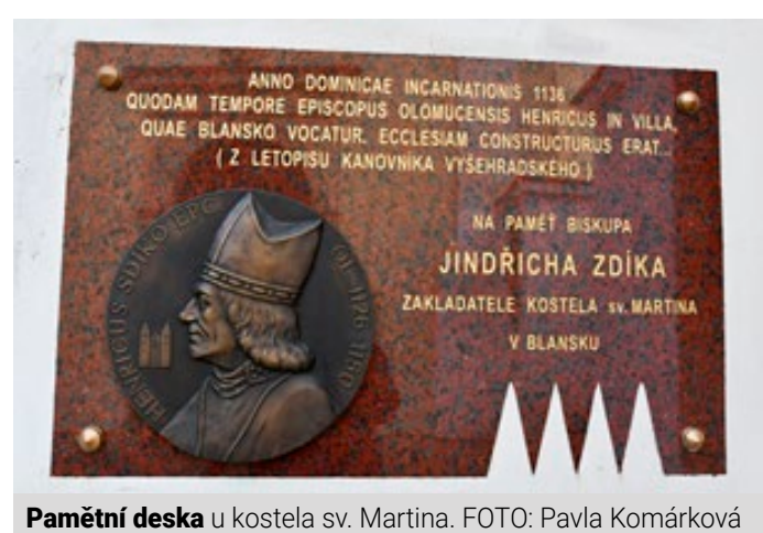
Pamětní deska u kostela sv. Martina.