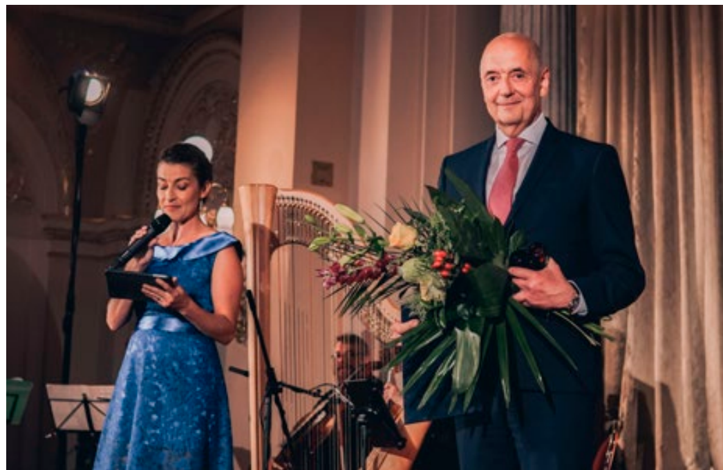
Vyhlášení výsledků soutěže se konalo v Praze na Žofíně.