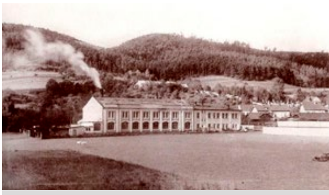
Továrny firmy Ladislav Ranný.

Odbyt vlastní výroby všech druhů laků a barev obstarával distribuční aparát sedmi prodejních továrních skladů (po jednom v Blansku, Třebíči, Německém Brodě a čtyři v Brně). Měl čtyři obchodní zástupce pro oblast v Čechách a na Moravě a vytvořenou obchodní síť okresních zástupců. Stejně jako výrobky z oboru barev