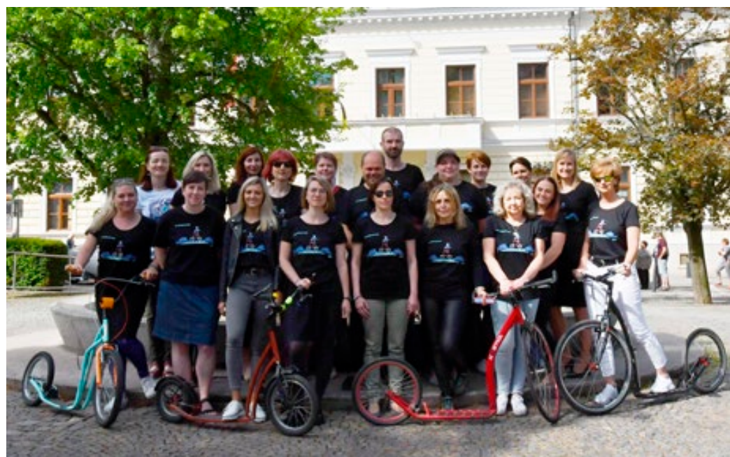
Zaměstnanci blanenské radnice se zapojili do výzvy Do práce na kole.

Počínaje prvním květnem si všichni, kteří se do výzvy zapojili, zapisovali zdořené kilometry. Kromě dobrého pocitu z pohybu mohli v průběhu akce využívat některá