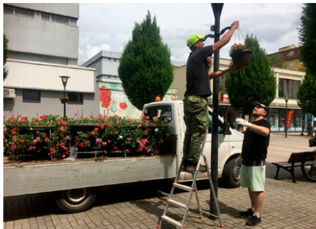
Závěsné květináče zdobí náměstí a pěší zónu.