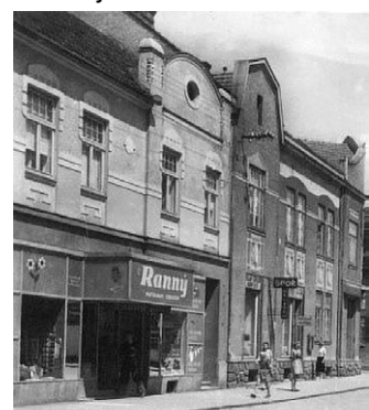
Prodejna Ranný v Rožmitálově ulici.

Továrna na barvy, laky a chemické přípravky. Z malého obchodu s materiálem zbožím, založeného v roce 1913 v Blansku, vyrostl velký tovární podnik, ve svém oboru vedoucí na Moravě. Roku 1919 postavil majitel L. Ranný v Dělnické Kolonii (dnešní ulice Sukova 2324/4) obytný dům, rozsáhlé skladiště, dílny a kancelář. Kolem roku 1920 byla zdokonalena výroba rezuzvzdorných barev k nátěru železných konstrukcí a značka Prob, kterou tento výrobek nesl, zaručovala bezkonkurenční jakost.