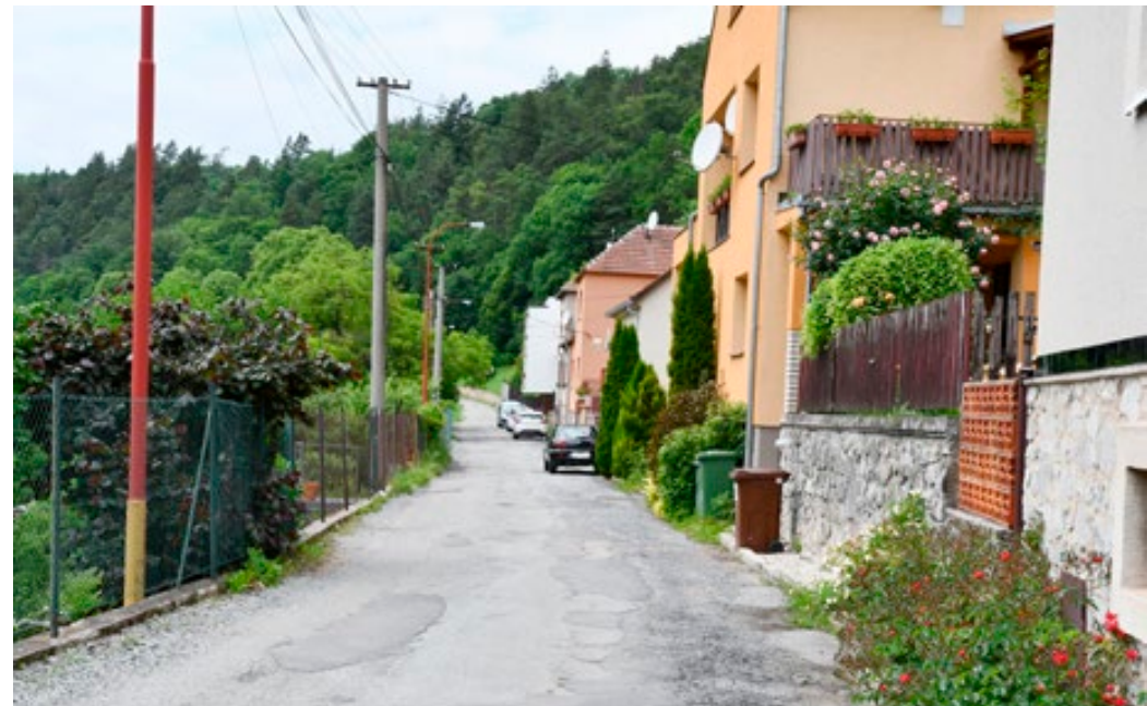
Cestu ke hřbitovu čeká rekonstrukce.