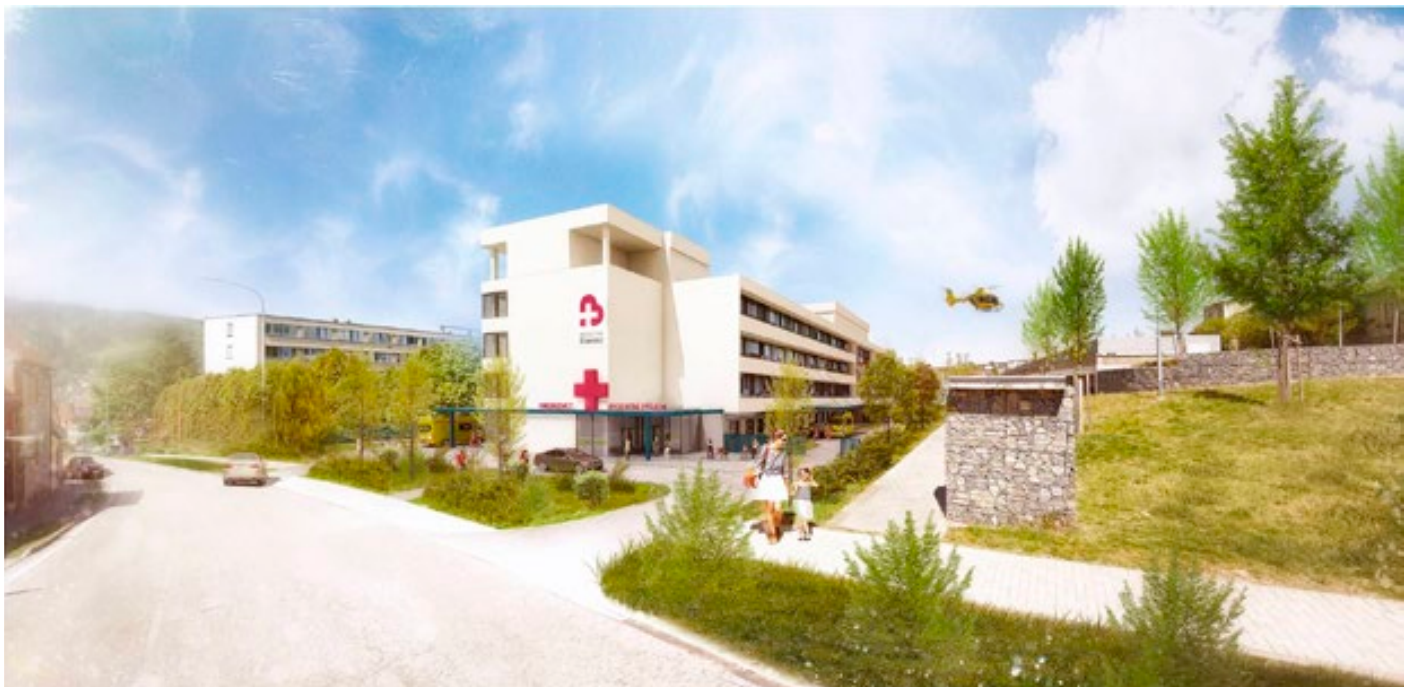
Nový urgentní příjem bude přístupný z ulice Sadová.

„Z tohoto pohledu si od vybudování nového urgentního příjmu slibujeme i to, že se sníží tlak na lůžkovou oddělení. Některé akutní stavy (například gastroenteritidu) může vyřešit podání dvou tří infuzí a druhý den jde pacient domů.