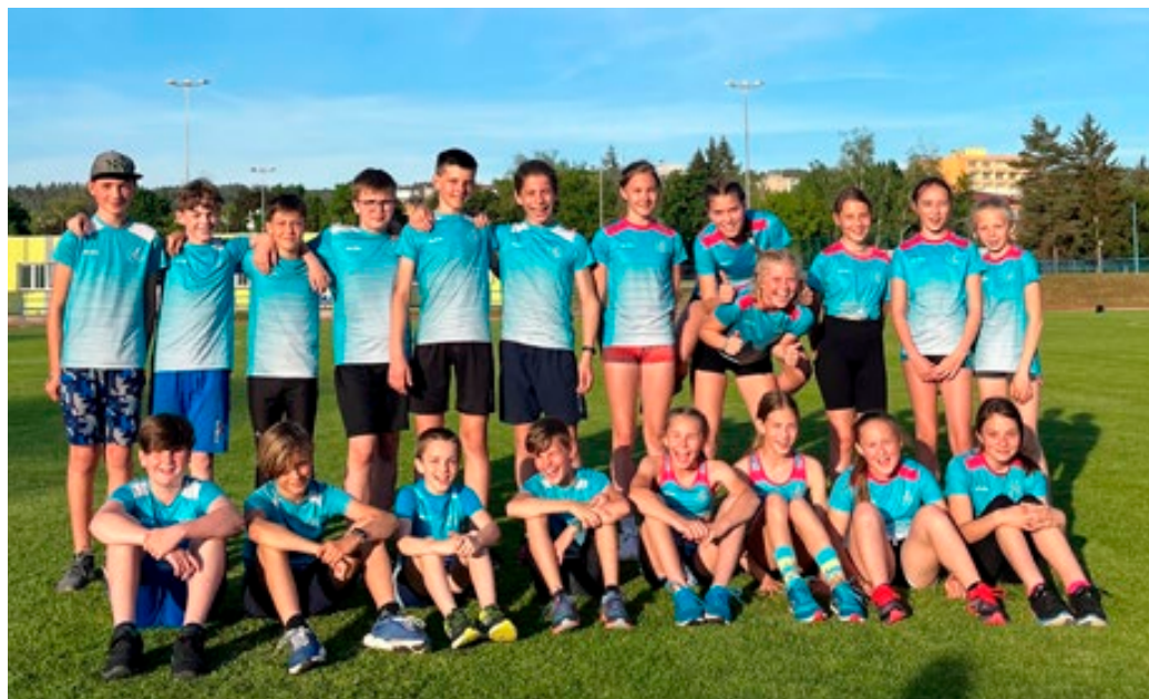
Družstvo mladšího žactva.

V soutěži družstev staršího žactva jsme spojili síly s Boskovickým Elite Sport. Vzhledem k malému počtu atletů i přes pěkné individuální výkony, jsme nestačili na velké jihomoravské týmy a naše pouhé tito soutěží po třech kolech končí. Nicméně malou útechou nám je účast na individuálním Mistrovství Moravy a Slezska odkud jsme si přivezli jednu zlatou medaili.