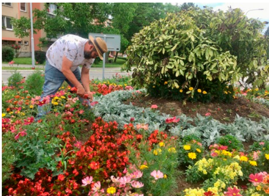
Hlavní tah Blanskem oživily květiny.