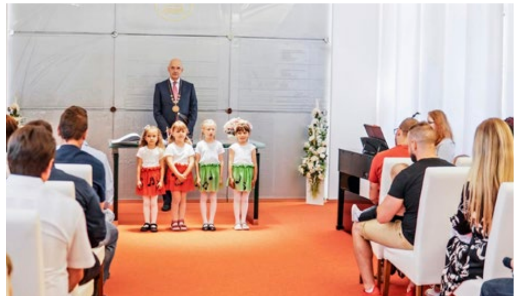
Zatím poslední vítání občánků se konalo na konci května.