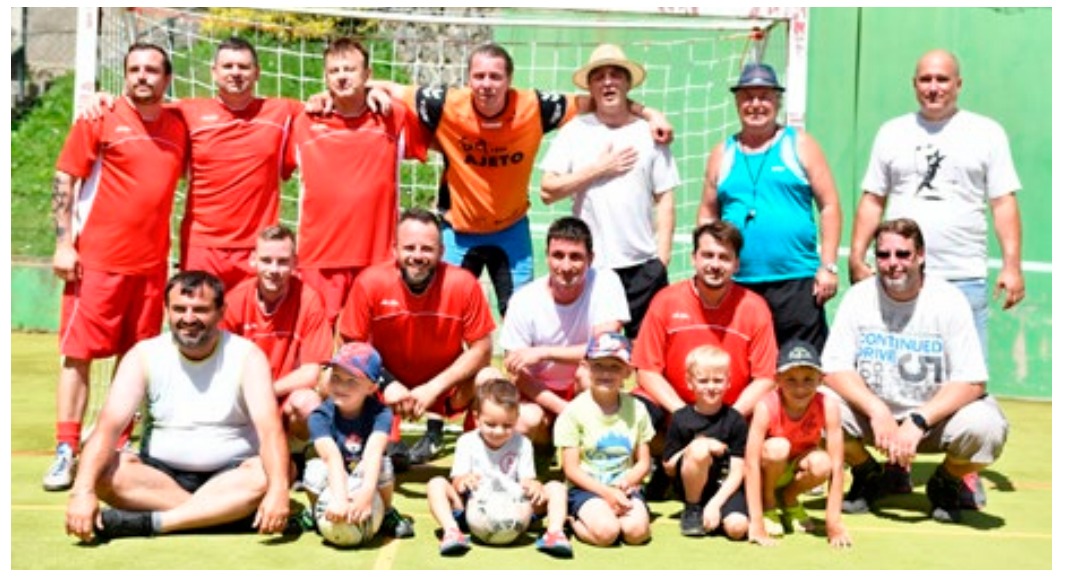
Účastníci Srandamatče v okopávané oslavili Den otců v neděli 19. června přátelským utkáním na hřišti Orla. Odpoledne pokračovaly oslavy tancem s Dechovou hudbou Blansko a promítáním filmu Okresní přebor – Poslední zápas Pepika Hnátky.