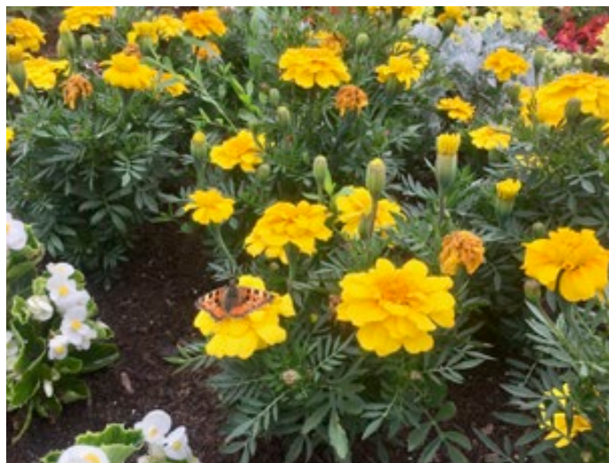
Uprostřed kruhových objездů rozkvetly barevné letničky.

Aktuálně jsou už osazené křižovatky v ulicích Svitavská,