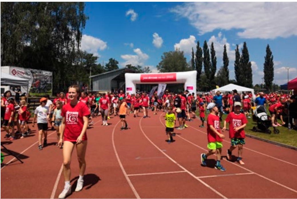
Charitativní běh You Dream We Run hostil o víkendu 11. a 12. června stadion ASK. Více než čtyři tisíce běžců si předávalo štafetu a splnilo tak sen devíti hendikepovaným. Do akce pod širým nebem se zapojilo 58 týmů a během 24 hodin zdolalo více než 35 tisíc kol.