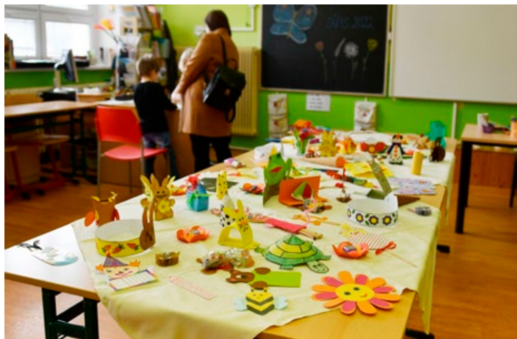
Zápisy do mateřských škol se uskutečnily na začátku května. ILLUSTRÁČNÍ FOTO: Michal Zábaj

klad, že zařazení do přípravné třídy vyrovná jejich vývoj v oblasti sociálních dovedností, komunikace a podobně a nástup do základní školy pro ně tak bude snazší,” uvedla Petra Skotáková s tím, že kapacita přípravné třídy na ZŠ TGM ještě není zcela naplněna a zájemci tak mají možnost se do ní ještě přihlásit. Další letošní novinkou byl mimořádný zápis v souvislosti s válkou na Ukrajině. Ke speciálnímu zápisu pro děti prchající z Ukrajiny, který proběhl dne 2. června 2022, se dostavilo celkem osm dětí. Ty doplní stávající třídy zhruba v polovině blanenských mateřských škol. „Děti z Ukrajiny budou navštěvovat základní školy a mateřské školy také v dalších obcích na celém Blanensku. Nastoupí jich od září dohromady zhruba sto, vždy po jednom či