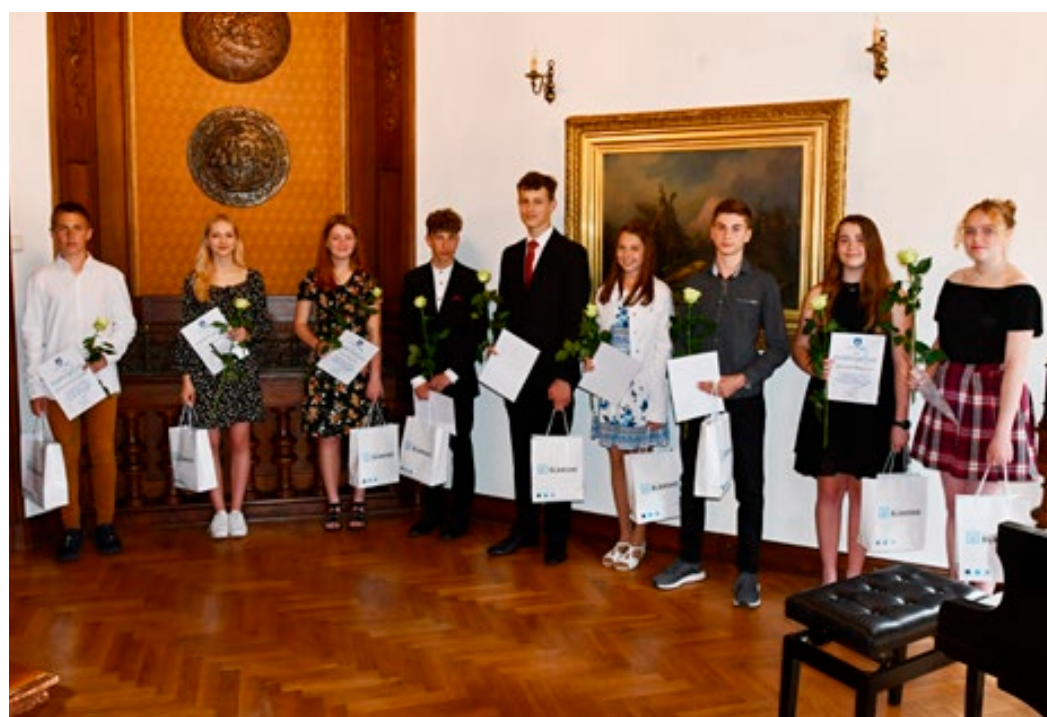
Slavnostní ocenění nejlepších žáků hostil Hudební salon zámku.