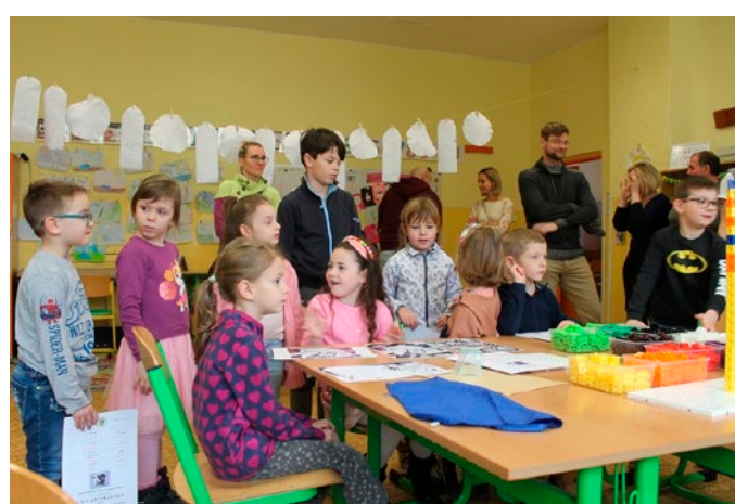
Den otevřených dveří v ZŠ Salmova.

Otevřeno veřejnosti bylo též zázemí prvních tříd, příprav-