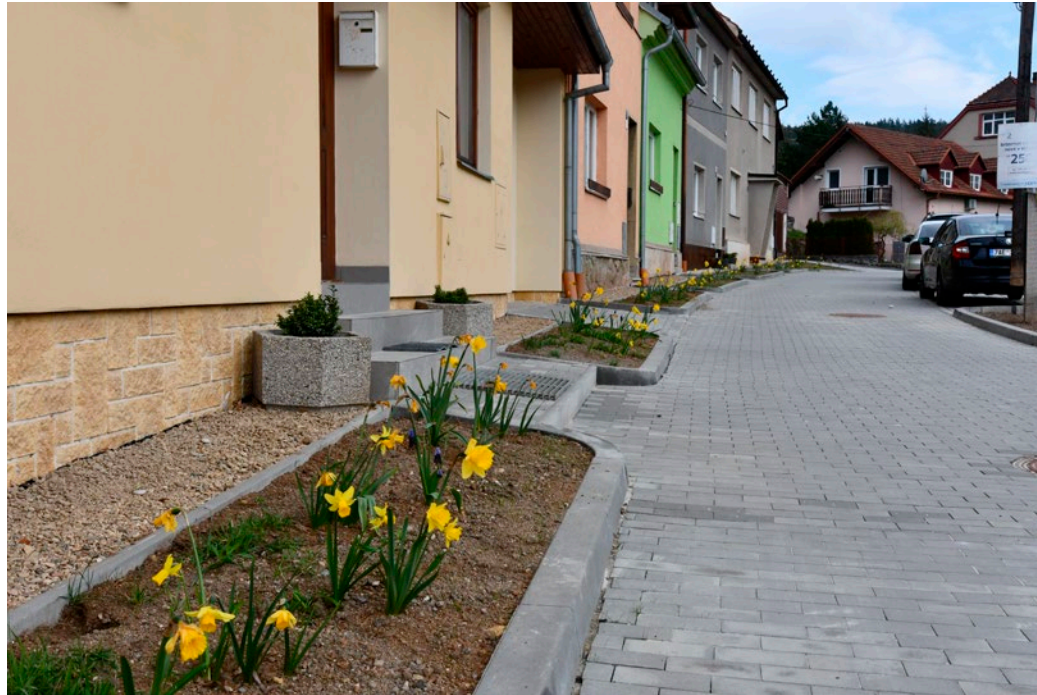
Stavební práce v ulici Horní Palava doplnila také výsadba nové zeleně.