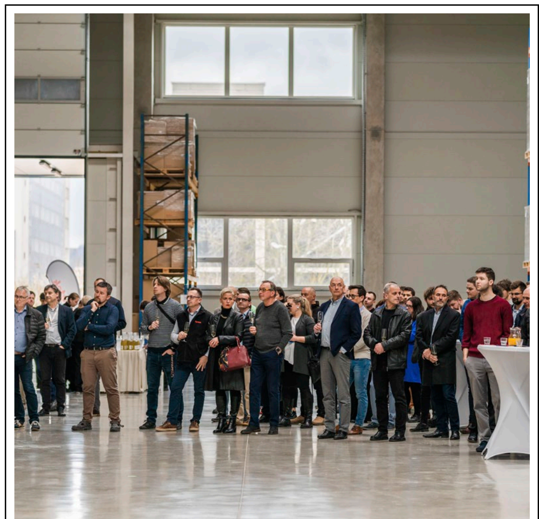
Jeden z největších zaměstnavatelů v Blansku, firma Pyrotek, ve svém areálu v průmyslové zóně slavnostně otevřel čtvrtou výrobní a skladovací halu. Firma, která má přes 400 zaměstnanců, zahájila práce na projektu nové haly v roce 2018, stavbu i dokončení zkomplikovala energetická krize, pandemie covidu i válka na Ukrajině a s ní související krize ve stavebnictví. Nové prostory umožní další rozvoj výroby i celé společnosti, nabízí také uplatnění pro nové zaměstnance.