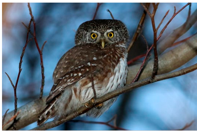
Soutěžní snímek vítěze soutěže Milana Olberta.

Milovníci přírody, amatérští ornitologové i laici mohli fotografie zachycující ptačí obyvatele města a jeho nejbližšího okolí zasílat od poloviny prosince až do konce března. Porotce mezi více než šesti desítkami přihlášených fotografií zaujal nejvíce kulíšek nejmen-