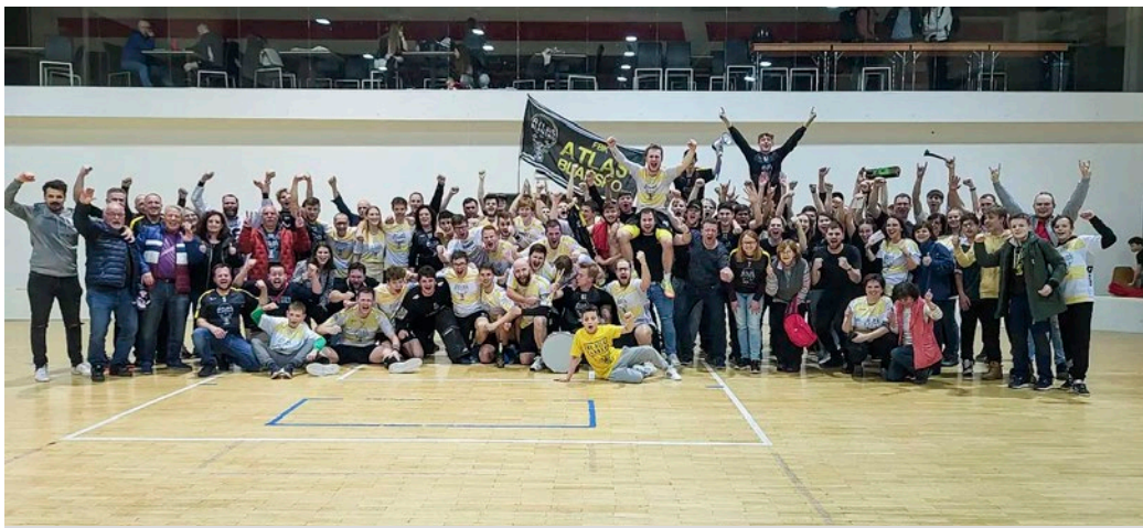
Florbalisté se radují z postupu do Národní ligy.

Čtvrté utkání bylo v režii blanenských. Úvodní branku sice vstřelily Hranice, následně však Atlas zlepšil svůj výkon, dokázal do konce první části otočit stav utkání. Ve druhé třetině přidal čtyři branky a náskok si dokázal pohlídat ve třetí části a zaslouženě si vynutil rozhodující pátý zápas.