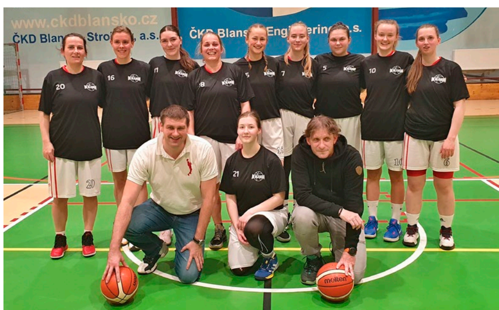
Basketbalistky BK Blansko zvítězily v utkáních s týmy BK Vyškov a BBK Brno, body naopak ztratily s Jiskrou Kyjov.