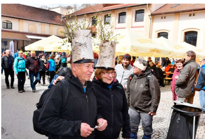
Někteří turisté si vyrobili originální ozdoby hlavy.

„Chtěl bych, aby akce ještě dlouho pokračovala, protože nejenom že zahájení turistické