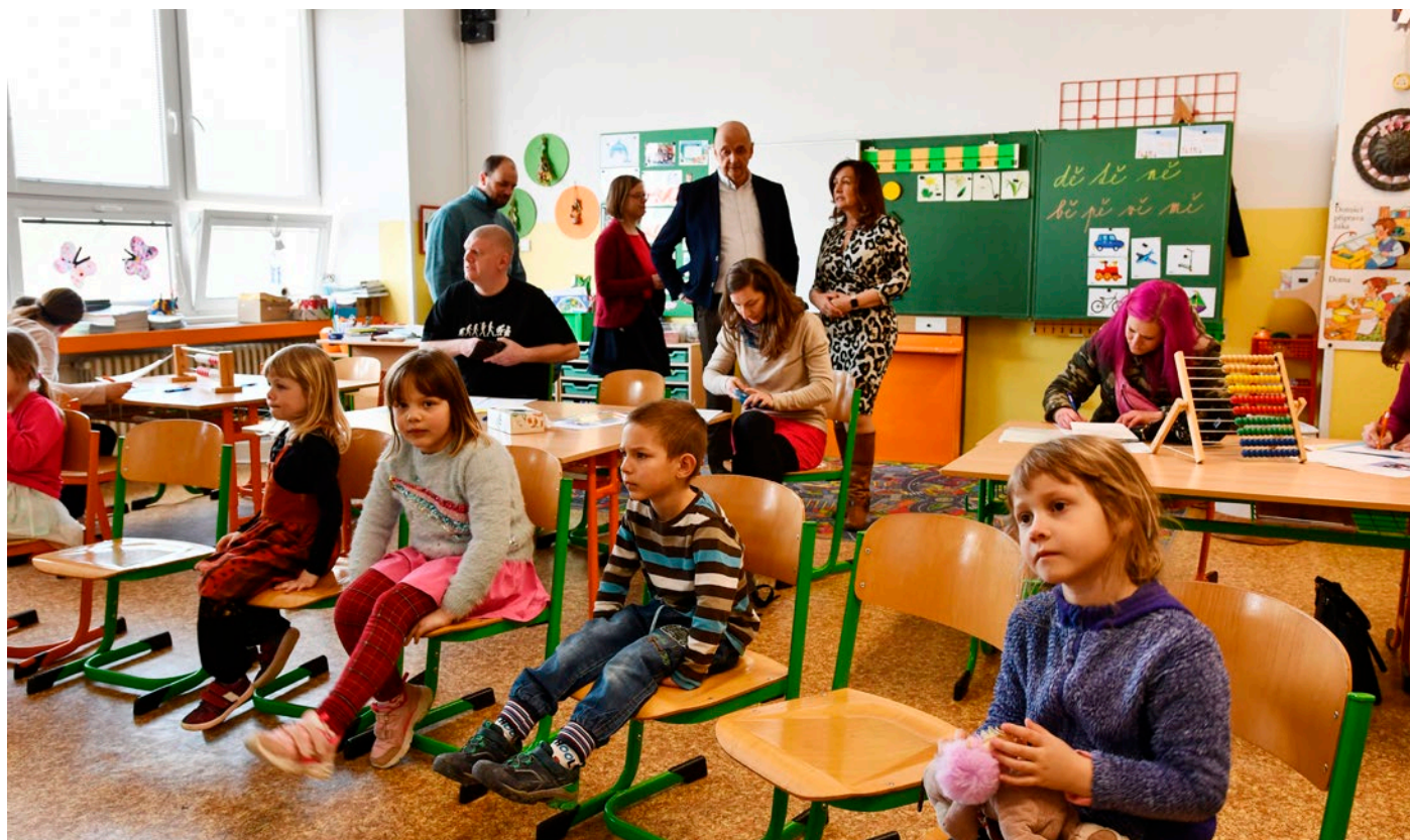
Zápis do prvních tříd v MŠ a ZŠ Salmova.