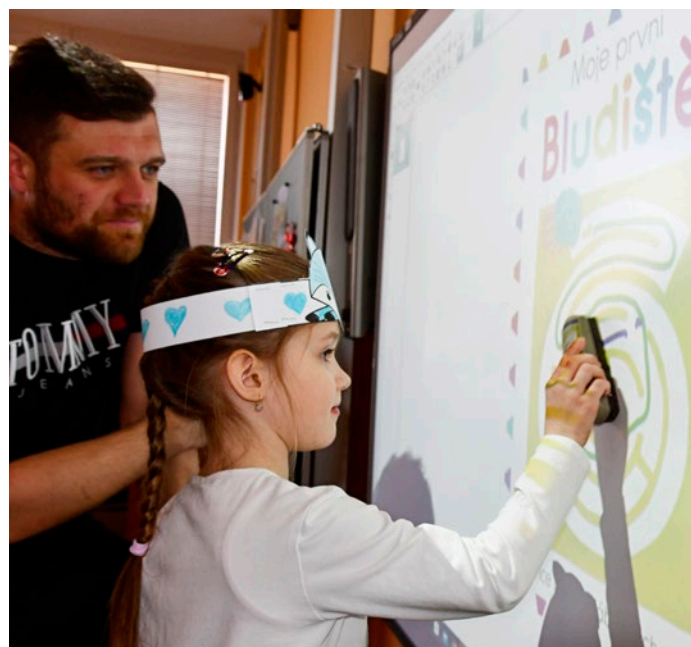
Zápis se konaly také v MŠ a ZŠ Dvorská.