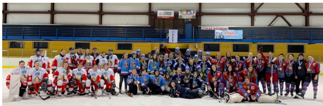
Hokejový turnaj v Blansku.

Acce se zúčastnily čtyři týmy složené z hráček týmů HC Rytířky Blansko, WHC Valkyries Brno, HC Slezan Opava a HC Rebels Prostějov. Turnaj se nesl v duchu přátelství, soudržnosti a lásky k hokeji, takže i přes obvyklou rivalitu