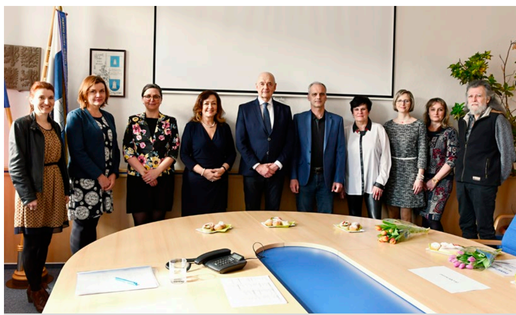
Společná fotografie oceněných pedagogů s vedením města.