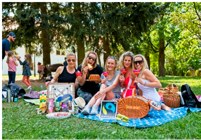
V zámeckém parku se uskuteční Férová snídaně.

Na to reaguje systém Fairtrade. Pěstitelé ze zemí globálního Jihu si díky němu mo-