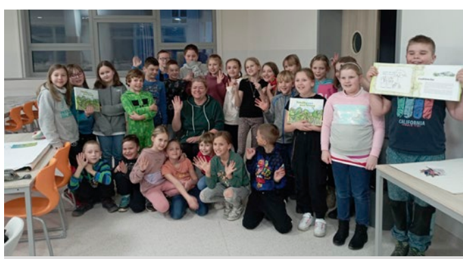
Děti ve škole TGM zažily Družinový podvečer mezi řádky.

U příležitosti výročí narození dánského pohádkáře se od roku 2000 v mnoha knihovnách po celé zemi pořádá Noc s Andersenem. Na ulici Rodkovského se v pátek 10. března odpoledne sešly děti z 5. a 6. oddělení školní družiny, aby se pod vedením svých vychovatelek po dobu příštích tří hodin naplno oddaly radosti z objevování, percepčním aktivitám a relaxaci. Čekal je totiž „Družinový podvečer mezi řádky“.