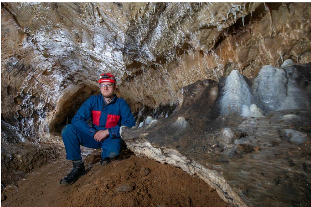
Jeskyně Výpustek nabízí zážitkovou trasu.

čarodějnic. Výpustek v sobotu 27. května 2023 ozvláštňují Projekt XIII – koncert s video-