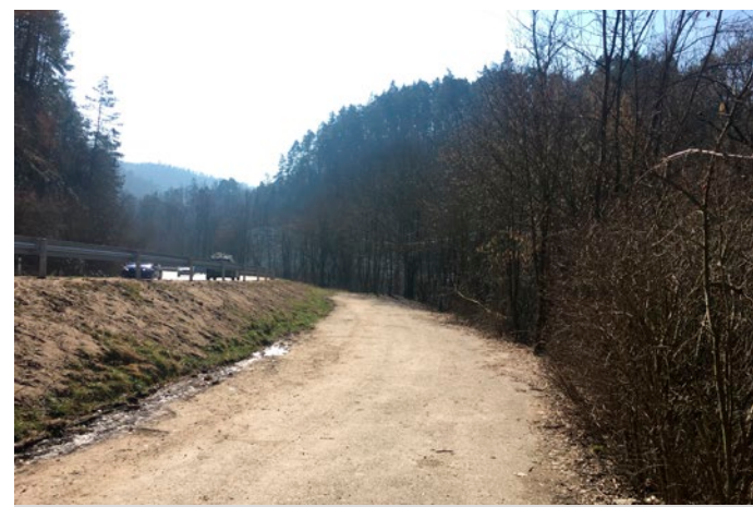
Nová cyklostezka povede podél řeky Svitavy.

sko stalo součástí brněnské Metropolitní oblasti ITI. Díky tomu lze získávat podporu pro projekty, které mají regionální přesah,“ doplnil Jiří Crha.