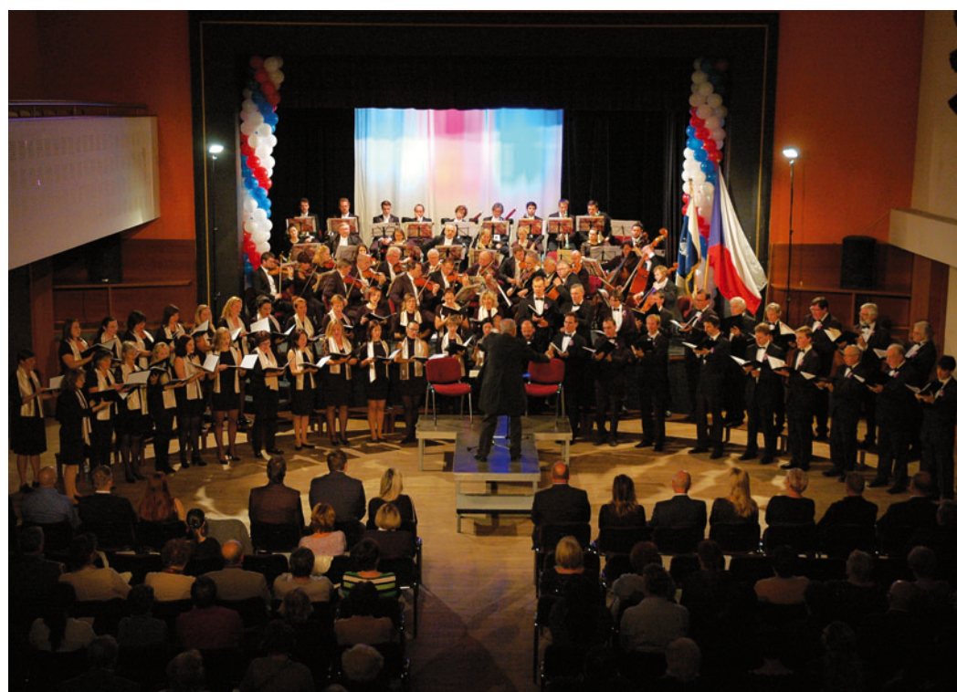
Vyvrcholením oslav byl večerní koncert Smíšeného pěveckého sboru Rastislav a komorního orchestru Czech Virtuosi.