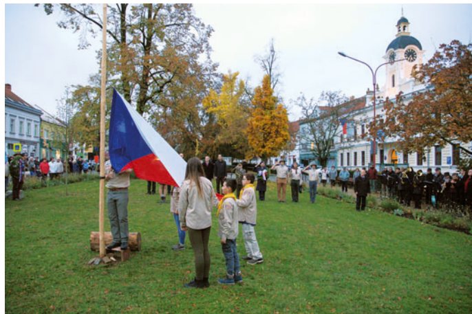
Vzpomínkový ceremoniál proběhl na náměstí Svobody v Blansku.