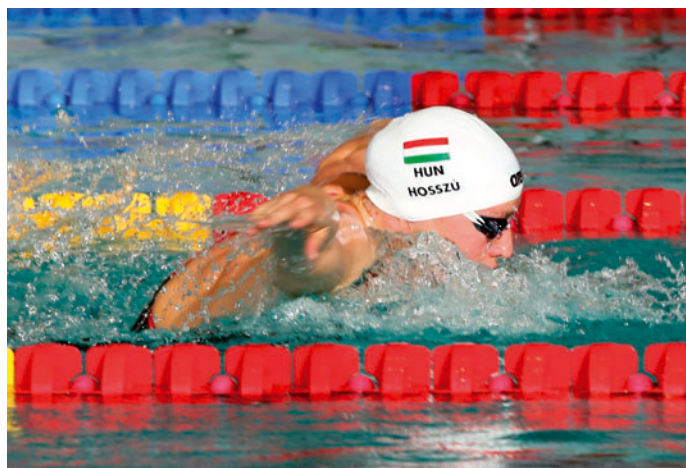
Do Brna zavítala také aktuální nejlepší plavkyně světa Katinka Hosszú.