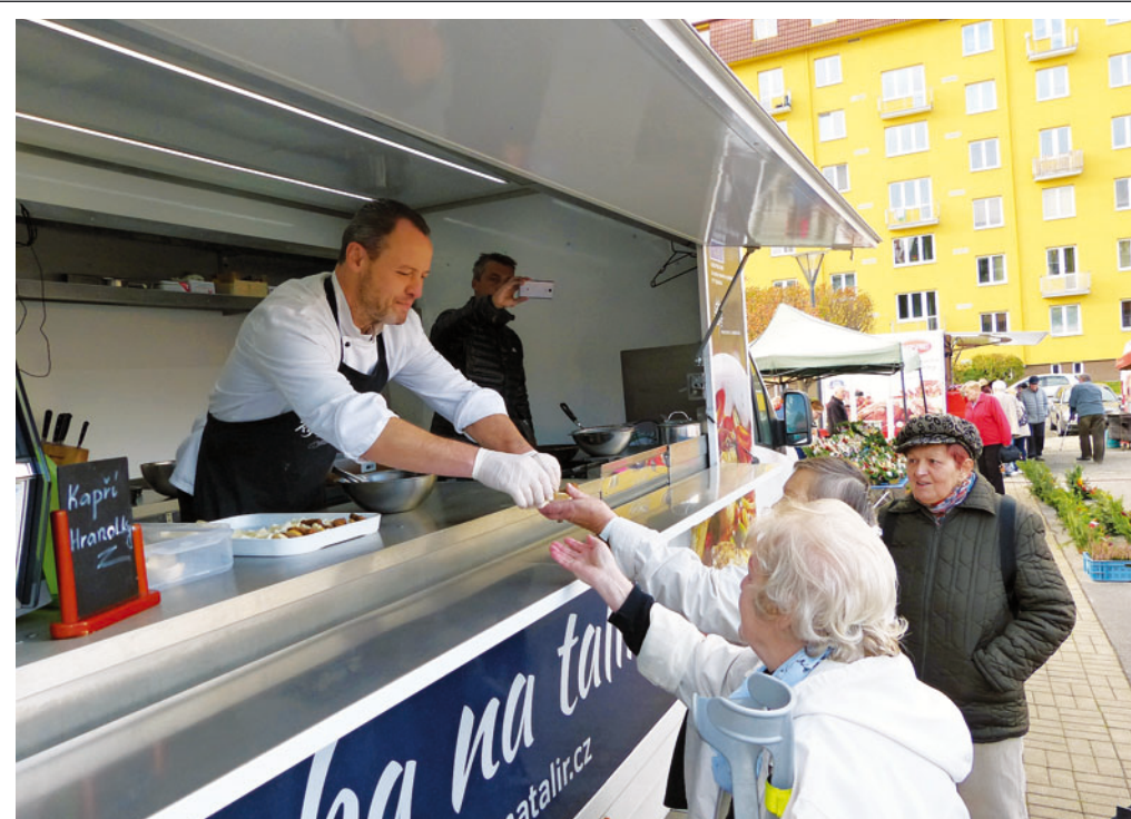
Farmářské trhy s ochutnávkou rybích specialit proběhly ve čtvrtek 25. října. V rámci projektu Ryba na talíři mohli letos návštěvníci trhů ochutnat kapří hranolky nebo pstruha na vině.