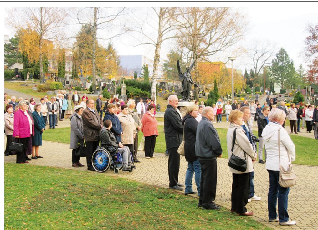
Pietní vzpomínka za zesnulé spoluobčany zorganizovala na neděli 4. listopadu Komise pro občanské záležitosti města Blanska spolu s církví římskokatolickou a Církví československou husitskou. O hudební produkci se postaraly Dechová hudba Blansko a Martini Band.