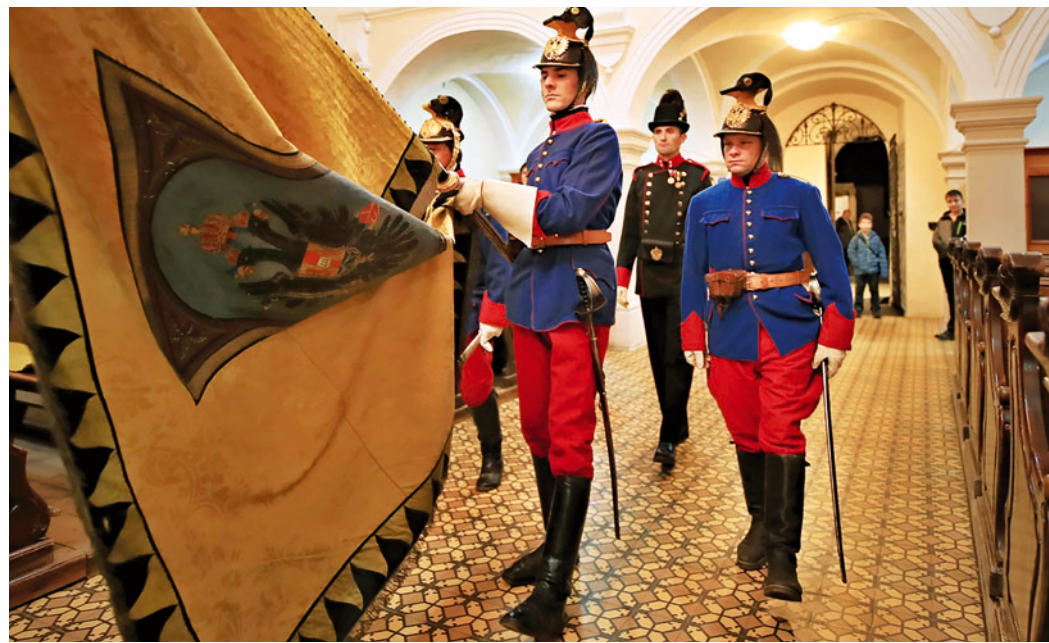
Pietní vzpomínková bohoslužba v kostele sv. Martina.