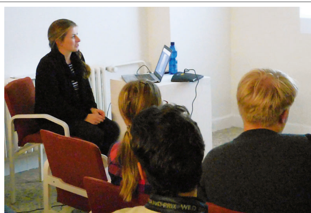
Komentovaná prohlídka výstavy V toku času a přednáška jedné z nejznámějších českých autorek Kateřiny Šedé proběhly v Galerii města Blanska v neděli 28. října. Šedá se zaměřila na svoje nejnovější projekty, které často vznikají v úzké spolupráci s městskými celky a jejich obyvateli. V rámci diskuze tak došlo i na otázky, které trápí Blansko z pohledu jeho obyvatel.

ulic, a dále zemědělský objekt za Lažánkami směr Jedovnice, dům č. 72 a dílna Na Harbechách.