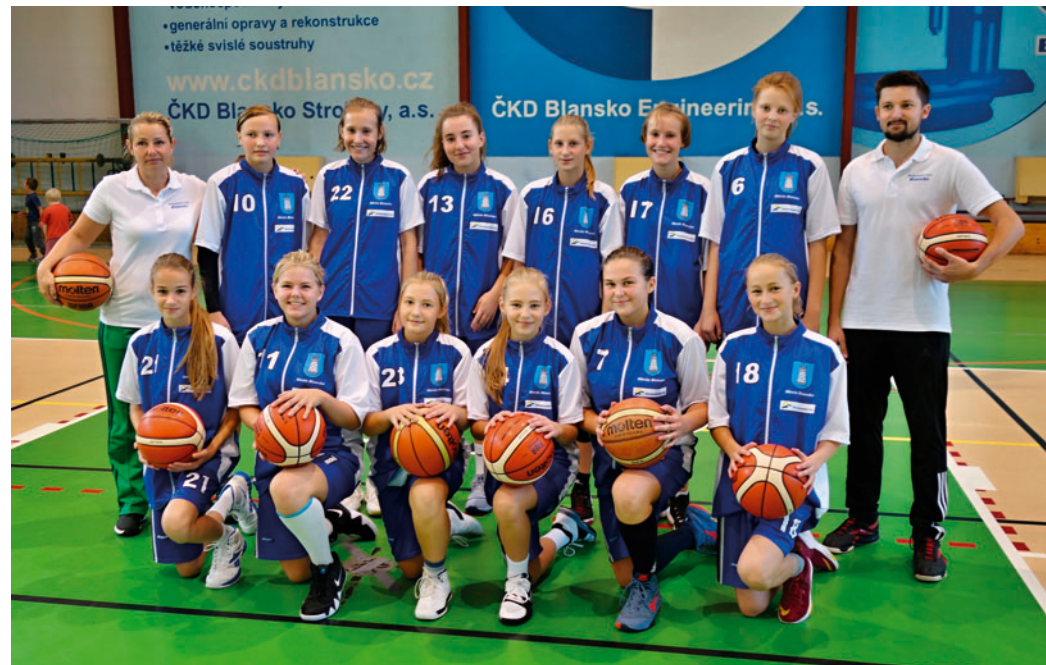
Dobry výkon se BK Blansko U15 snažilo zopakovat 10. listopadu na domácí palubovce proti vedoucímu týmu soutěže BK Žabiny Brno B.