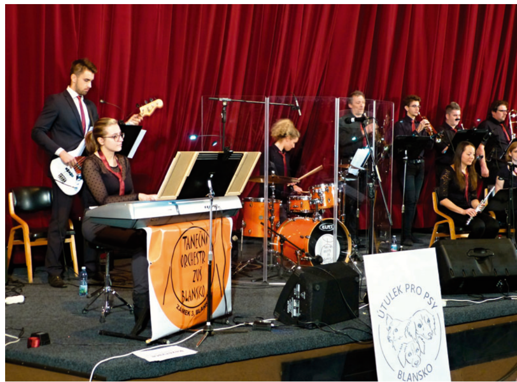
Ve foyeru Kina Blansko je navíc instalována tematická výstava prací žáků výtvarného oboru ZUŠ Blansko příznačně nazvaná Pes přítel člověka. K vidění zde bude do konce tohoto roku.

Vánoční charitativní koncert ve prospěch psího útulku opět připravily Služby Blansko ve spolupráci se Základní uměleckou školou Blansko. Odehrál se v pátek 7. prosince v sále zaplněného blanenského kina. Organizátorům se letos podařilo vybrat v rámci dobrovolného vstupného neuvěřitelných 28.600 korun. Peníze půjdou na krmivo a veterinární péči. » red