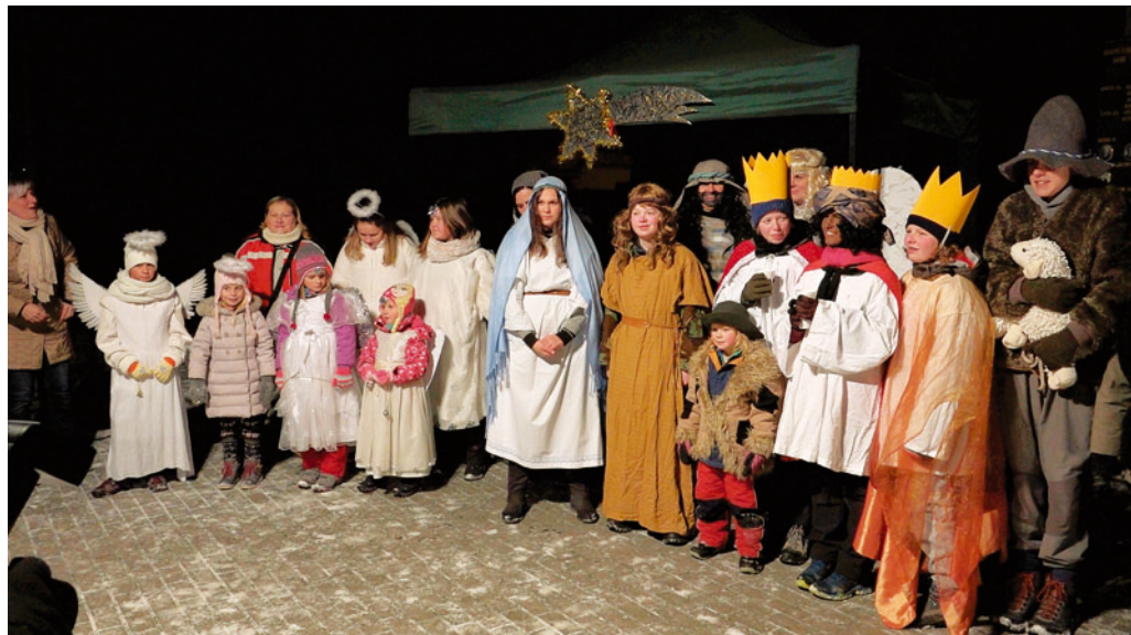
V rámci kulturního programu v Dolní Lhotě vystoupili nejen malí andělé, ale i postavy z Betléma.

Tradici rozsvěcení vánočního stromu dodržují také jednotlivé části města Blanska. Začátek adventu v těchto obcích mnohdy doprovází i kulturní program. Zatímco přímo v Blansku se vánoční strom poprvé rozzářil v pátek 30. listopadu, v místních částech většinou svoje stromy rozsvítili až v sobotu 1. prosince. Na Obůrce ještě o týden o později. » red