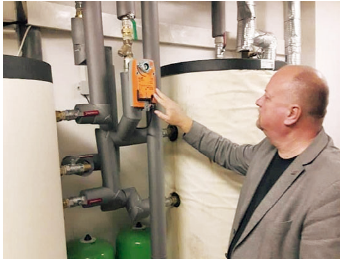
Modernizace přípravy teplé vody v Domě s pečovatelskou službou na Písečné.

„Současné s tím město Blansko, ve spolupráci se současným