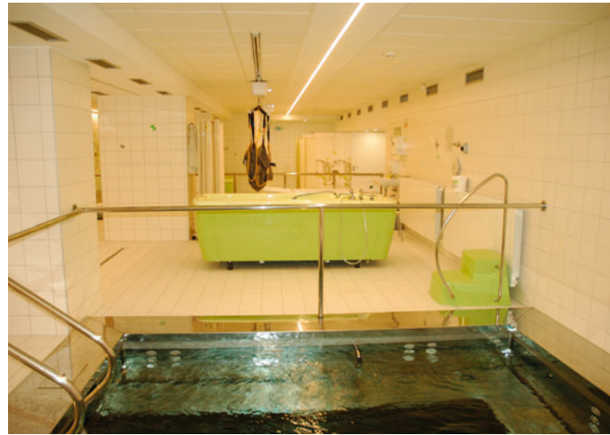
Rekonstrukce rehabilitace , která přišla na dvaatřicet milionů korun, byla dokončena v závěru prázdnin. Aktuálně jsou tyto nové moderní prostory ambulantní části rehabilitace v plném provozu.