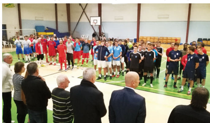
Slavnostního zahájení se zúčastnila, kromě samotných mužstev a fotbalových funkcionářů, také rodina Němcova.