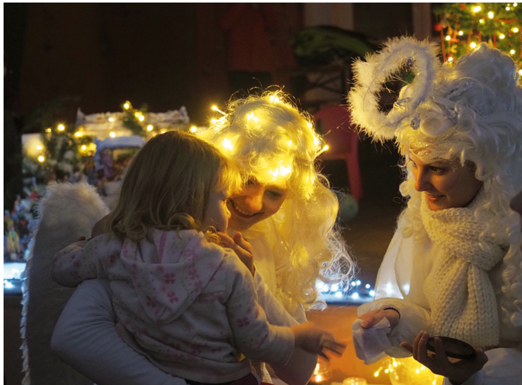
V Lažánkách bylo rozsvícení vánočního stromu spojeno s mikulášskou nadílkou.