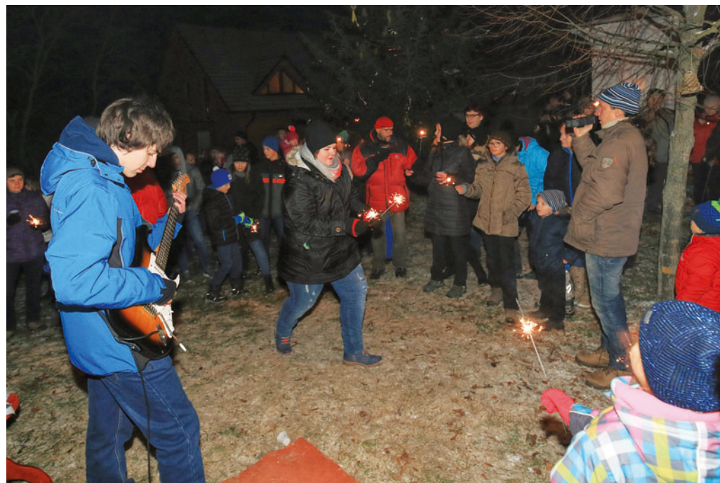
Klepačovští letos podesáté rozsvítili svůj strom u zvoničky, kde se také zpívalo a hrálo.