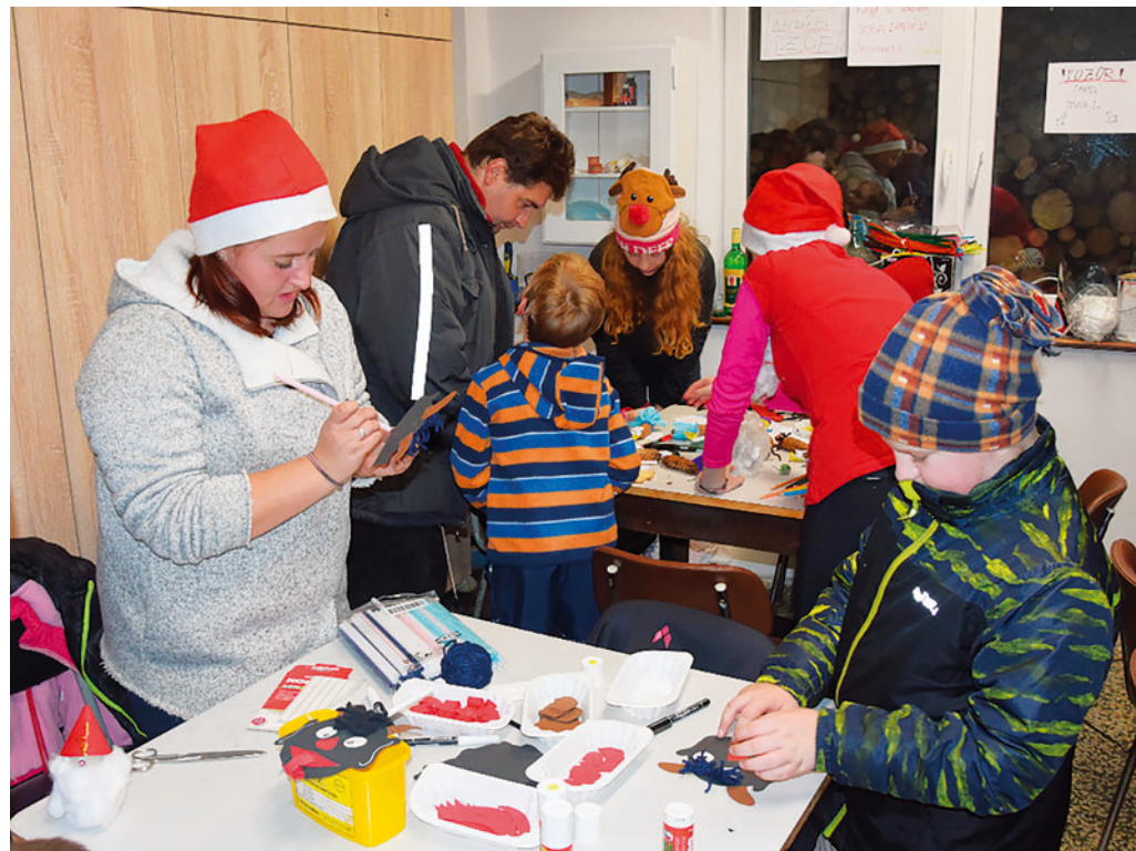
Součástí akce Rozsvícení vánočního stromu na Těchově byla v sobotu 24. listopadu kromě kulturního programu i Ježíškova dílna pro děti.