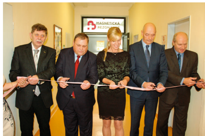
O otevření magnetické rezonance Nemocnice Blansko usilovala dlouhých devět let. Musela totiž nejdříve splnit celou řadu podmínek nezbytných pro schválení stavby. Jednou z nich byla například povinnost vytvořit z neurologie iktové centrum. To se podařilo před čtyřmi lety.

„Další nespornou výhodou je přesná diagnostika, šetrnost vyšetření pro pacienta a vůbec jeho dostupnost nejen pro ambulantní pacienty, ale i pacienty z lůžkových oddělení nemocnice. Celá řada vyšetření se dříve musela odesílat na jiná pracoviště, nyní