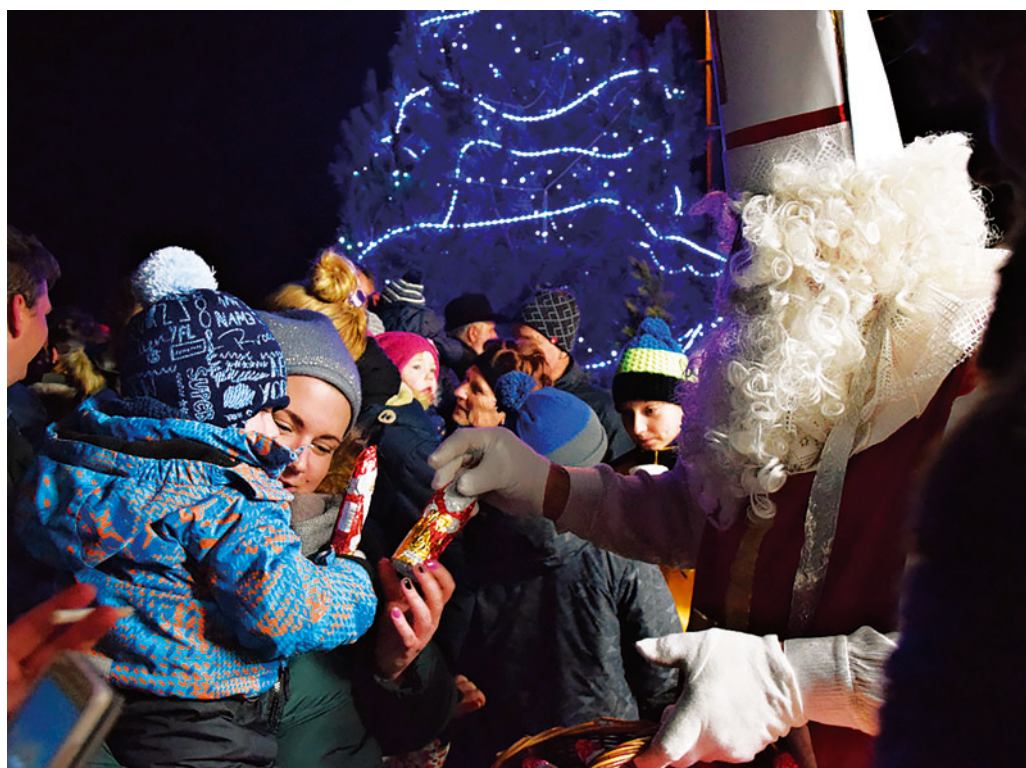
Rozsvícení vánočního stromu na Obůrce uspořádal 8. prosince místní sbor dobrovolných hasičů. V kulturním programu vystoupili žáci Základní umělecké školy Blansko.