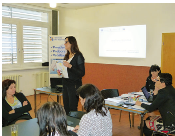
V úvodu setkání došlo na představení pilotního projektu, účastníci semináře se seznámili rovněž s výsledky dotazníkového šetření.

Obdobný workshop v Blansku je jedním ze třinácti, které probíhají v rámci společného projektu po celé republice. Jeho hlavním cílem je tvorba poptávky po tzv. upsalingu, tedy vzniku nových center v České republice, která pomáhají pečujícím rodinám.