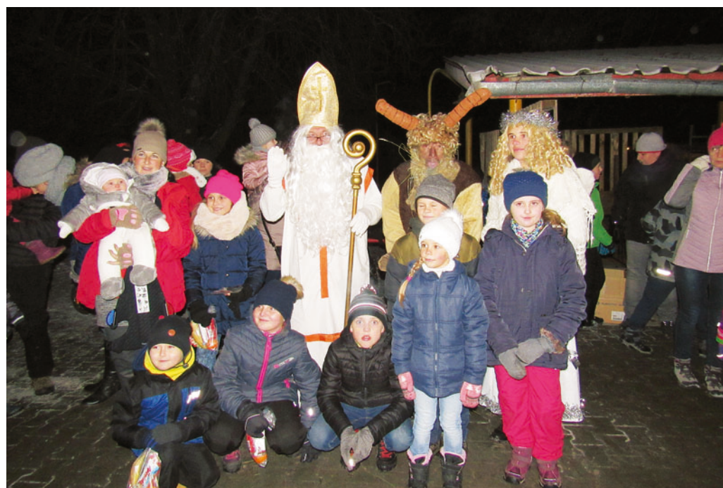
Mikuláš, anděl ani nezvedený čert nemohli chybět na rozsvícení stromu v Horní Lhotě.