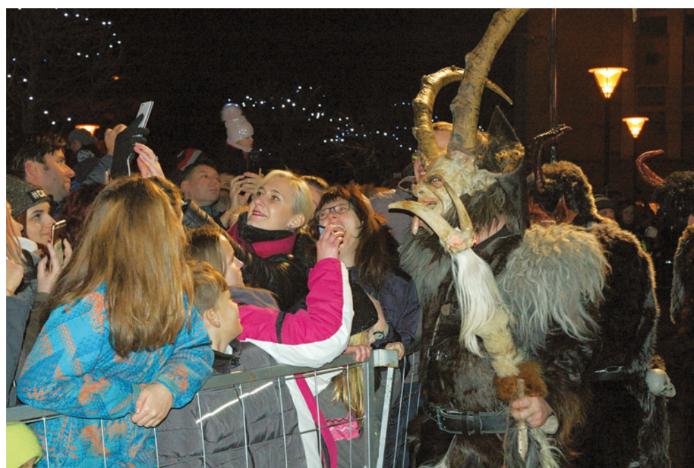
Adventní muzicírování žáků a učitelů Soukromé ZUŠ Blansko proběhlo v rámci druhé adventní soboty 8. prosince na náměstí Republiky v Blansku. V bohatém hudebním i tanečním programu se představilo na sto padesát účinkujících. Na řadu pak přišla podvečerní show s Krampus čerty. Pětadvacet originálních masek přilákalo do středu města tisíce lidí.