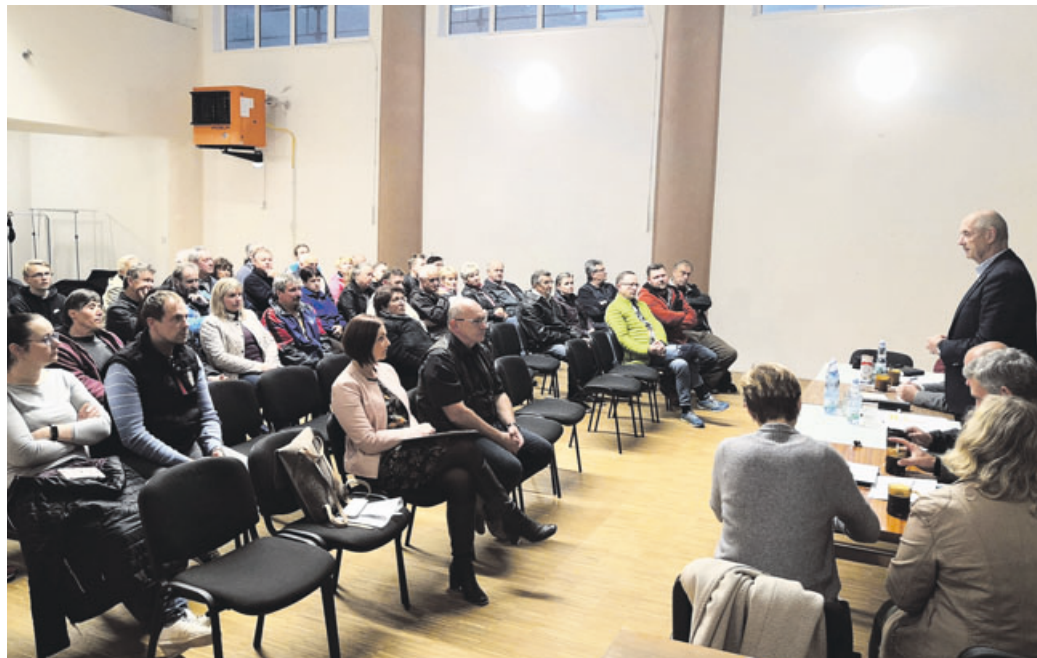
Veřejné schůze se zúčastnilo asi šedesát občanů Lažánek.

dě bylo podle starosty 20 až 25 nákupů denně, přičemž se kupovalo především pečivo, mléko, pivo a cigarety. „Prodejna byla postavena v minulosti lažánskými občany v takzvané akci Z, proto město požádalo provozovatele o její převod do svého majetku. COOP na to nepřistoupil a zřejmě nabídne budou k prodeji,“ uvedl starosta. pokračování na straně 2 >