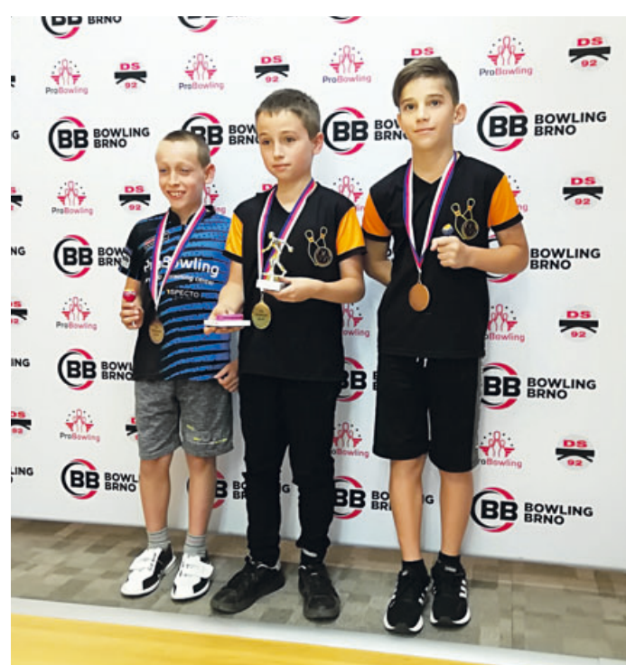
Sezónu začal blanenský Bowling poměrně úspěšně.

V naší skupině D jsou kromě Blanska také týmy z Brna, Hustopeče a Tišnova. Po prvním hracím dnu byl na výsledkovou tabulku naší skupiny velice pěkný pohled, protože dva blanenské týmy (Bowling Blansko A a Bowling Blansko B) se umístily na prvních dvou místech. To se také projevilo v hráčských statistikách, kde z prvních šesti míst obsadili