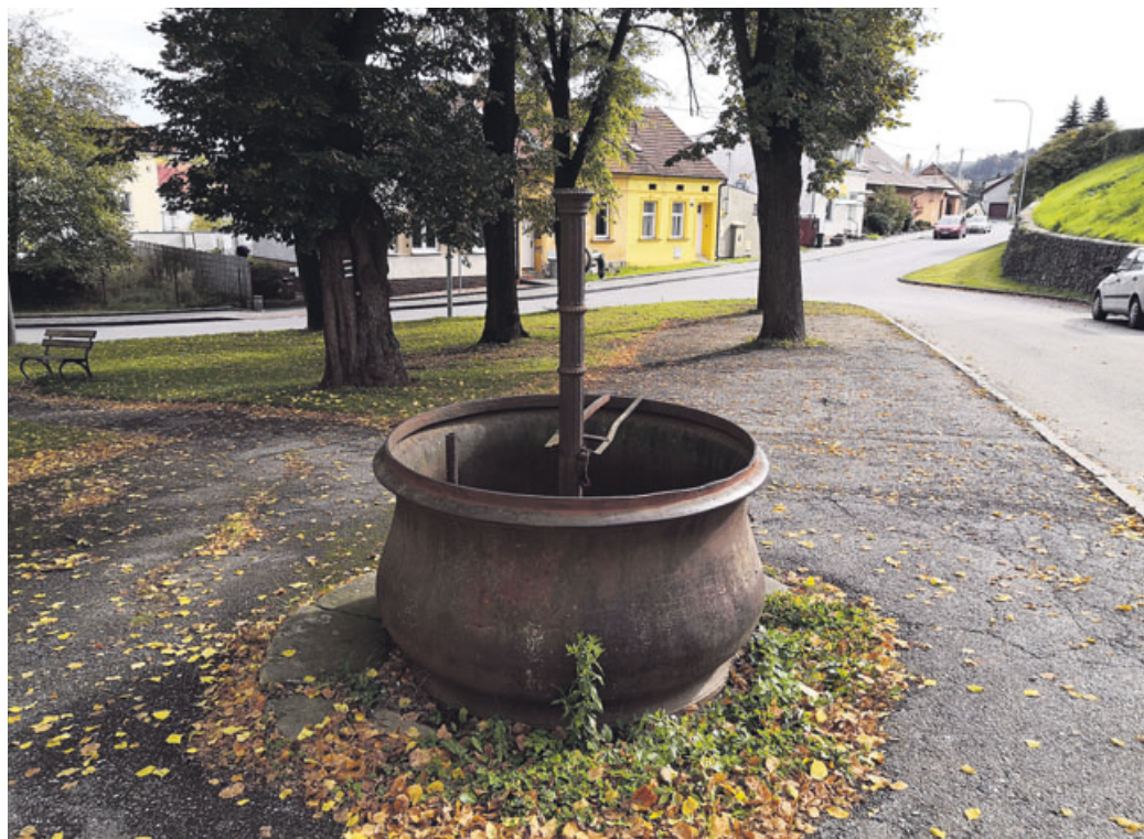
Historická kašna na Starém Blansku by měla podle návrhatele projít renovací.

Ve druhém kole byly vybrány čtyři návrhy: rozšíření dětského hřiště u kruhového objezdu v Bezručově ulici, za-