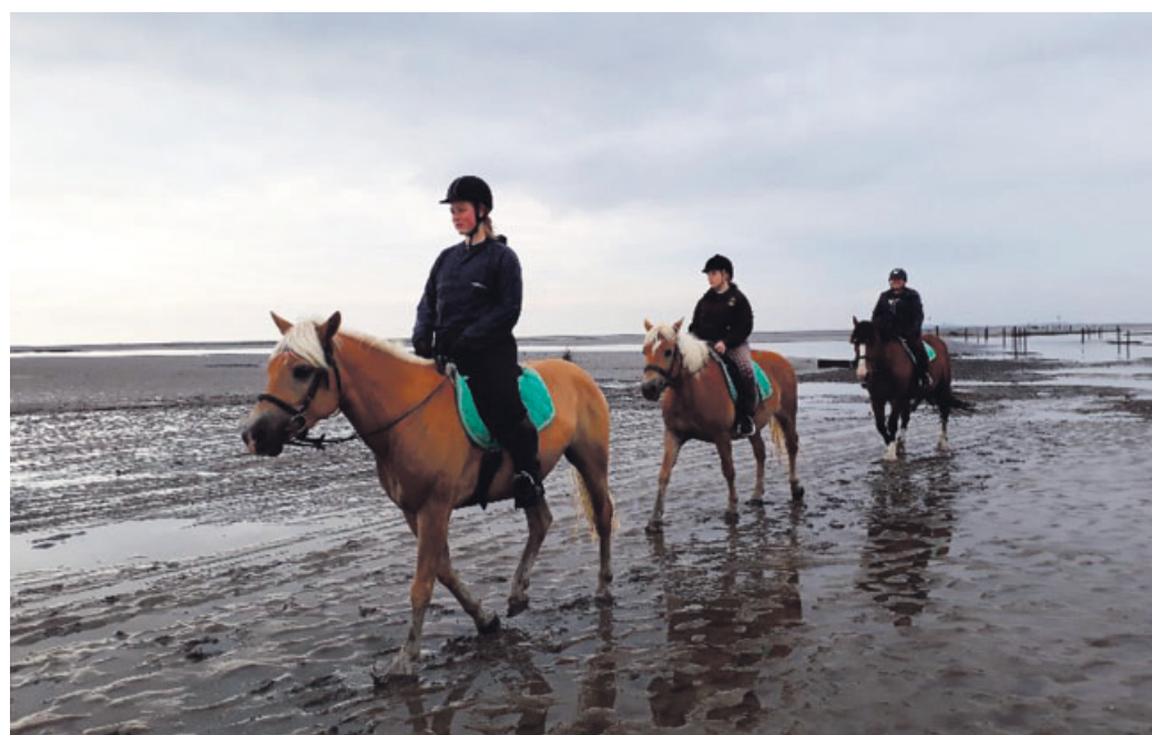
Wattové pláně je možné pozorovat i z koňského hřbetu.