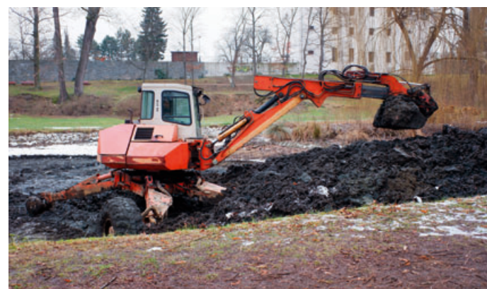
Do zámeckého parku dorazila těžká technika

Rybník v parku u blanenského zámku je už od podzimu vypuštěný. Zatím jeho okolí zkoumali nejrůznější odborníci a dělníci čekali na potřebná povolení i vhodné počasí. Teď už dorazila i těžká technika a začala rybníček odbahňovat. Práce jsou naplánované nejméně na dva měsíce pokračování na straně 4 >