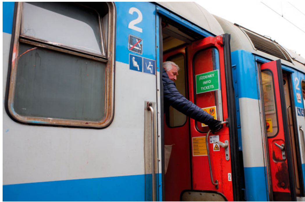
Pasažéři bez platné jízdenky musejí nastoupit do zeleně označeného vagonu

„Vagon se zeleným pruhem?“ odpovídá paní Žáčková se zvednutým obočím na dotaz, zda o novém opatření slyšela. „To je pro nás novinka,“ dokončuje za ni její manžel. Ale to už k nástupišti přijíždí vlaková souprava ČD a čerstvě poučené cestující hledají speciální značení. Úspěšně. „Tady je!“ ozve se. Vagon se (přesně podle instrukcí na internetových stránkách JMK)