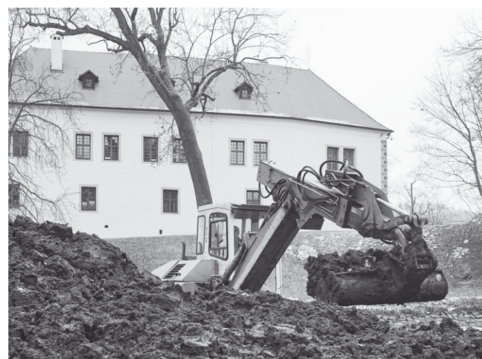
Bagry odstraňují sedimenty, zpevní se břehy a upraví ostrůvek do podoby z 18. století