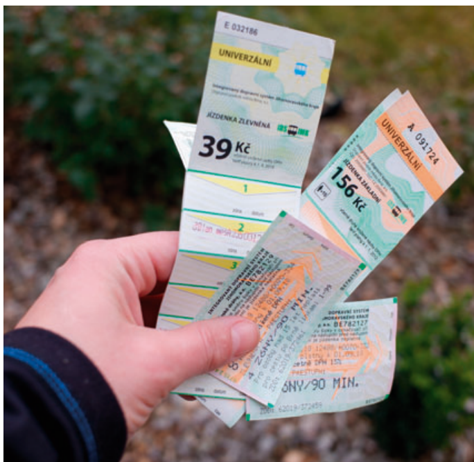
Ve vlacích v rámci kraje platí už jen tzv. idosky

pravili z Blanska do Brna, to potvrzují. „Kupujeme vždycky jízdenky IDS, protože jsou výhodnější než ty od Českých drah. Mimo jiné s nimi pak v Brně jezdíme po městě tramvají.“