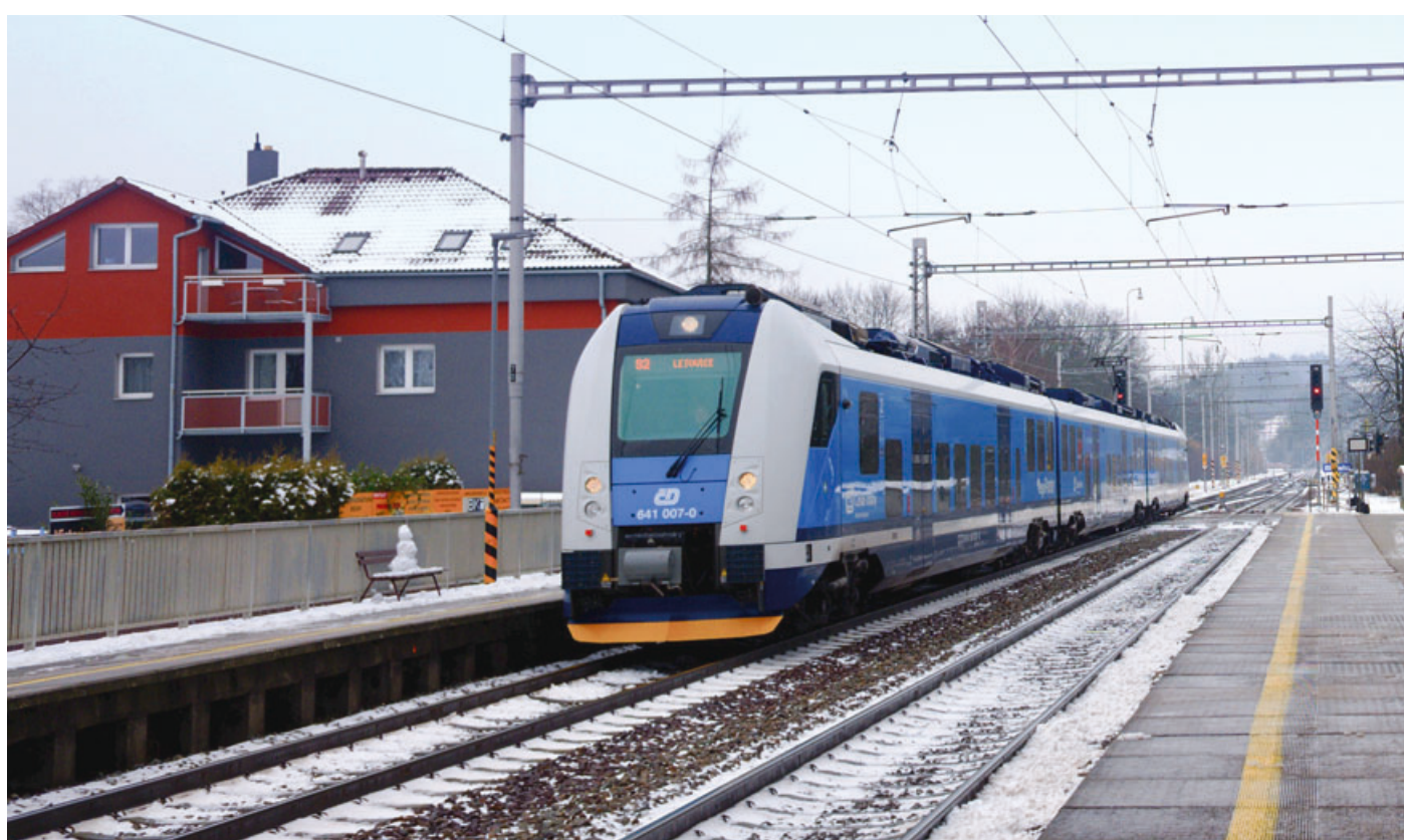
Od Nového roku už lze při cestování vlakem po kraji koupit jízdenku ČD pouze pro jízdu rychlíkem

Na první změnu narazíte na vlakovém nádraží hned u pokladny. Pokud cestujete osobním nebo spěšným vlakem v rámci Jihomoravského kraje, pokladní vám nově prodá