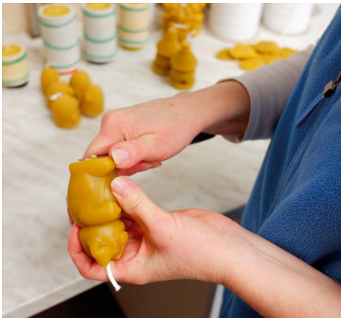
Kromě svíček v dílně vyrábějí vánoční ozdoby i tvarově komplikovanější odlitky, například betlémy

Pokud pozvání přijmete, vaše první kroky povedou do dílen, kde se seznámíte se základy řemesla. „Často se stane, že k nám na trzích přijde zákazník a řekne: ‚To je drahý! Ale přitom si neuvědomuje, kolikrát bereme tu svíčku do ruky. Nejde jenom o to nalít vosk do formičky. Musíte ten vosk nejdřív získat od včel, vyčistit ho, vyladit knot, svíčku seříznout, popř. zespuď zatavit,“ popisuje cestu k finálnímu