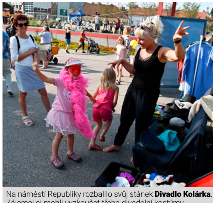
Na náměstí Republiky rozbalilo svůj stánek Divadlo Kolárka . Zájemci si mohli vyzkoušet třeba divadelní kostýmy.