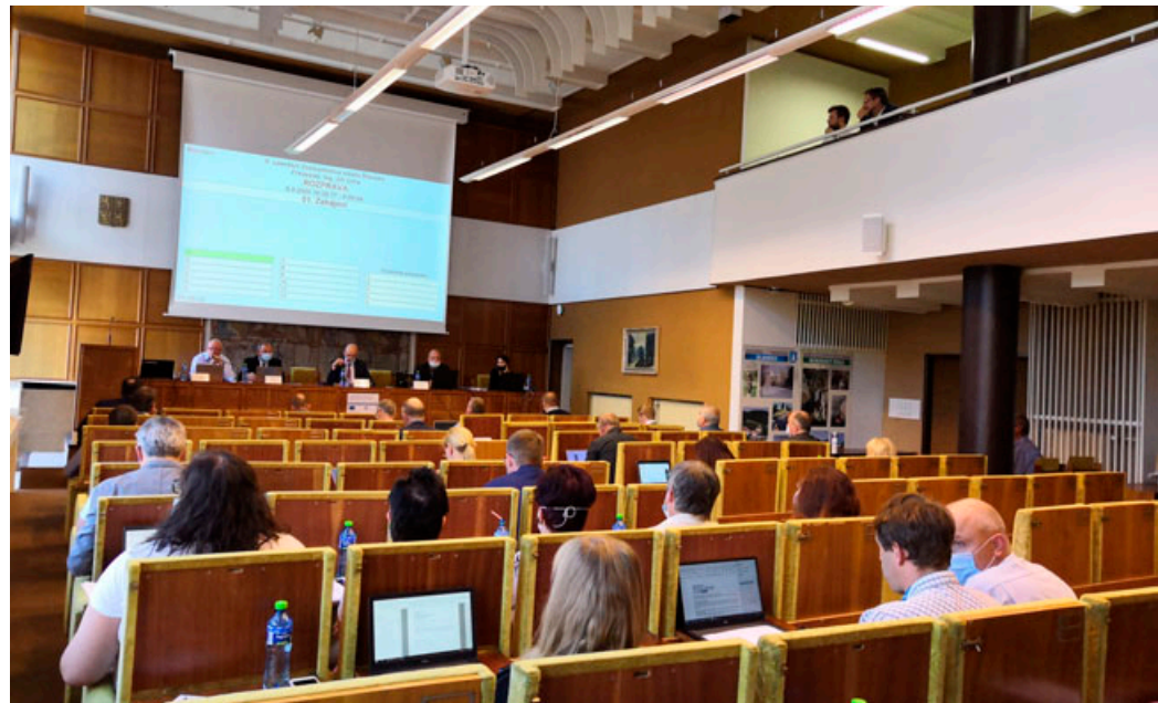
Zastupitelstvo města se sešlo na zasedání v úterý 8. září.