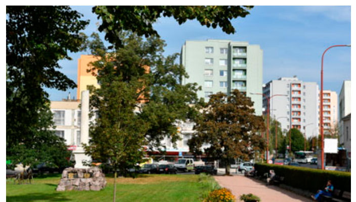
Současný pohled na bytové domy v Bezručově ulici.