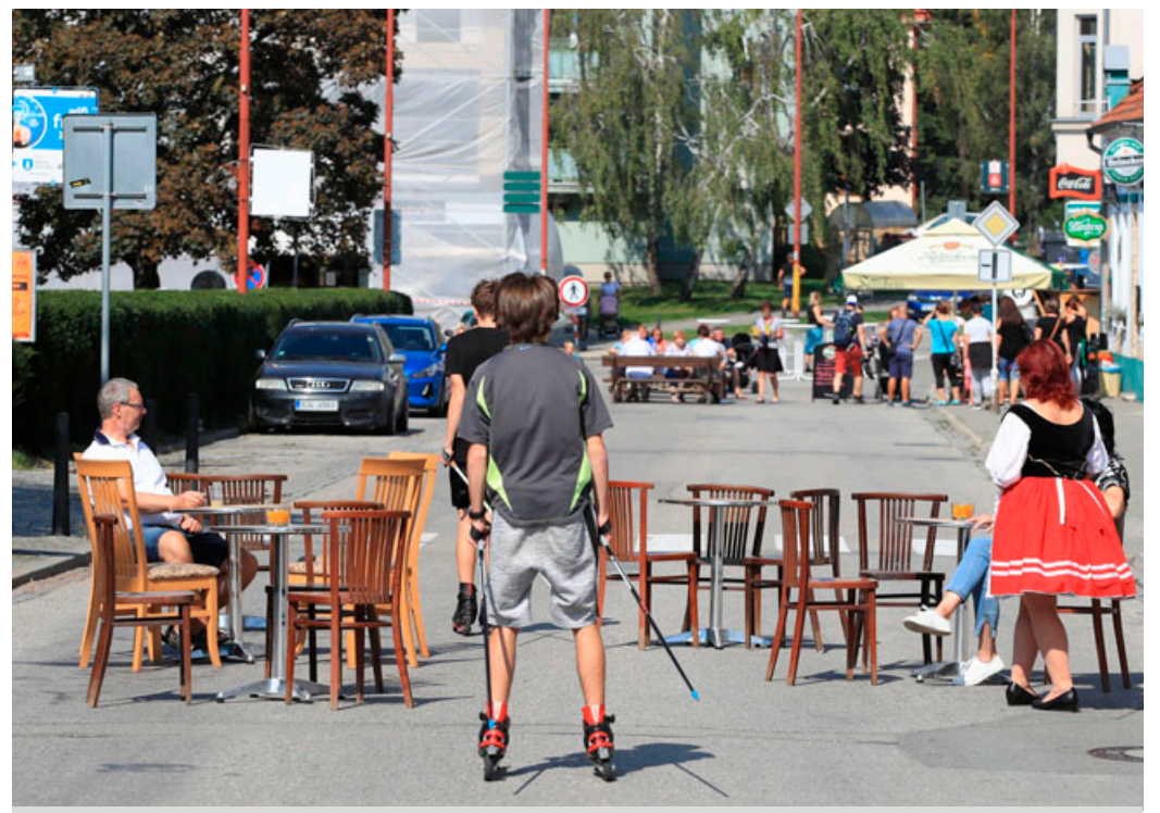
Auta v ulicích vystřídala posezení místních podniků i stánky s občerstvením . FOTO Ivo Stejskal