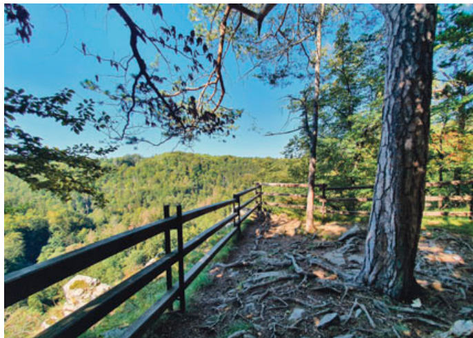
Žlutá značka dovede turisty k vyhlídce Košský spád .

ního dómu a je dnes největší propastí v ČR i v Evropě, na jejíž dno dopadá denní světlo. Je také jediným místem, kde u nás roste vzácná rostlina kruhatka matthiolova. Jakmile se nabažíte pohledu do propasti z horního můstku, vy-