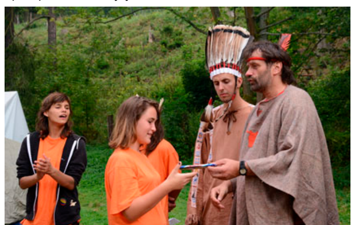
Dětem projekt nabídl desítky akcí.