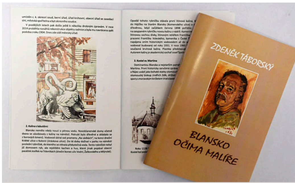
Galerie města Blanska vydala publikaci Blansko očima malíře .

roku 1990. Zdeněk Tábořský se částí své tvorby ujal role pokračování na straně 3 >