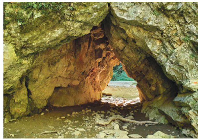
V Pustém žlebu můžete projít Čertovou brankou .