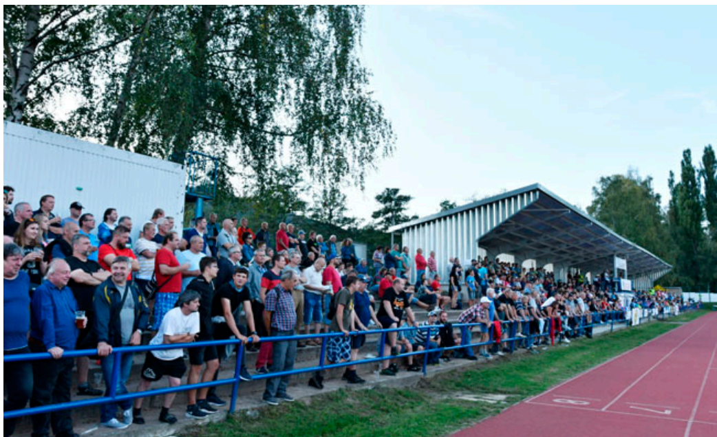
Na zápas s Duklou si našlo cestu 1 200 platících diváků.