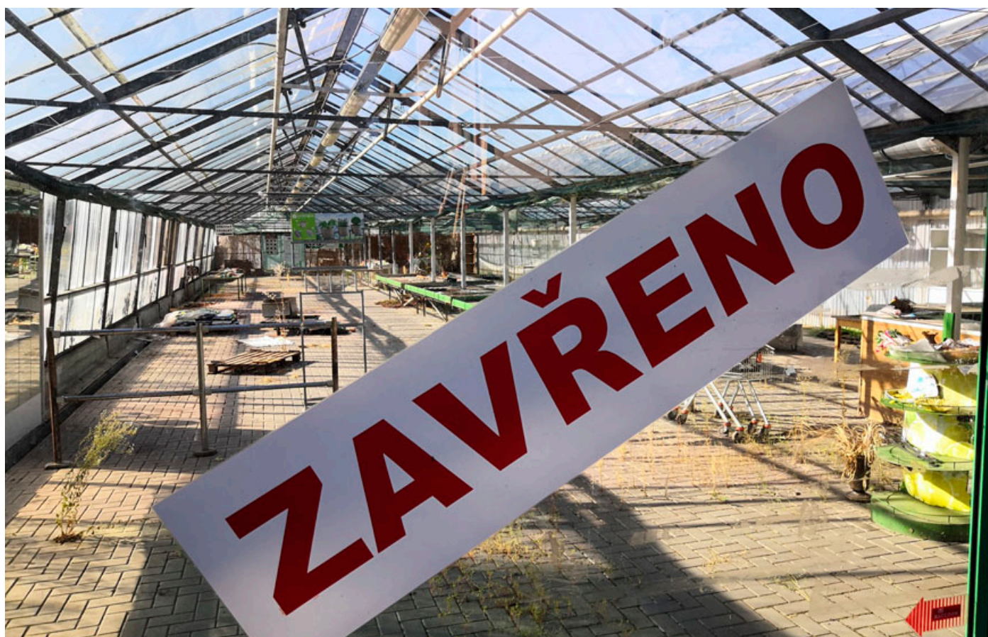
Zahradnictví je uzavřené. Na jeho místě vyroste nová obchodní zóna.

Firma se nově zavázala k tomu, že na svoje náklady do výše půl milionu korun vybuduje založení stavby lávky pro pěší vedoucí přes řeku Svitavu na Sportovní ostrov a sto-