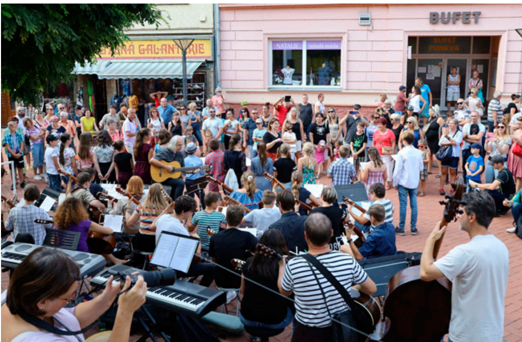
O vystoupení žáků Základní umělecké školy Blansko , která si udělala své pódium na Rožmitálově ulici, byl velký zájem.