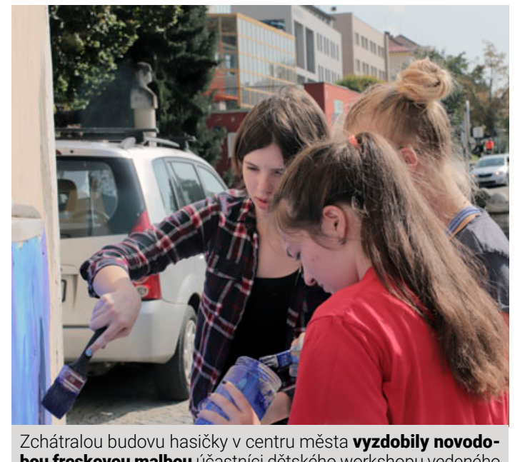
Zchátralou budovu hasičky v centru města vyzdobily novodobou freskovou malbou účastníci dětského workshopu vedeného uměleckou skupinou Comunita Fresca.