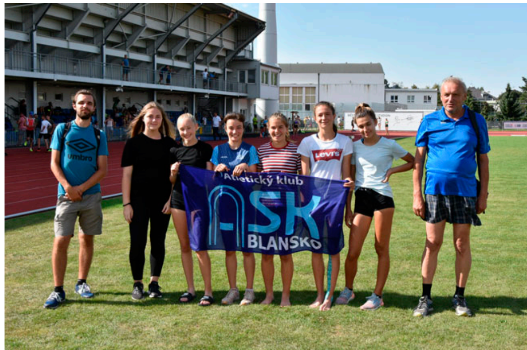
V Uherském Hradišti zážkyňe získaly šest medailí.

ČLENOVÉ KLUBU SBÍRALI MEDAILE NA ZÁVODECH PO CELÉ REPUBLICE