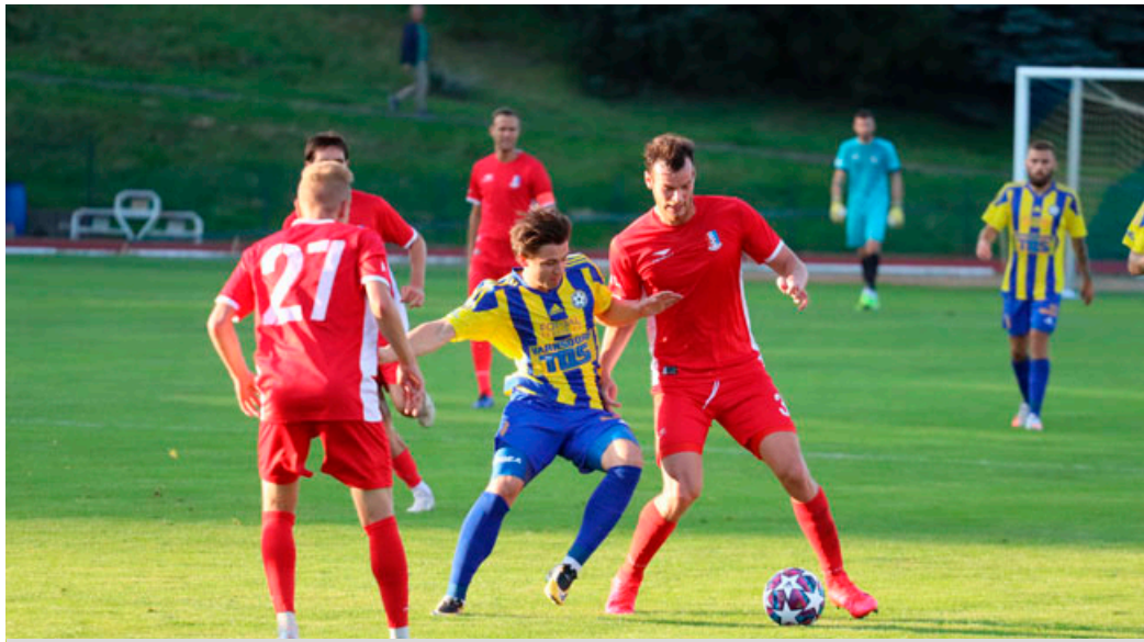
Z Varnsdorfu FK Blansko přivezlo bod.

„Potěšil mě velký zájem a nadšení fanoušků, kteří