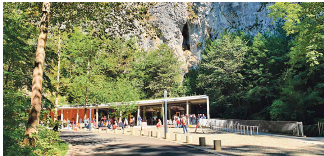
Výlet lze spojit s návštěvou Punkevních jeskyní .