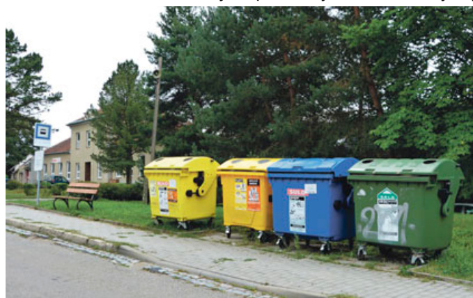
Loni se v Blansku vytrídilo skoro 1 500 tun odpadů. ILLUSTRACNÍ FOTO archiv města