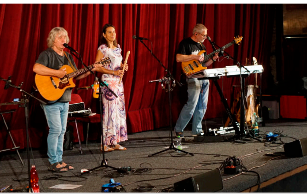
Děkujeme všem, kteří s námi strávili poslední prázdninový pátek na koncertě Pavla Žalmana Lohonky a spol. Do blanenského kina si jej přišlo 28. srpna poslechnout téměř 200 lidí. Koncert se konal na podporu Charitní záchranné sítě. Oblastní charita Blansko