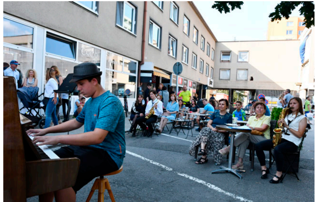
Venkovní posezení před CocoCafé zpříjemňovali celý den muzikanti z řad žáků Základní umělecké školy Blansko i místní hudebníci .