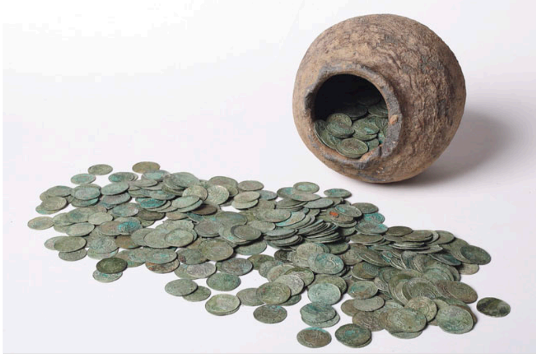
Unikátní nález 802 stříbrných mincí je zásadní pro poznávání dějin moravského mincovnictví.

„Celkem 800 kusů moravských stříbrných denárů doplňují dva kusy mincí českých denárů. V souboru zcela dominují moravské ražby knížete a krále Vratislava II., dalších přemyslovských knížat i anonymní mince z druhé poloviny 11. a počátku 12. století. Mince byly uloženy v dochované keramické nádobě a jsou ve