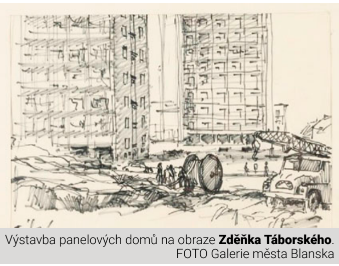
Výstavba panelových domů na obraze Zdeňka Tábořského.