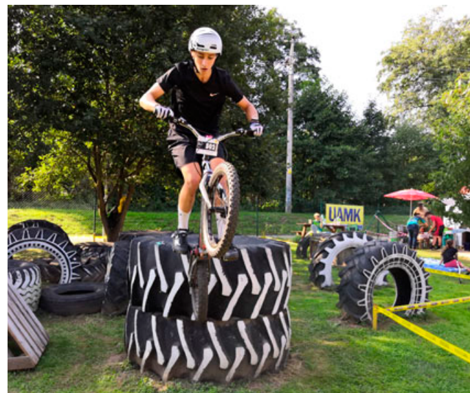
Závodníci zdolávali tratě různých obtížností.

Blanenský závod byl jeden z pěti v letošním roce, na kterém registrovaní závodníci mohli sbírat body do celkového hodnocení Českého poháru. Velký počet českých závodů se letos rušil kvůli situ-