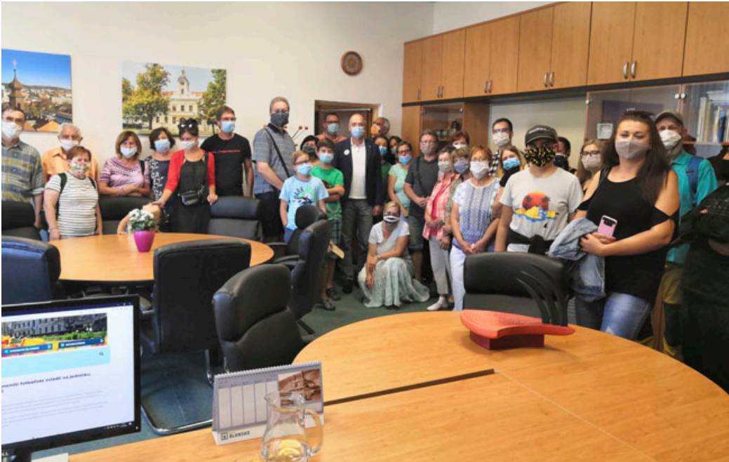
Zájemci mohli zajít na komentované prohlídky historické radnice. Součástí byla také návštěva kanceláře starosty města a odhalení tajného vchodu.

Návštěvníci středu města měli v sobotu 12. září poprvé možnost Zažít Blansko jinak. Auta v ulicích nahradili korzující lidé, hudba, stánky a posezení. Centrum zaplnili hudebníci, divadelníci, sportovní kluby, místní podnikatelé i spolky. Sousedská slavnost Zažít Blansko jinak se konala na náměstí Svobody i náměstí Republiky a v Rožmitálově ulici.