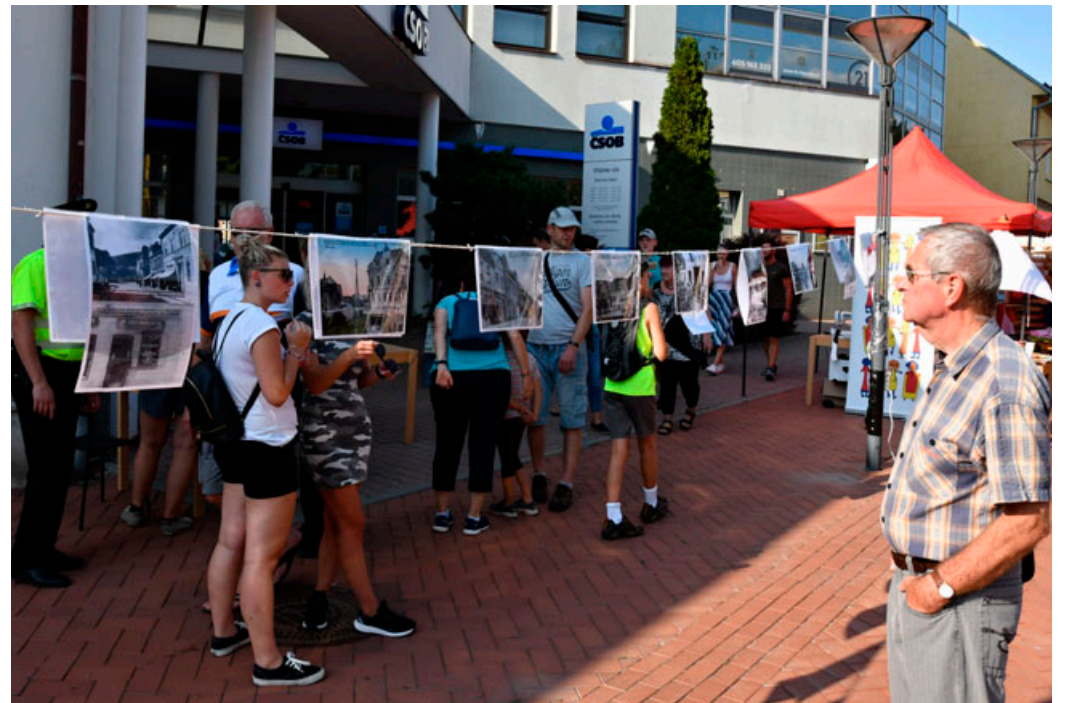
Na Rožmitálově ulici si lidé mohli na fotografiích připomenout historickou podobu Blanska .