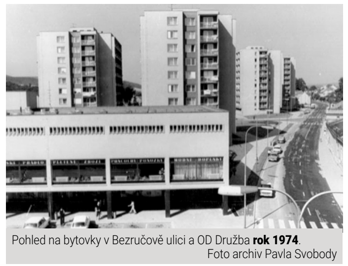
Pohled na bytovky v Bezručově ulici a OD Družba rok 1974.