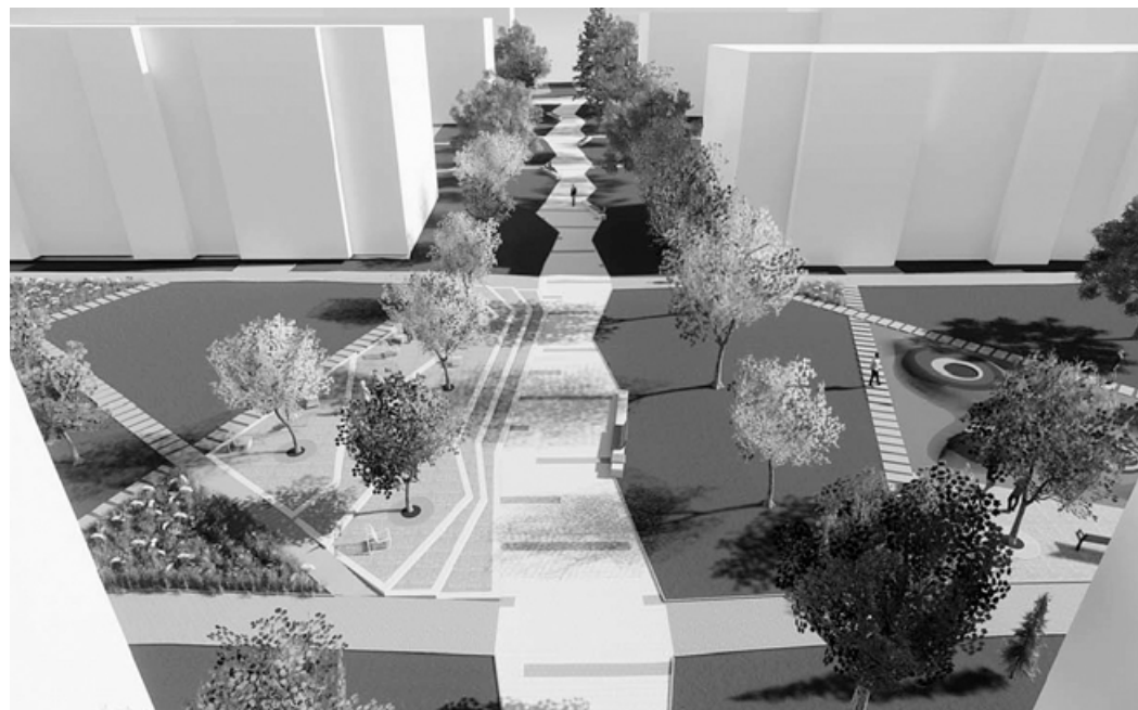
Centrální chodník dostane novou podobu.

Součástí projektu je i výsadba nové zeleně. Na sídliš-