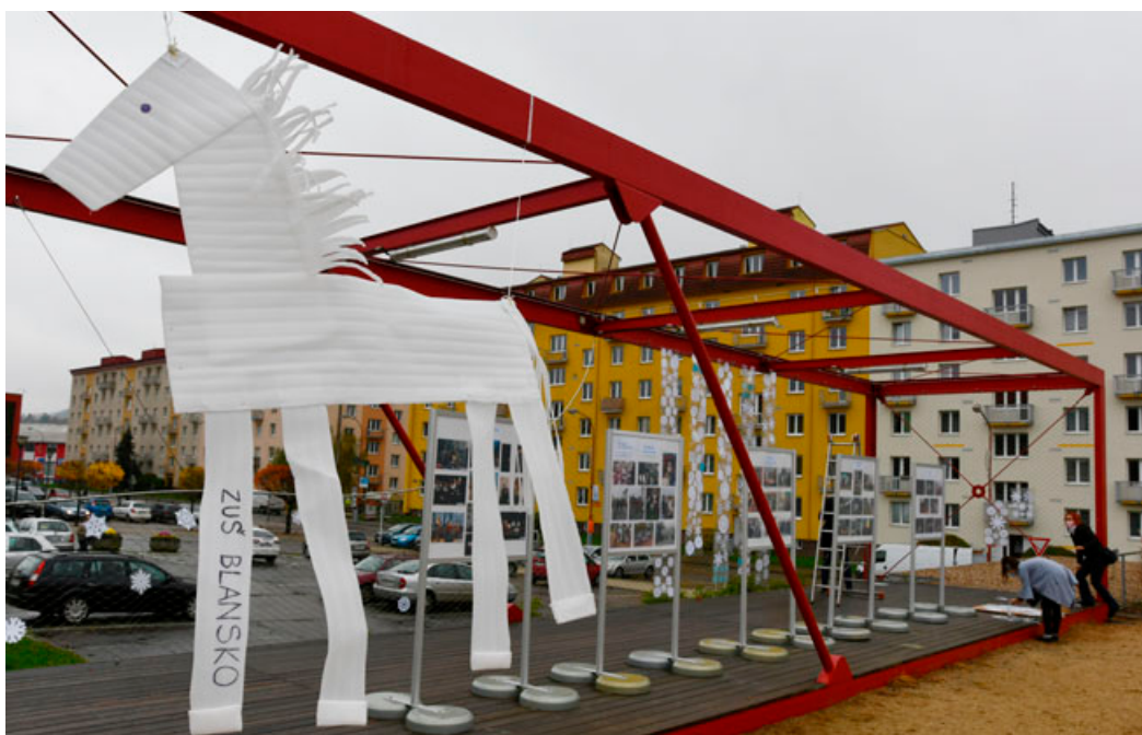
Bílý kůň vyrobený ZUŠ Blansko i sněhové vločky od dětí z blanenských mateřinek zdobily Podklí celý listopad. Stejně jako fotografická výstava z historie Vítání svatého Martina. Výstavu o životě patrona města, tradicích, legendách i gastrotipy si připravili studenti Střední školy cestovního ruchu a gastronomie Blansko.