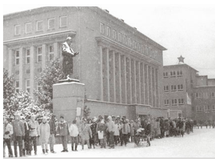
Živý řetěz se v Blansku spojil v neděli 26. listopadu 1989.

„Vlastní založení Občanského fóra (OF) v Blansku proběhlo na setkání občanů 27. listopadu ve večerních hodinách, v úterý byli jmenováni mluvčí, ve středu sestaven „akční program“, v pátek došlo k rozdělení do pracovních skupin. OF hodnotilo průběh generální stávky v Blansku jako „jednoznačný výraz většiny blanenských občanů, požadujících zásadní změny v politickém systému naší země při zachování základního socialistického charakteru státu“ a vyjádřilo protest proti pokusům vydat průběh demonstrace za jednostran-