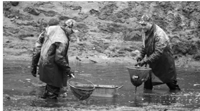
Výlov Palavy se konal v sobotu 14. listopadu.