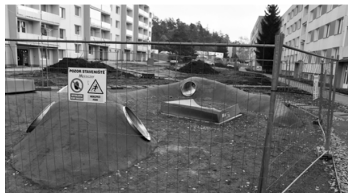
Mezi bytovkami vznikne i 3D dětské hřiště.