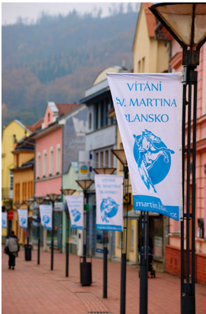
Město si největší akci roku připomnělo i výzdobou, tradiční vlajky ke svatomartinským oslavám nahradí v prosinci vánoční osvětlení.