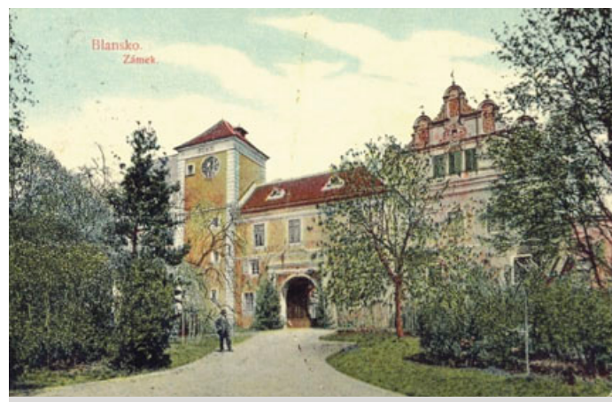
Historická podoba zámku.