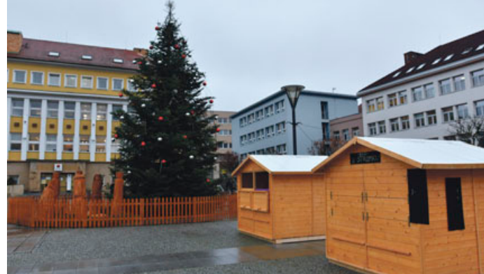
Ani letos nebude u vánočního stromu chybět dřevěný betlém a možnost občerstvení.