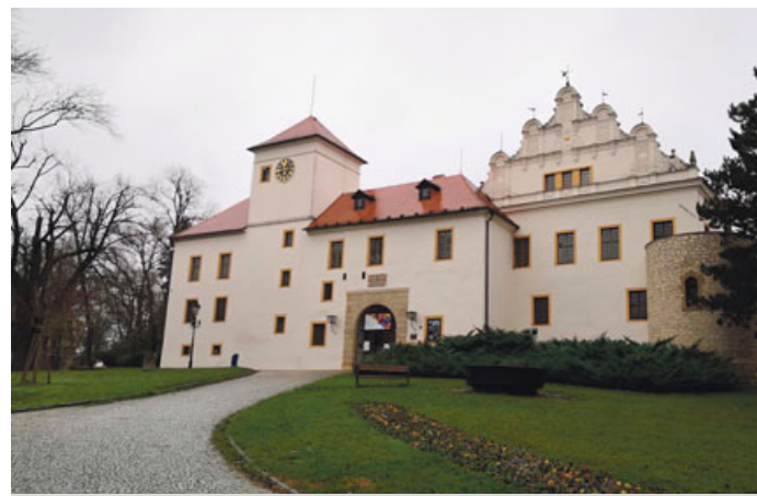
Současný pohled na blanenský zámek.

Blanenský malíř Zdeněk Táborský na svých obrazech před lety zachytil řadu míst ve městě. Některé z nich postupně zveřejňujeme v našem seriálu a přidáváme k nim současnou podobu. V šestnáctém díle přinášíme pohled na zámek. Za spolupráci děkujeme dědicům Zdeňka Táborského, Galerii města Blanska a znalci blanenské historie Pavlu Svobodovi.