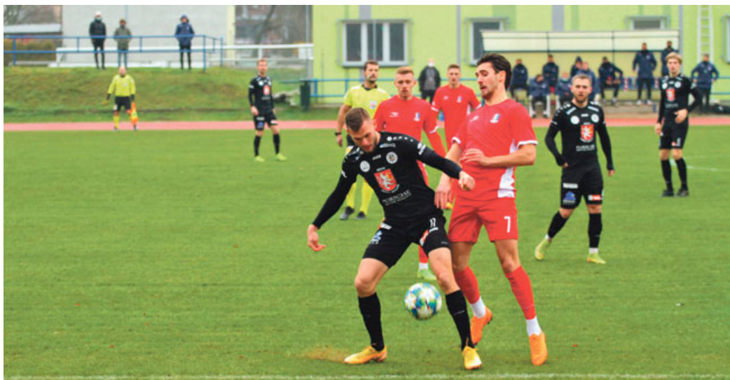
Fotbalisté doma podlehl Hradci Králové 1:2.