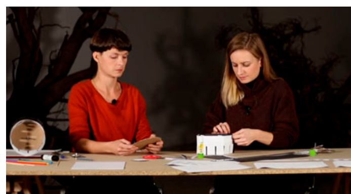
Tradiční dílny a workshopy letos nahradily videonávody zveřejňované na webových stránkách a sociálních sítích. Mezi nimi nechyběl například recept na výrobu svatomartinských rohlíčků, galerie učila zájemce, jak si vyrobit předchůdce kinematografu – zoetrop.