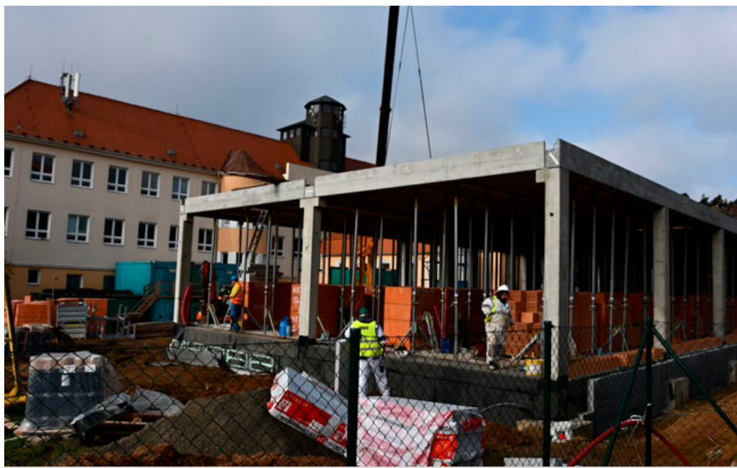
Na místě bývalých pozemků v areálu školy už stojí skelet nové kuchyně a jídelny.

V nové budově ve dvoře školy se počítá také s hygienickým zázemím pro děti, učitele i personál kuchyně. Kancelářské prostory v ní získá vedoucí