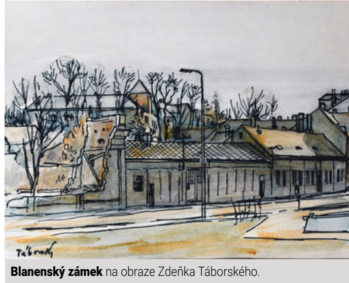
Blanenský zámek na obraze Zdeňka Táborského.