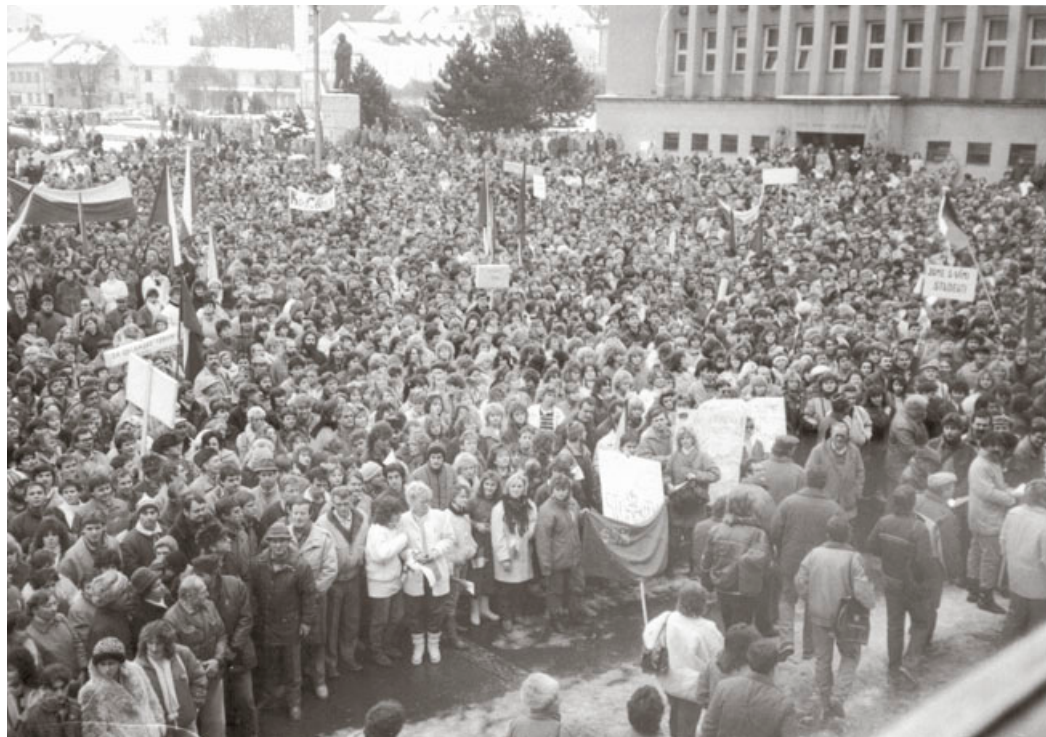
Generální stávka se konal na dnešním náměstí Republiky.