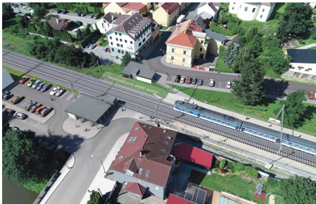
Součástí projektu přemostění je i nový podchod v místě železniční zastávky Blansko-město, v jeho okolí vzniknou dvě parkoviště pro 50 vozidel. Vizualizace: SUDOP

projevu. „Přemostění pokračování na straně 3 >