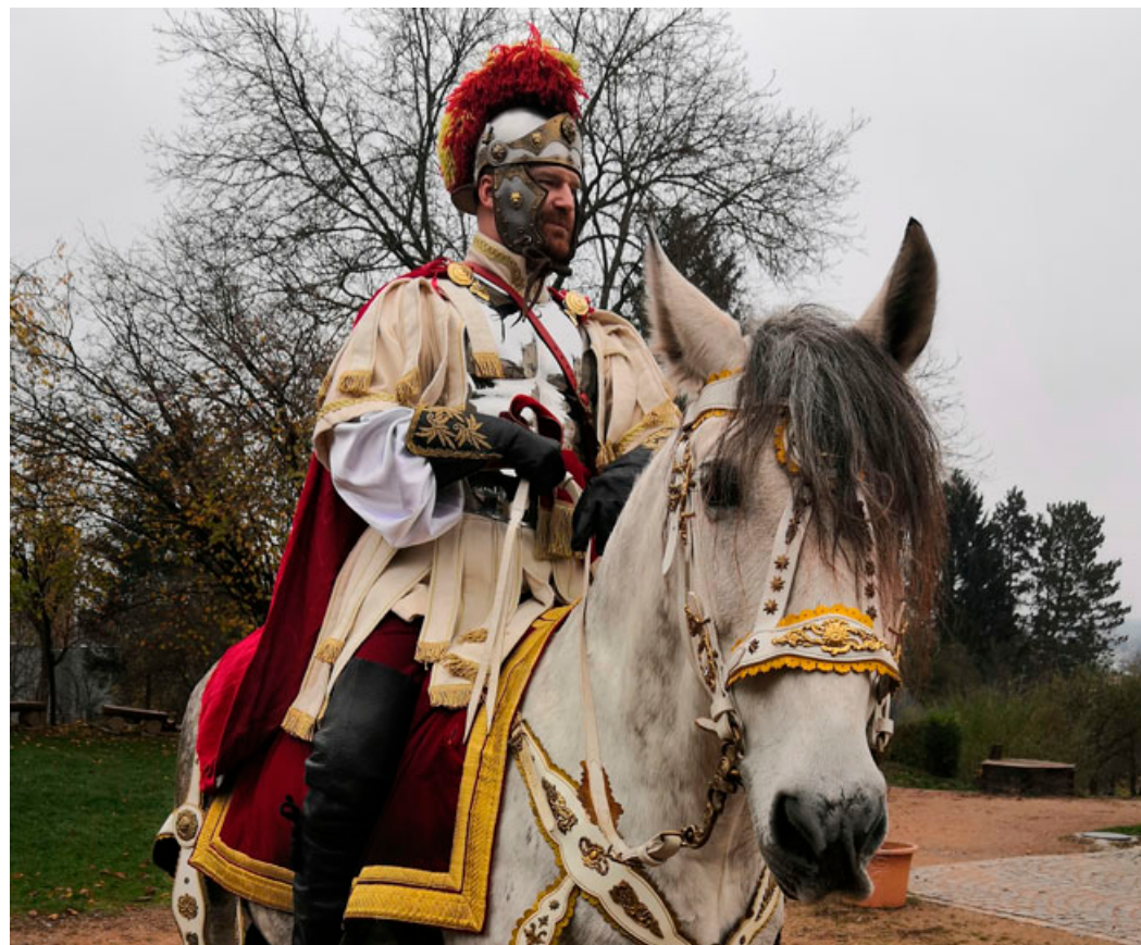
Hlavní protagonista, svatý Martin, do Blanska dorazil i přes covidová omezení i letos. Na tradiční průvod ulicemi si musí počkat do příštího roku.

i texty o životě svatého Martina, které byly součástí šifrovací hry pro veřejnost. Pozdravit místní nakonec přijel i svatý Martin na svém bělouši. Podrobnosti najdete na webových stránkách www.martin.blansko.cz .