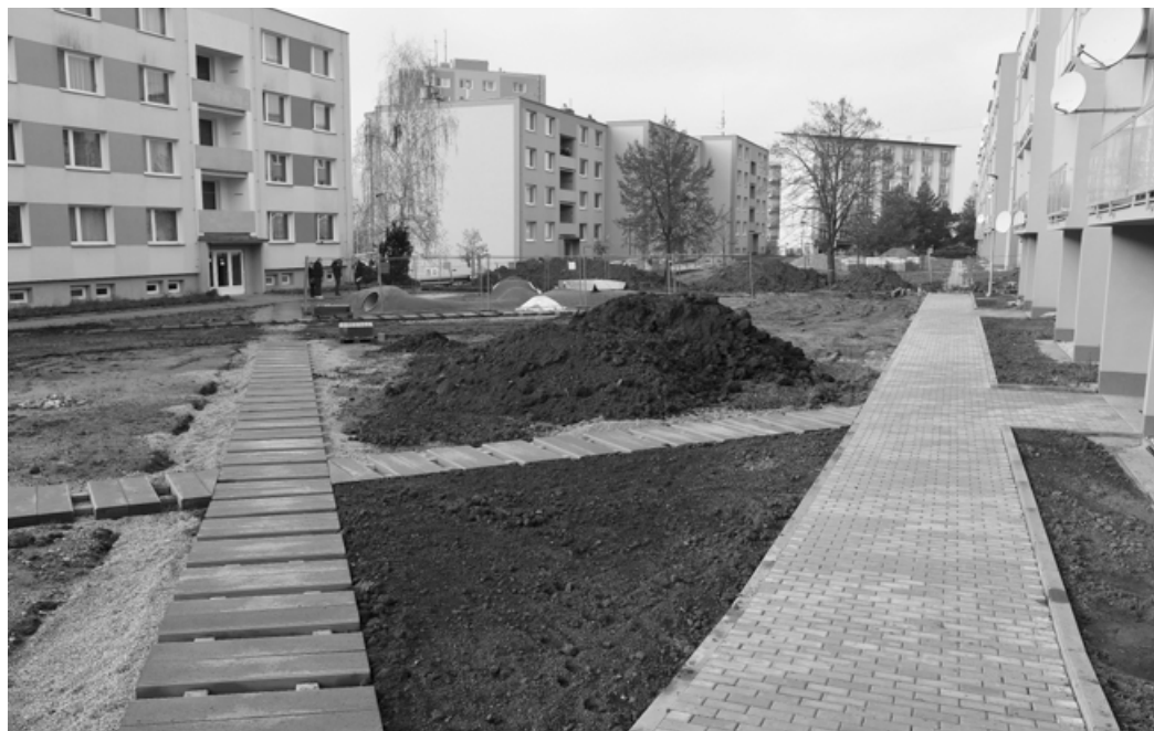
Úprav se nyní dočkají plochy mezi bytovými domy v ulici Kamnářská a Cihlářská.

Současná etapa regenerace na Zborovcích odstartovala letos v srpnu. Stavba je rozdělena na tři segmenty. Část prací stavební firma dokončí ještě letos.