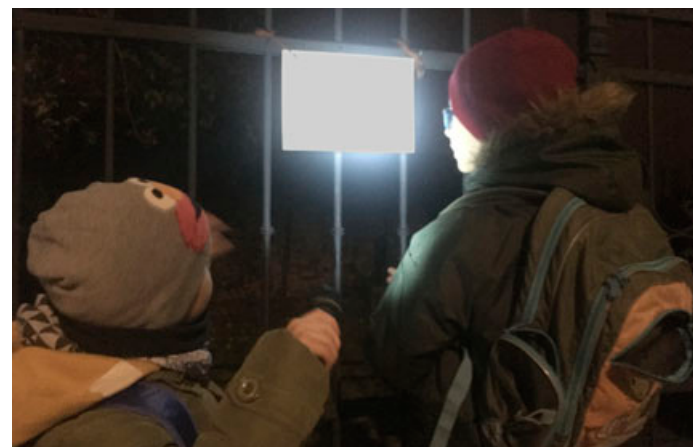
Letošní oslavy nabídky on-line tipy na aktivity, kterým se lze věnovat i během nouzového stavu. Farnost Blansko připravila i šifrovací hru, při procházce do městských parků lidé hledali karty s informacemi o sv. Martinovi a luštili tajenku.