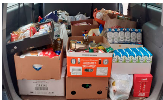
Oblastní charita Blansko vyhlásila svatomartinskou sbírku inspirovanou činy svatého Martina. V rámci akce „Rozděl se o jídlo“ lidé věnovali 10 beden a 320 kilogramů trvanlivých potravin pro potřebné.