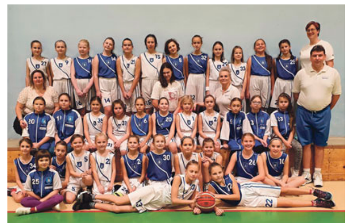
Družstvo žáků Basketbalového klubu Blansko.

„Jedná se o náhradu klasických týmových tréninků v hale nebo přírodě, při které si děvčata mohou ověřit, jak na tom jsou při provádění jednotlivých cvičení. Alespoň pomocí individuálních tréninků můžeme být s hráčkami