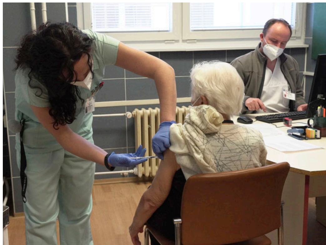
První seniory zdravotníci naočkovali v pondělí 15. února.

K očkování nechoďte, pokud máte zvýšenou tělesnou teplotu, nebo pokud máte aktuálně zhoršený zdravotní stav v důsledku jiného onemocnění, nebo vám vakcinaci v současné době nedoporučil váš praktický lékař. Očkování osob, které onemocnění covid-19 prodělaly, se doporučuje nejdříve sedm dní po ukončení izolace při asymptomatickém průběhu a nejdříve 14 dní po ukončení izolace při symptomatickém průběhu.