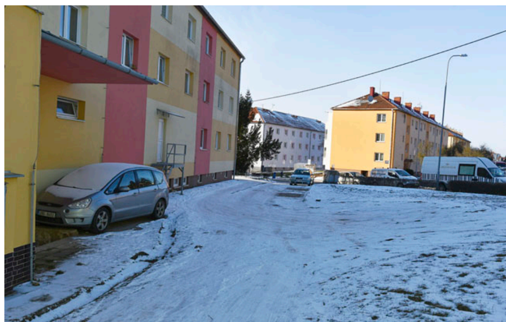
U domu č. 14 v ulici 9. května vzniknou nová parkovací stání .