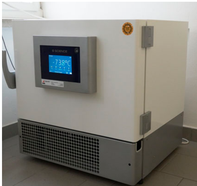
Kvůli očkování nemocnice pořídila hlubokomrazicí box na uchovávání vakcín.

> Marie Kalová, mluvčí Nemocnice Blansko