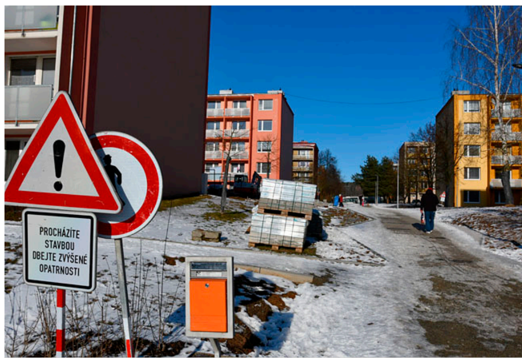
Práce se znovu rozběhnou od prvního března.

DALŠÍ ETAPA REGENERACE VEŘEJNÝCH PROSTRANSTVÍ POTRVÁ DO KONCE ČERVENCE