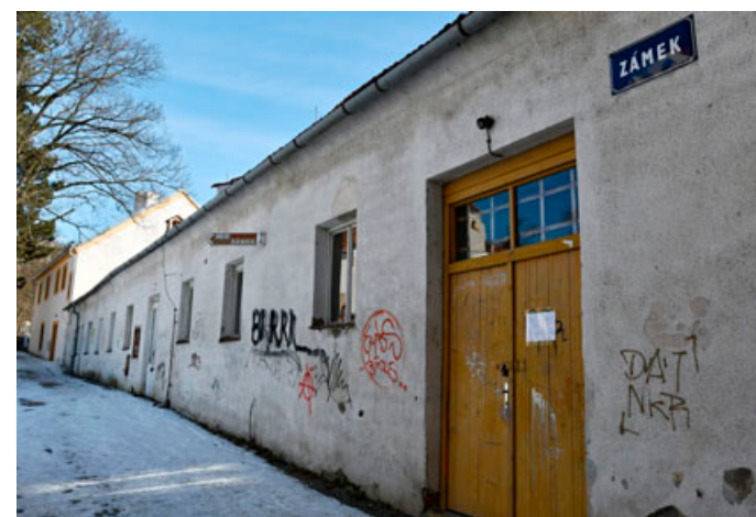
Zchátralý objekt Zámek 3 čekají opravy.

nictvím nového vnitřního schodiště propojena s částí předzámčí, kterou nyní využívá umělecká škola,“ doplnil Petr Mráček.