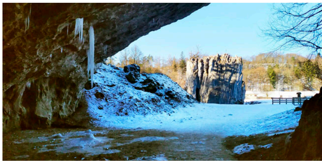
V portálu Sloupsko-šošůvských jeskyní se letos objevily ledouchy.

> Pavel Gejdoš, mluvčí Správy jeskyní ČR