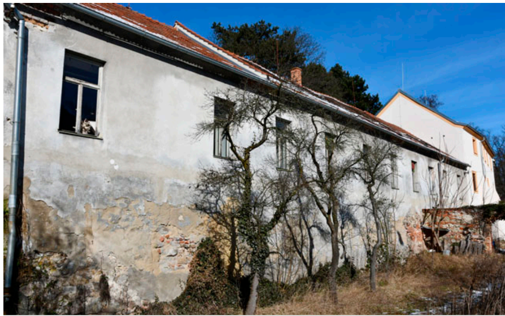
Budova dostane fasádu podobnou jako sousední objekty.

„Část objektu užívaná muzeem se propojí se sousedním objektem Zámek 2. Část objektu určená pro ZUŠ bude prostřed-