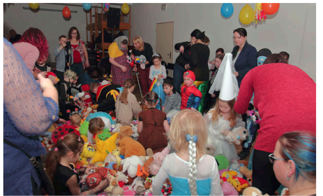
Karneval a plyšákovbraní se plánují na začátek března.