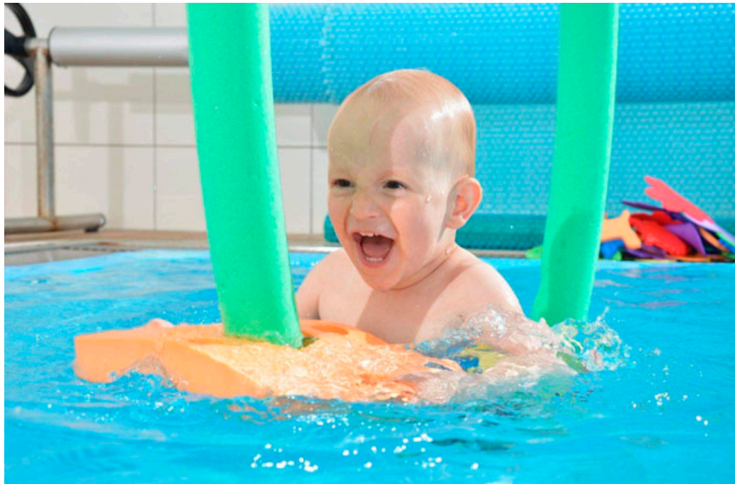
Mateřské centrum Veselý paleček nabízí kurzy plavání kojenců.

Děti ostatních věkových kategorií mají v plaveckém klubu Veselý Paleček možnost vyu-