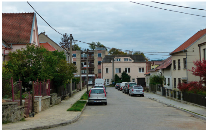
» red Jiráskova ulice v Blansku.

Celkové náklady dle projektu by neměly přesáhnout částku 0,8 mil. Kč.