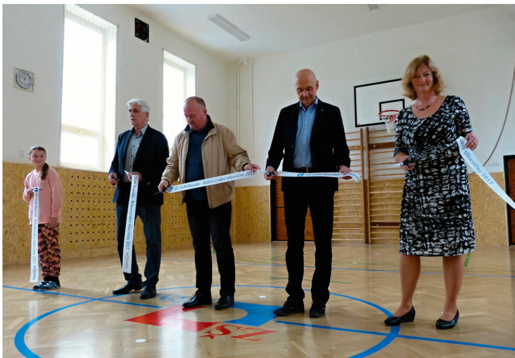
Slavnostní otevření tělocvičny na ZŠ T. G. M. v Rodkovského ulici v Blansku.