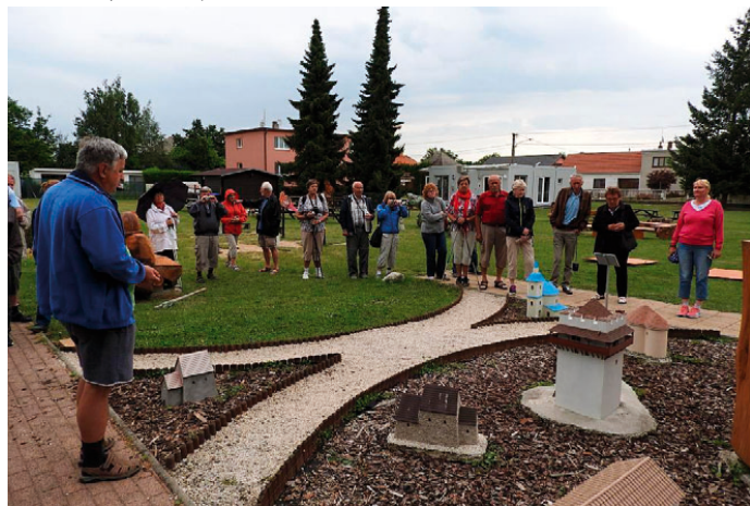
Tyto zájezdy přináší zahrádkářům nejen poučení, v rámci výletů se rádi vydávají za krásami a historií.

čianský hrad, zámek Valtice, Tvrz Orlice a hrad Sovinec.