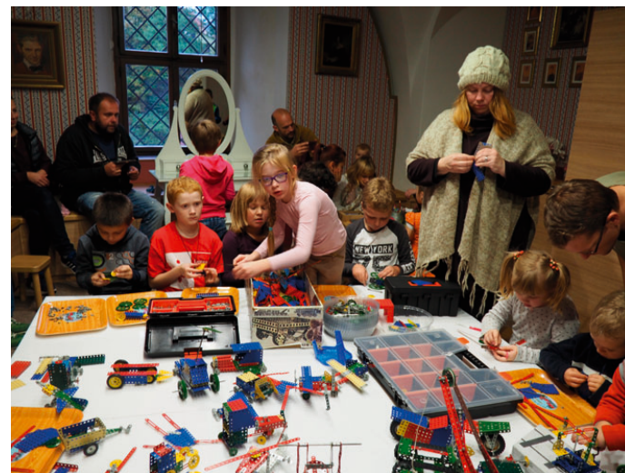
V rámci vernisáže proběhla i konstruktérská dílnička. V kulturním programu vystoupili akordeonisté Základní umělecké školy Blansko a občerstvení připravila Střední škola TEGA Blansko.