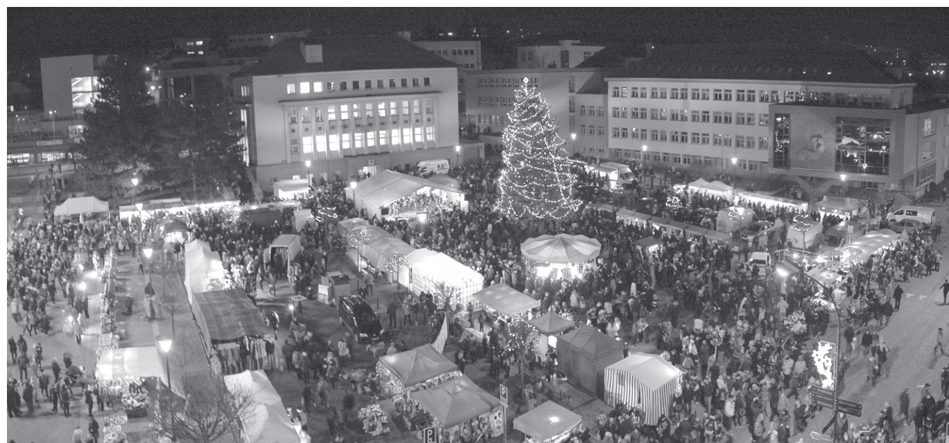
Vánoční strom na náměstí Republiky v Blansku letos společně rozsvítíme 24. listopadu v 17:00 hodin. Již od ranních hodin však náměstí zaplní stánky s vánočním zbožím. Podrobné informace o akci včetně programu, který je dosud v přípravě, sledujte na webových stránkách Kulturního střediska města Blanska nebo na www.blansko.cz .