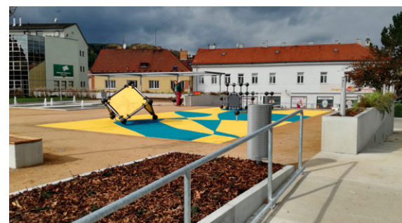
Do konce října zde ještě přibudou dva prvky – houpačka a houpadlo – určené i pro dospělé.

Oddechová zóna na základech bývalého hotelu Dukla začala 10. října s ročním zpožděním sloužit svému účelu. Prostranství je zpřístupněno veřejnosti.