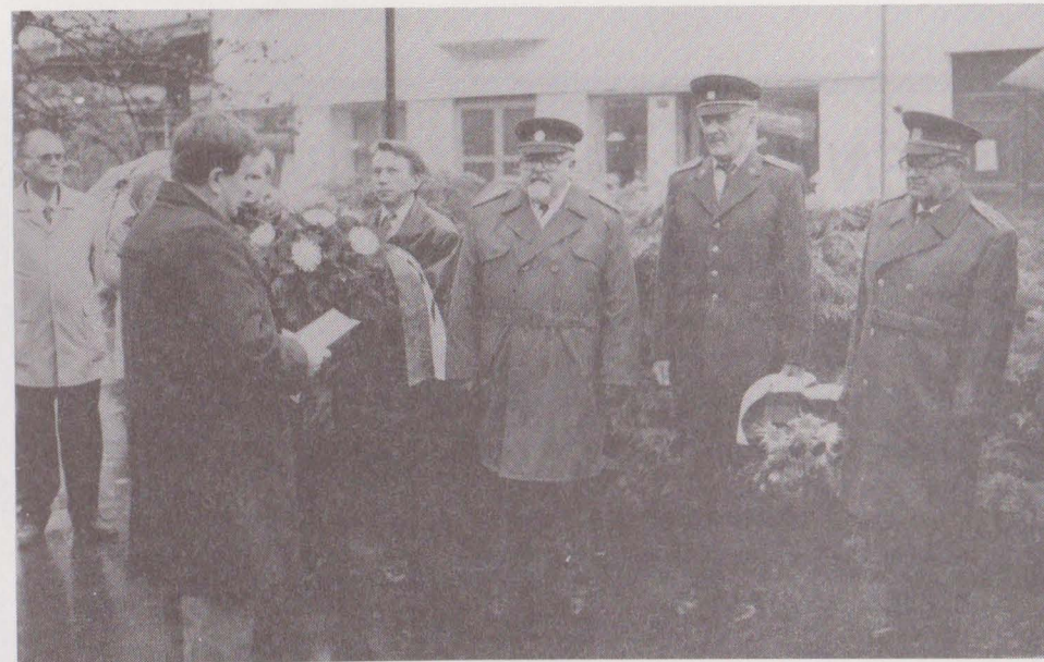
Památku 28. října 1918 uctili zástupci města, Svazu bojovníků za svobodu a Okresní vojenské správy položením kytic k památníku na nám. Svobody v Blansku.

Přijďte, rádi vás uvítáme v naší dílně PO - PÁ 7.30-11 12.30-14 hodin