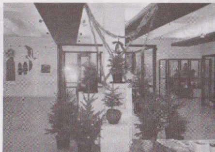
Fotografie z tradiční vánoční výstavy v Galerii města Blanska v roce 1995. Termín letošní výstavy je 12. - 29. 12.