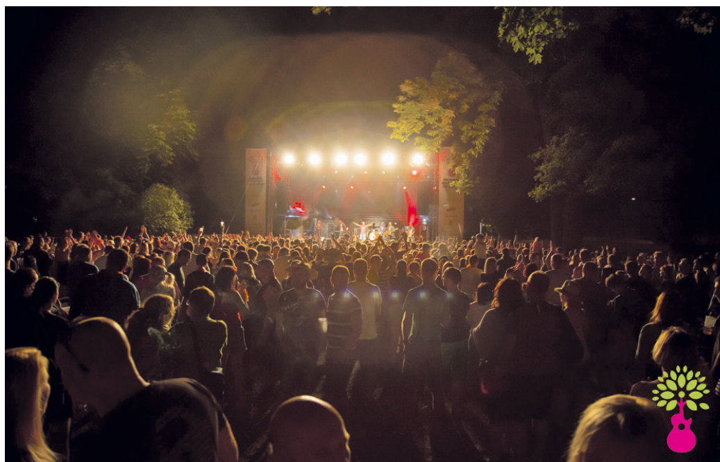
Morava Park fest vždy přinese do Blanska plno zábavy.