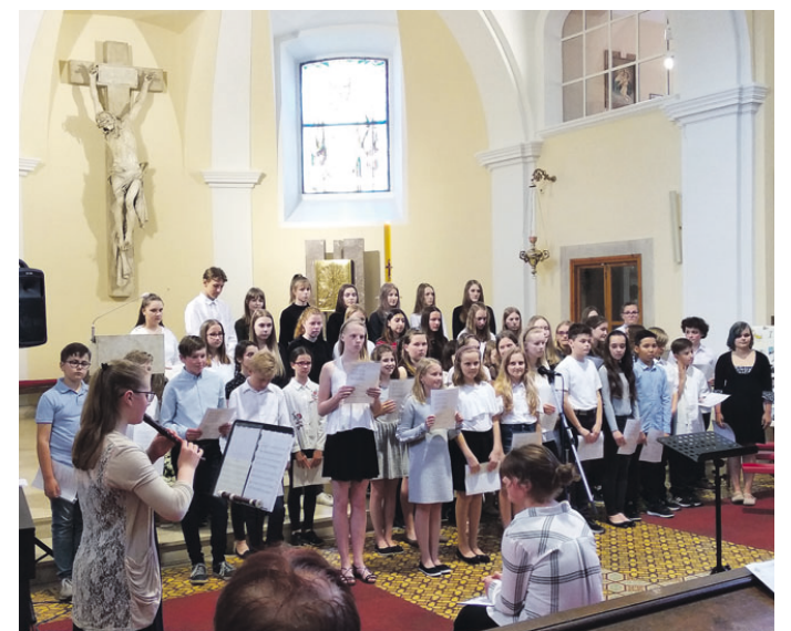
Historicky první vystoupení sboru ZŠ Salmova proběhlo v chrámu sv. Martina

V přibližně třičtvrtěhodinovém programu zazněly skladby nejen s duchovní tematikou, ale i lidové písně či americké tradice. Sborový zpěv byl střídán sólem zob-