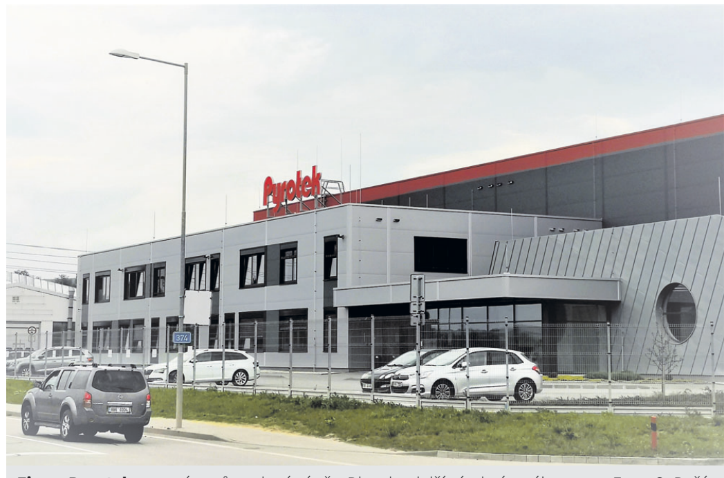
Firma Pyrotek postaví v průmyslové zóně v Blansku další výrobní areál.