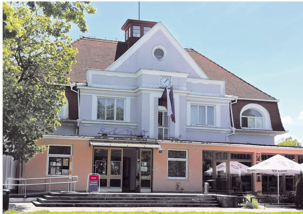
Kino v Blansku čeká tříměsíční rekonstrukce.