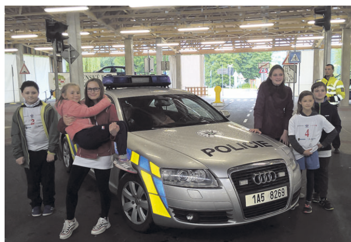
Školáci z Blanska patří mezi krajskou elitu v dopravní soutěži mladých cyklistů.

Ani v krajském kole se soutěžící neztratili. V nabitě