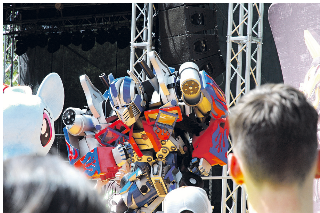
Děti hodně zaujal jeden z Transformerů.

Jak bylo řečeno, Blansko v MSFL již působilo. Bohužel pro jeho příznivce se vždy jednalo o epizodní roli ve třetí nejvyšší soutěži. „Chceme předejít pokračování na straně 3 >