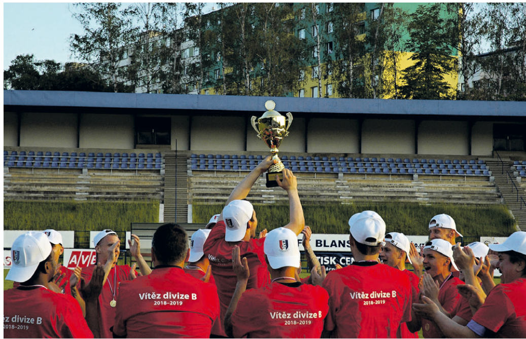
Po roce v divizi se blanenští fotbalisté vracejí do třetí nejvyšší soutěže.