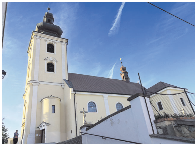
Kostel svatého Martina na Starém Blansku.

Kromě komentovaných prohlídek kostela mohli zájemci vystoupat i na věž, v programu nechyběla ani hudební vystoupení dětí a mládeže a bohoslužba pro děti s doprovodem Martini bandu. Kdo