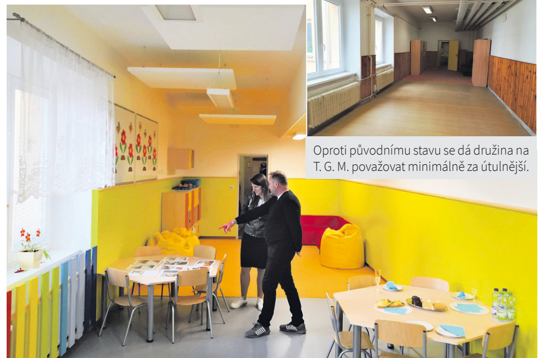
Družinu na základní škole T. G. M. rozzářily pestré barvy.