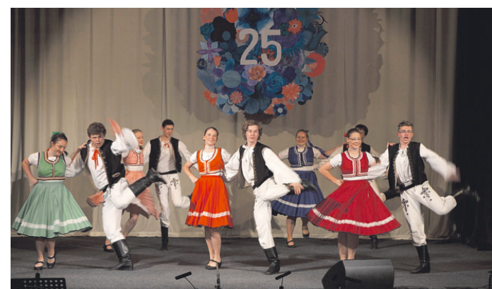
Již čtvrt století baví soukromá ZUŠ obyvatelé Blanska a při- lehlého okolí.