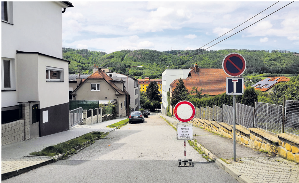
Od úterý 4. června do úterý 2. července 2019 bude Vrchlického ulice v Blansku pro auta zcela uzavřena.