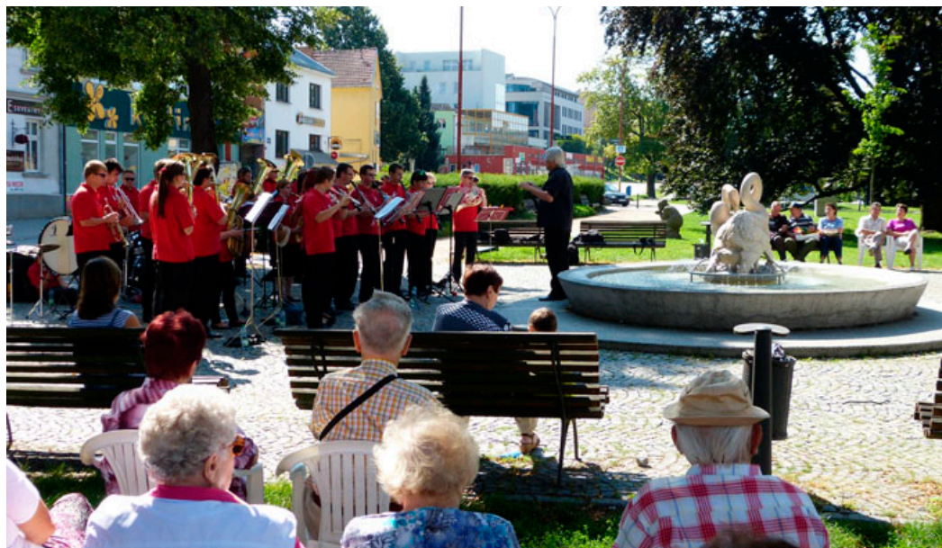
Na náměstí Svobody se v srpnu uskuteční proměnné koncerty .