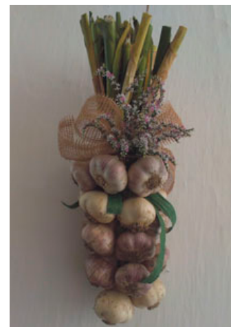
Česnek připravený na prodej.