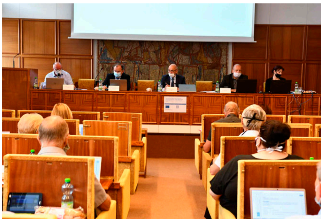
Jednání Zastupitelstva města Blanska se bude přenášet živě na internet.

Během posledního čtvrt roku se jedná o druhou změnu jednacího řádu. V březnu nejprve zastupitelé schválili online zvukový přenos z jednání a zveřejňování projednávaných materiálů ještě před jednáním zastupitelstva. Audio přenosy nyní nově nahradí audiovizuální online vysílání. Publikování projednávaných