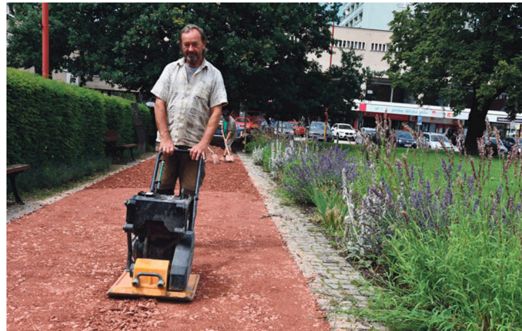
Mlatové cesty mají po osmnácti letech nový povrch .

DĚLNÍCI VYMĚNILI POVRCH MLATOVÝCH CESTIČEK NA NÁMĚSTÍ SVOBODY