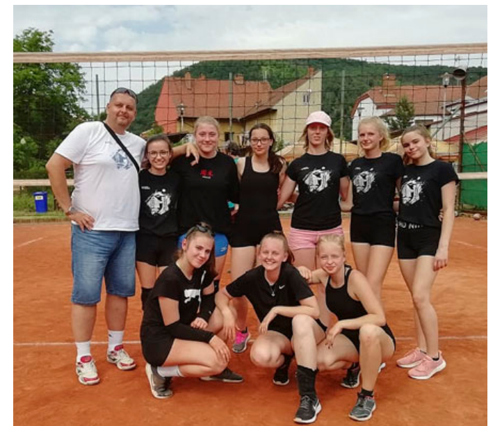
Kadetky se zúčastnily kvalitně obsazeného turnaje v Předklášteří.