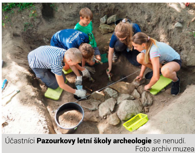
Účastníci Pazourkovy letní školy archeologie se nenudí.