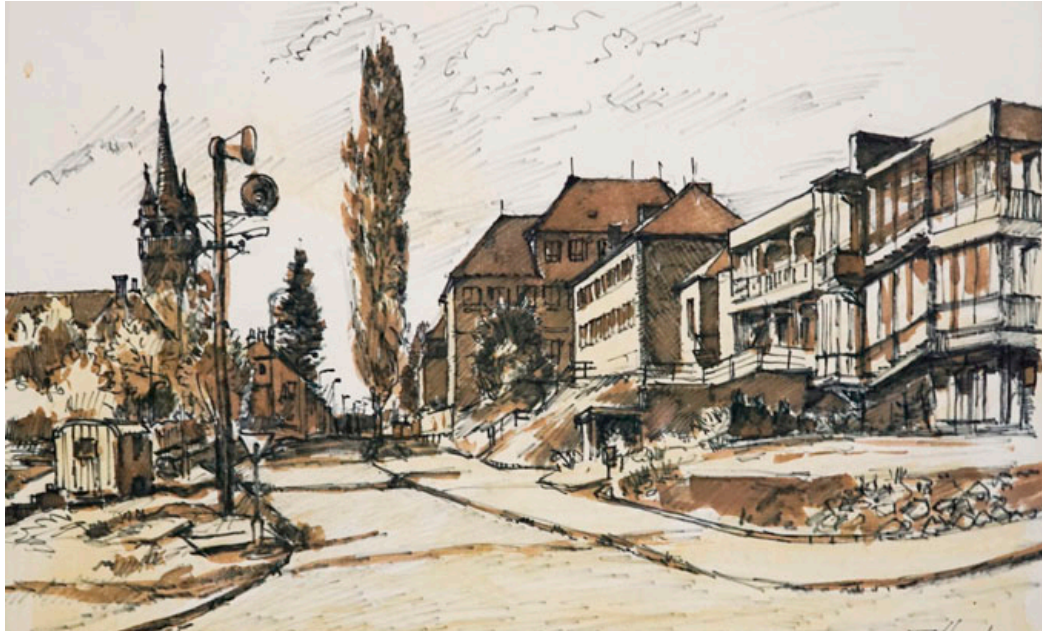
Ulice Rodkovského na obraze Zdeňka Táborského.

Blanenský malíř Zdeněk Táborský na svých obrazech před lety zachytil řadu míst ve městě. Některé z nich postupně zveřejňujeme v našem seriálu, přidáváme k nim současnou podobu a ve spolupráci se znalcem blanenských reálií Pavlem Svobodou vše doplníme také o zajímavé informace. V devátém díle přinášíme pohled na nynější Rodkovského ulici. Za spolupráci děkujeme i dědicům Zdeňka Táborského a Galerii města Blanska.