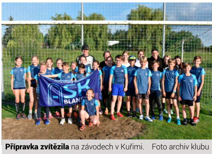
Přípravka zvítězila na závodech v Kuřimi.