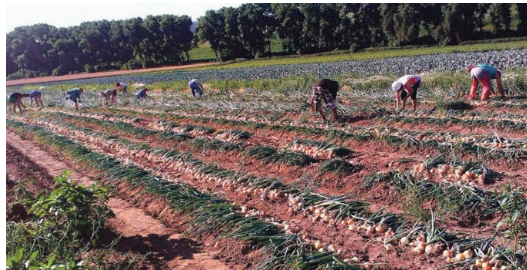
Začátkem července se začne na farmě sklízet česnek.

MĚSTO BLANSKO VYHLAŠUJE VÝBĚROVÉ ŘÍZENÍ NA FUNKCI: