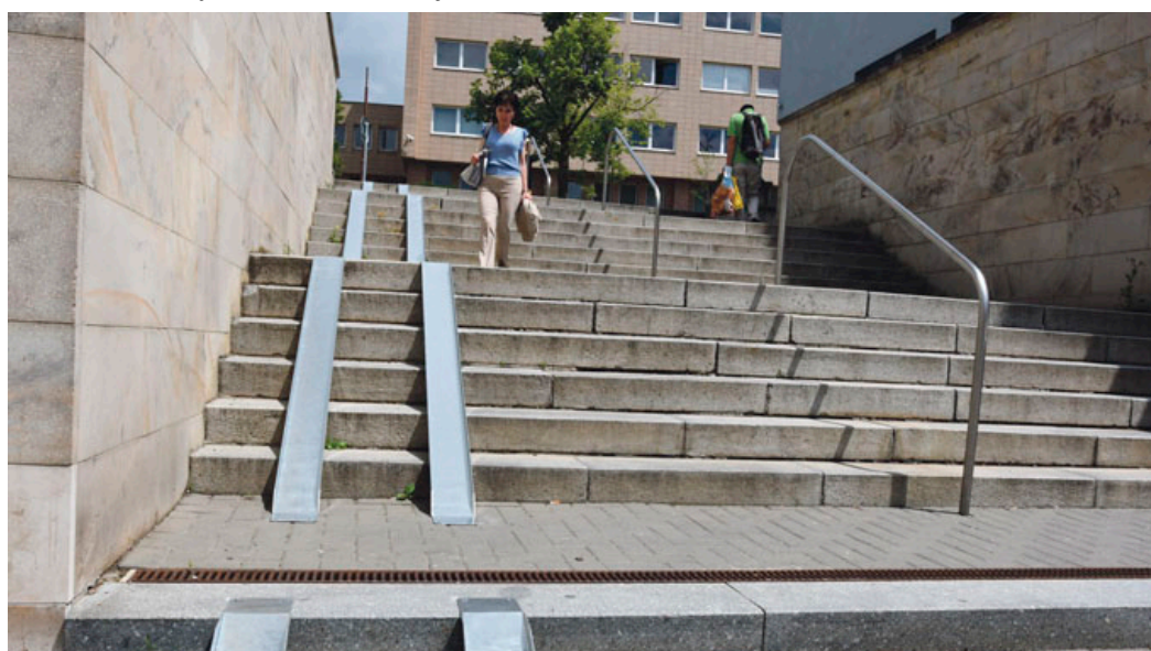
Na schodiště řemeslníci upevnili kovové nájezdy pro kočárky .