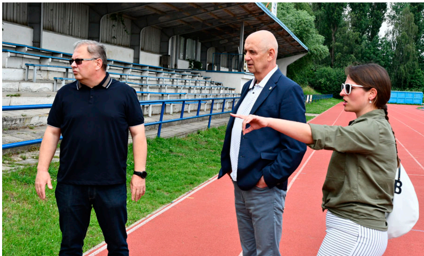
Tribunu čeká obnova. Rozpadající se lavičky nahradí plastové sedačky, nová bude střecha i schodiště na tribuně.

Stadion získá nové dvoumetrové oplocení včetně podhrabových desek, bude mít celkem tři vjezdové brány a tři vchodové branky, kromě stávajícího hlavního vstupu vzniknou další také v jihozápadním a severozápadním rohu stadionu. „Na tribunu se osadí přes pět set nových