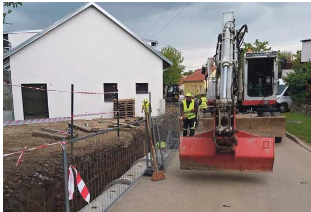
Kanalizaci bylo nutné zrekonstruovat také v Horní Lhotě.

„Potvrzuje se, že opravy vodovodního řádu a kanalizace jsou s ohledem na jejich stáří a stav opravu prováděny za pět minut dvanáct. Vše je na hranici životnosti. Mnozí tak rozsáhlou rekonstrukci cent-