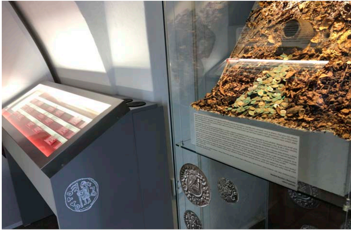
Část mincí uvidí návštěvníci v expozici Muzea Blanenska.

Podobně rozsáhlý soubor moravských ražeb mincí z přelomu 11. a 12. století u nás nemá období. Objevili ho mladí manželé při procházce v přírodě. „Přemýšlíme, s jakými skutky bylo nabytí tak velkého jmění spojeno. Zda to byly úspory nabyté poctivým člověkem, nebo byly spojené se zlem a strádáním ostatních? Ať je to jakkoli, cítíme se být s původním majitelem pokladu svým způsobem osudově spojeni, protože jsme po devíti letech jeho velký majetek vrátili zpět na světlo světa. Naším přáním je, aby byl poklad vystaven v Muzeu Blanenska, protože máme silný vztah k Blanensku a jeho historii. Proto budeme rádi, když zůstane trvalou připomínkou zmíněných časů,“ uvedli mladí manželé, kteří si za poctivě