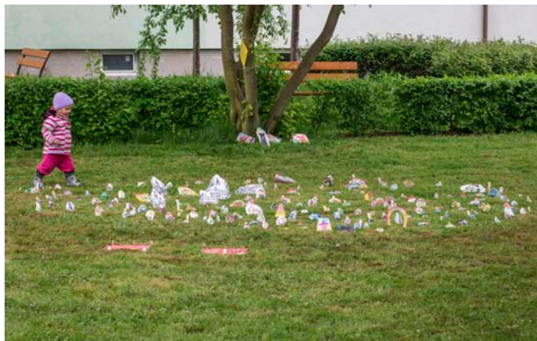
U Domu s pečovatelskou službou na ulici 9. května vznikl Kamínkov.

Inspiraci pro kresby tuší a perem na břidlici čerpala absolventka Střední uměleckoprůmyslové školy v Brně v nejrůznějších brožurách, které vydává město, infor-