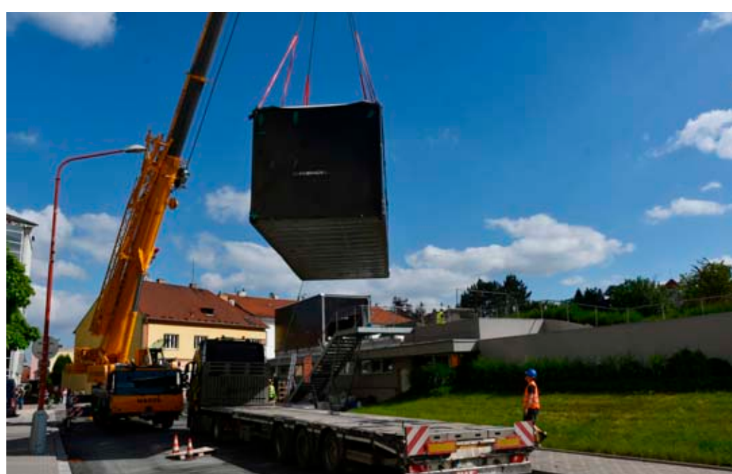
Kavárnu na Poduklí usadil jeřáb.

Kavárna, která nabídne také posezení na přilehlé terase, by podle ní měla zahájit provoz o letních prázdninách, byť o něco později, než se původ-