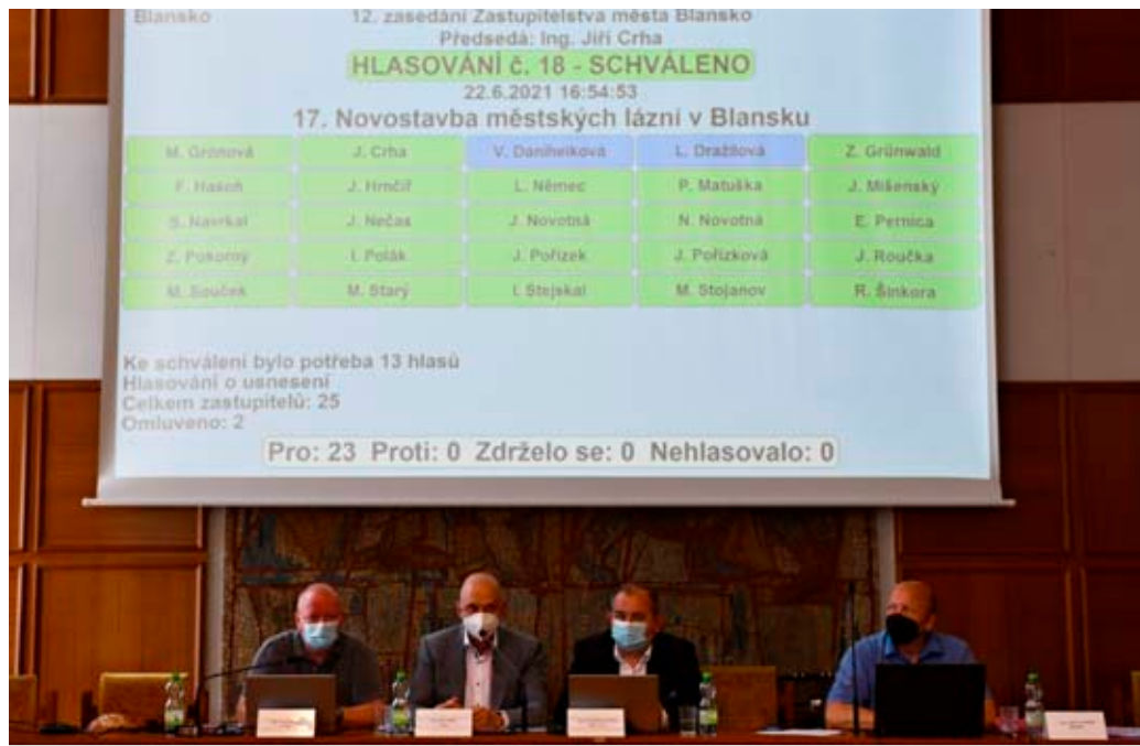
Studii nových lázní podpořili všichni přítomní zastupitelé.

Jsem rád, že zastupitelstvo jednohlasně podpořilo také udělení tří individuálních dotací . Projekt Podpora výkonostního hokeje Dynamiters Blansko HK získá 200 tisíc korun, Hnutí humanitární pomoci obdrží dotaci 150 tisíc korun na opravu střechy denišního stacionáře Domova Olga v ulici Leoše Janáčka a Hasičský záchranný sbor Jihomoravského kraje dostane částku 200 tisíc korun na vybudování lezecké stěny v areálu stanice Blansko. > Jiří Crha