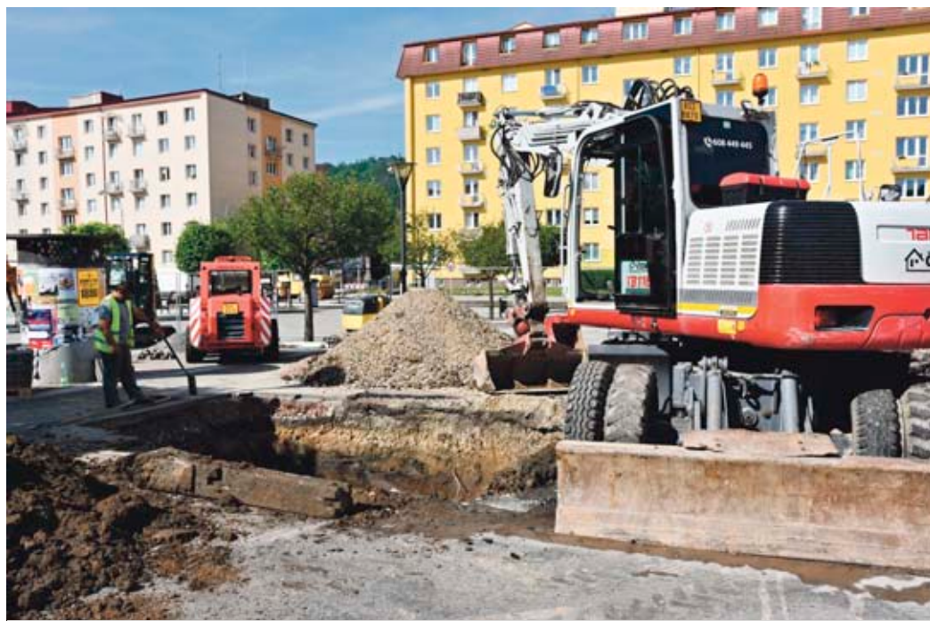
Na náměstí Republiky se opravovala zborcená dešťová kanalizace.