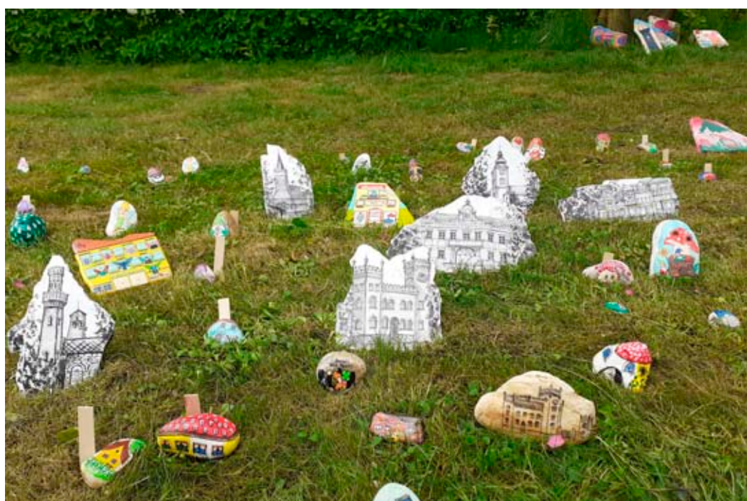
Malované kamínky s motivy města.