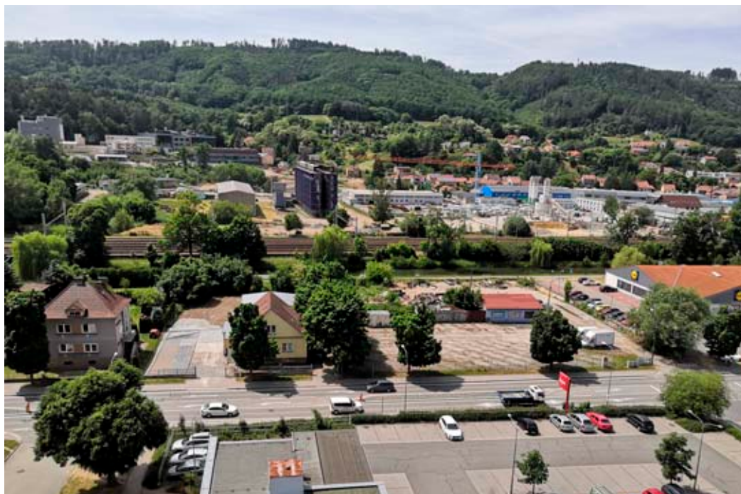
Nový most bude začínat v bývalém areálu uhelných skladů ve Svitavské ulici.

Stavba kruhového objezdu na průtahu Blanskem bude koordinována také s výstavbou rondelu na křižení ulic Mlýn-