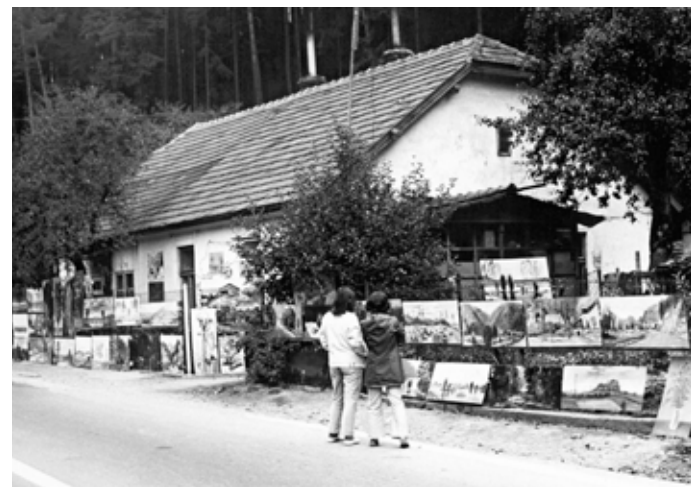
Historická podoba Galerie na plotě.