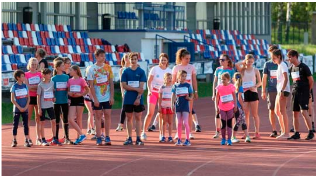
Do projektu se zapojili i členové Atletického klubu Ludvíka Daňka.

„Je dobře, že už covidová situace dovolila rozvolnění a že Sportovní ostrov Ludvíka Daňka může opět sloužit právě sportovcům. Na účasti na tak narychlo uspořádané akci je vidět, že sportovní kroužky a volný pohyb už všem chyběly,“ zhodnotil starosta Jiří Crha. > pak