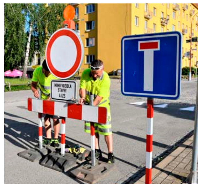
Ještě před spuštěním provozu bylo nutné odstranit zákazové značky.

lých devět milionů korun. Práce na opravě povrchů vozovek a neplánovaná oprava zborcené dešťové kanalizace přišly také zhruba na devět milionů korun.