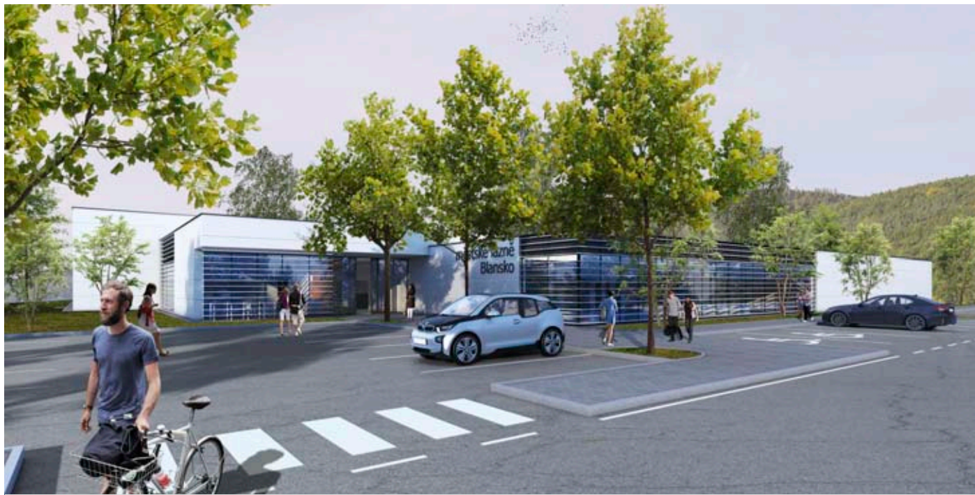
Studie nových krytých lázní v Blansku.

„Děkuji městu i architektonické kanceláři za přizvání k projektu, a že se podařilo zapracovat většinu našich připomínek už ve fázi příprav, to nebývá běžné. Stav plaveckých bazénů v České republice je žalostný, nemají dostatečnou kapacitu ani potřebné parametry. Blanský bazén může být velice dobrým příkladem pro celou republiku, pokud se vše podaří realizovat tak, jak pokračování na straně 8 >