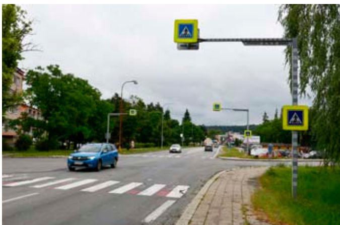
Na křižovatce Poříčí-Mlýnská začne stavba okružní křižovatky.

„Opravy se dočká úsek od hranice autobusové zastávky u Městského klubu důchodců a po křižovatku pod ZŠ a MŠ Dvorská. Původně jsme plánovali možnost větší opravy včetně úprav vjezdu do zámeckého parku, řešení zeleně i chodníků. Ukázalo se ale, že v horizontu pěti až osmi let zde bude třeba provést kompletní rekonstrukci sítí. Proto jsme zvolili pouze