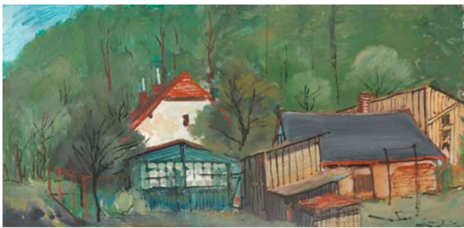
Galerie na plotě, jak ji zachytil malíř Zdeněk Táborský.