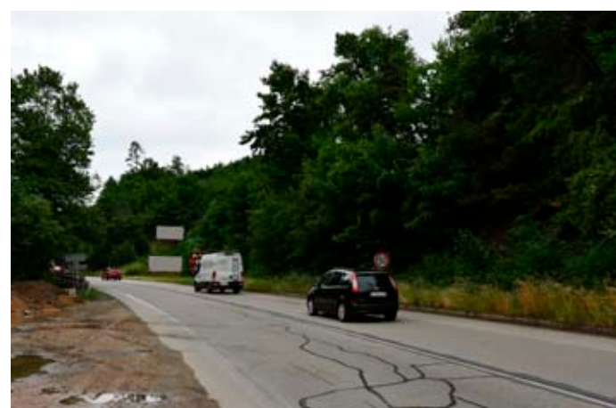
Současná podoba místa.