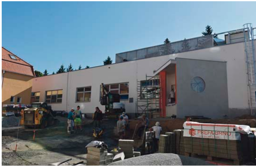
V areálu školy již stojí nový objekt stravovacího provozu.