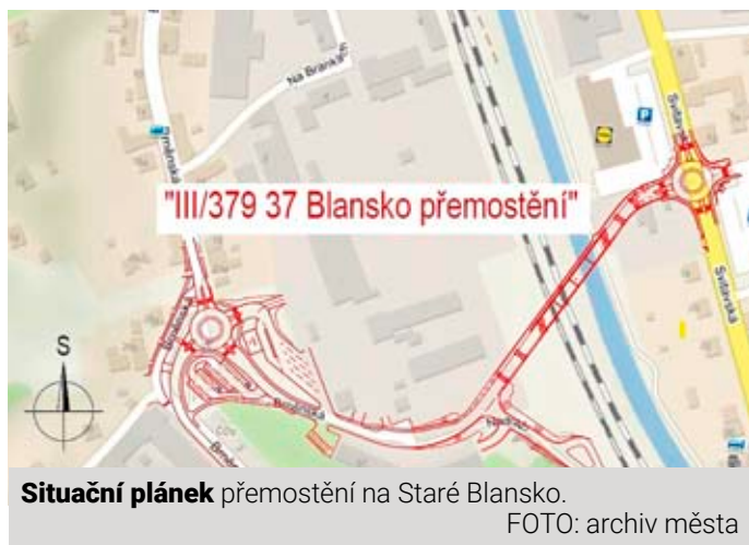
Situací plán přemostění na Staré Blansko.