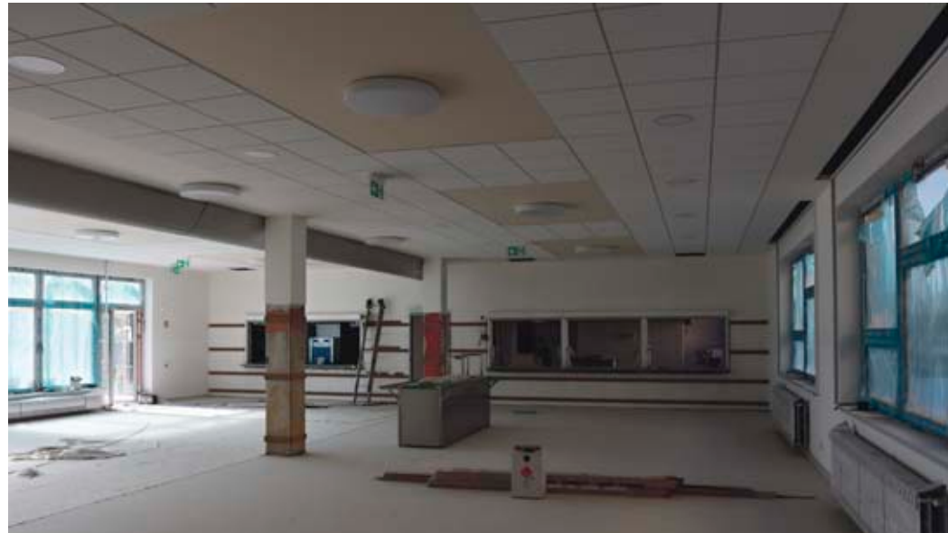
Novou jídelnu a kuchyň zbývá ještě vybavit nábytkem a zařízením.

Kolaudace stavby je naplánována na úterý 29. června. Zkušební provoz nového