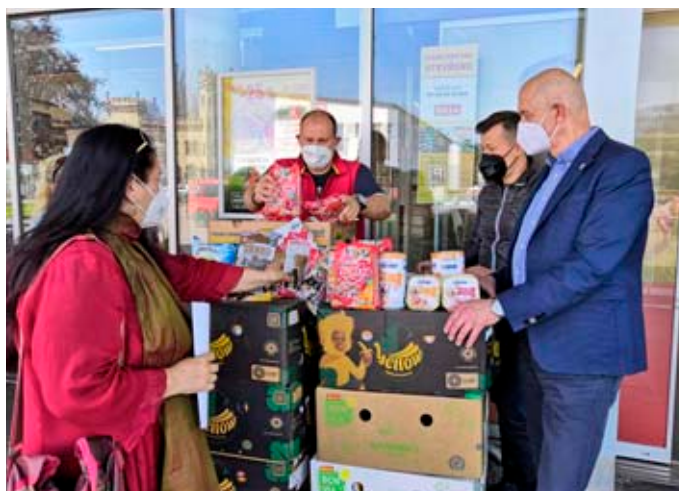
Zákazníci supermarketu Billa věnovali útulku krmivo pro psy.