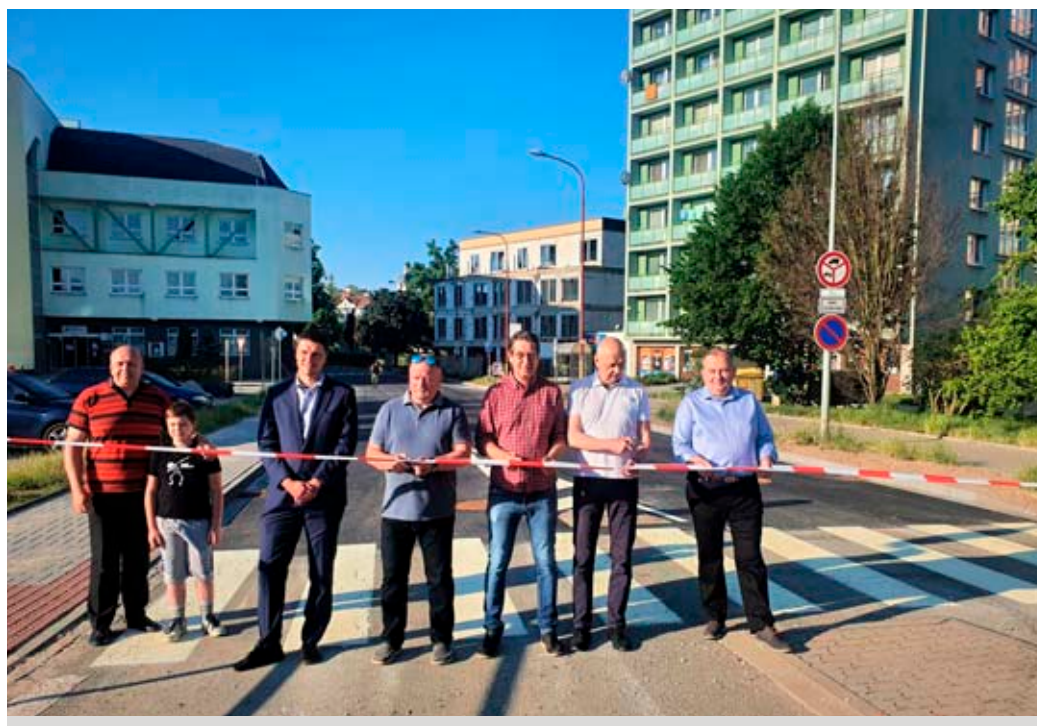
Průjezd centrem města symbolicky otevřeli zástupci vedení města, Svazku vodovodů a kanalizace i zhotovitele.

Rekonstrukce vodovodu a kanalizace přišla na nece-