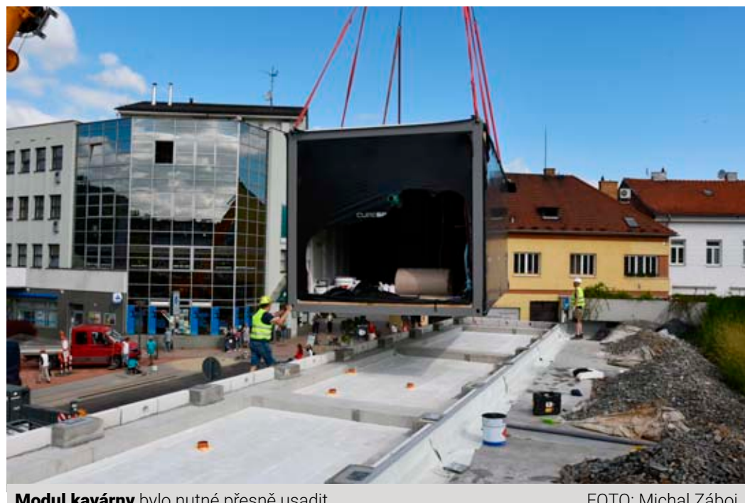
Modul kavárny bylo nutné přesně usadit.