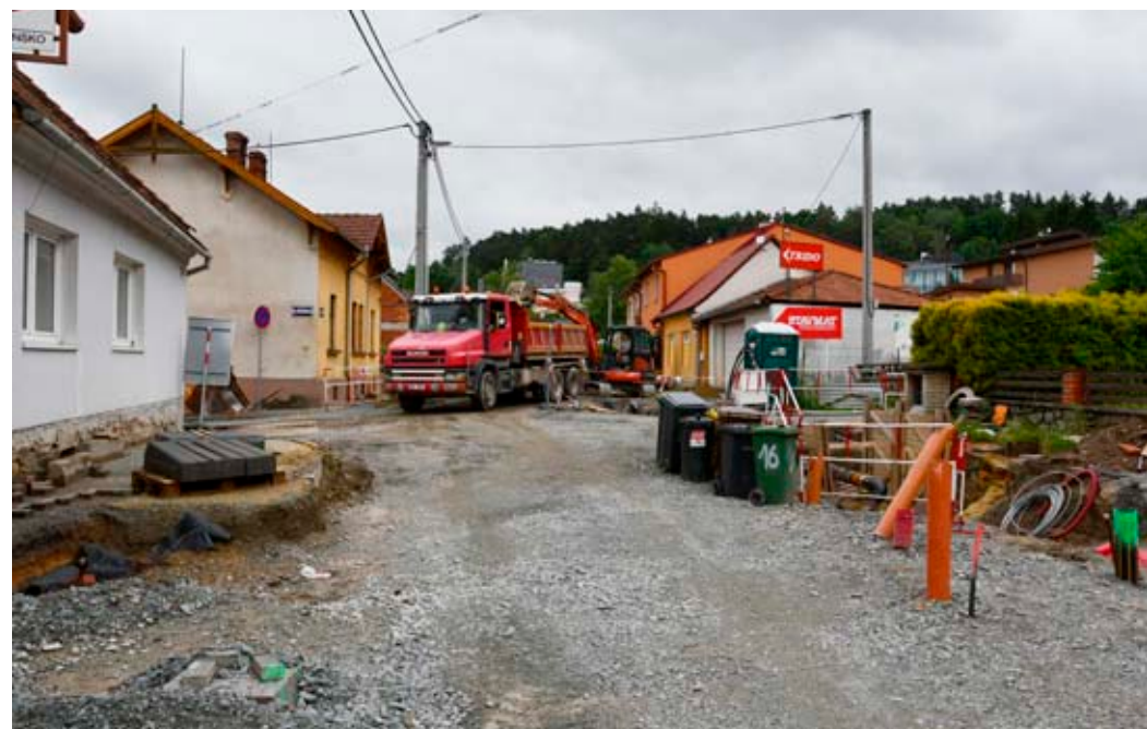
Na Starém Blansku bude pokračovat oprava Brněnské ulice.

opravu povrchu vozovky. Výměna horní obrusné vrstvy by měla přijít zhruba na 1,9 milionu korun včetně DPH,“ popsal starosta Blanska Jiří Crha.