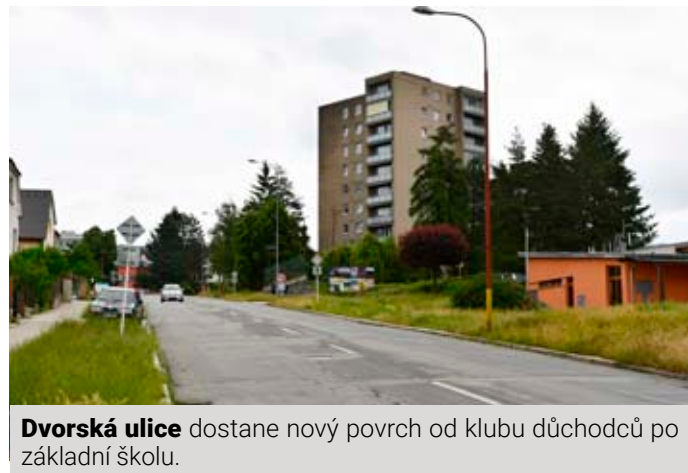
Dvorská ulice dostane nový povrch od klubu důchodců po základní školu.

Částečné rozvolnění přijde od 21. července, kdy začne 4. etapa rekonstrukce. Řidiči budou moci projet opravovaným úsekem opět přes ulici Na Brankách. Doprava bude řízena kyvadlově pomocí semaforů. Úsekem budou moci projet znovu také spoje MHD. Hotovo by mělo být do listopadu letošního roku. > pak