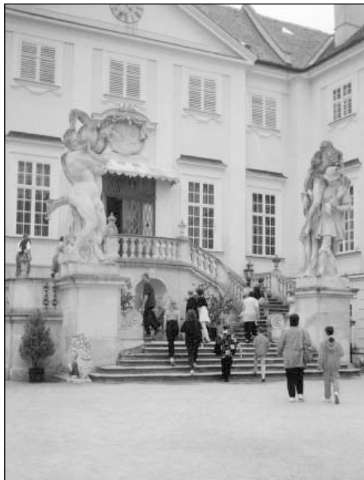
U vchodu do zámku Vranov nad Dyjí.

Z bezchybných odpovědí bylo vybráno 8 vítězů, kteří obdrželi volnou jízdenku pro dvě osoby na vlastivědný výlet do Slupi, Vranova nad Dyjí,