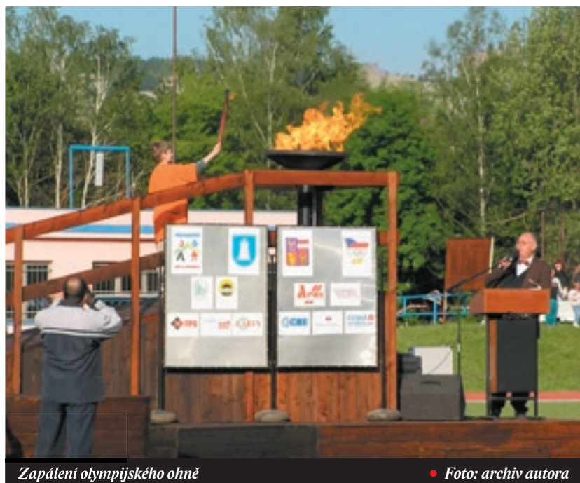
Zapálení olympijského ohně