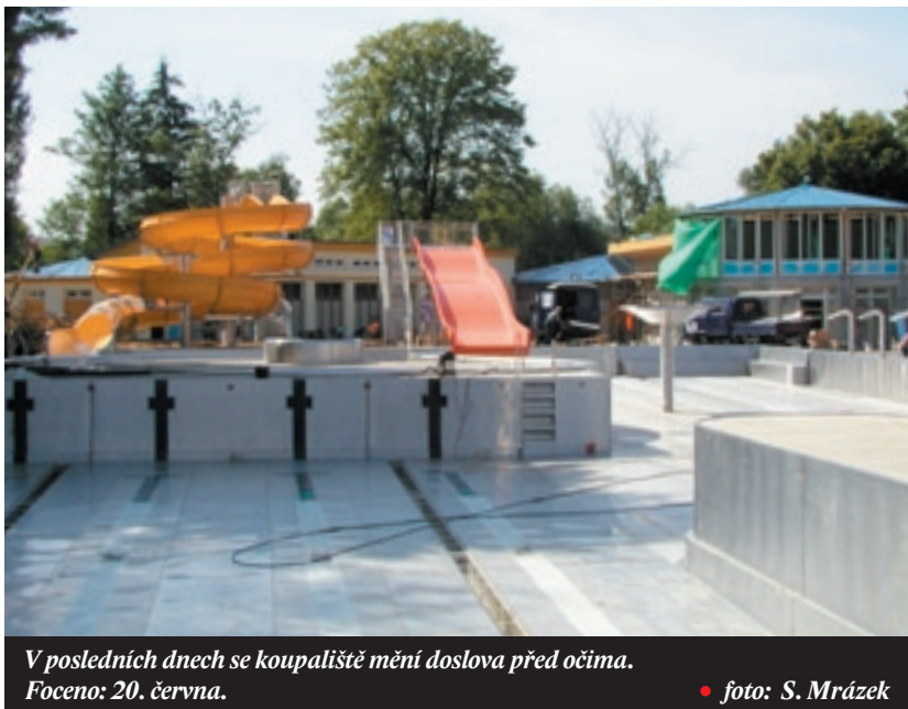
V posledních dnech se koupaliště mění doslova před očima. Foteno: 20. června.

Snad k tomuto pohodovému prožití prázdninových měsíců přispěje i nově zrekonstruované koupaliště, jehož otevření je naplánováno o druhém červencovém víkendu.