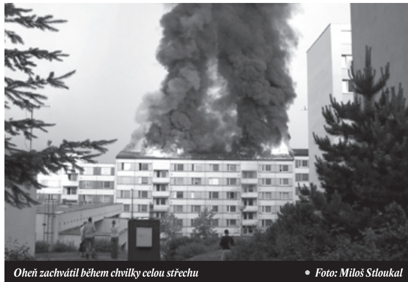
Oheň zachvátil během chvíle celou střechu