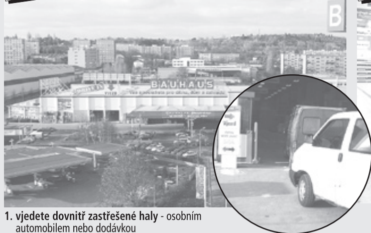
1. vjedete dovnitř zastřešené haly - osobním automobilem nebo dodávkou