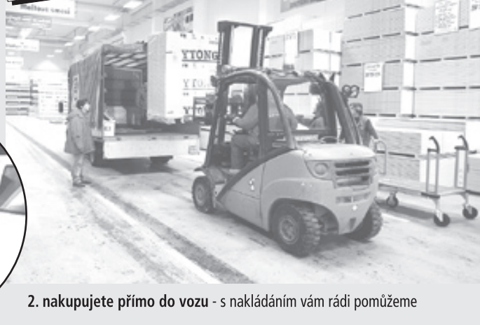
2. nakupujete přímo do vozu - s nakládáním vám rádi pomůžeme