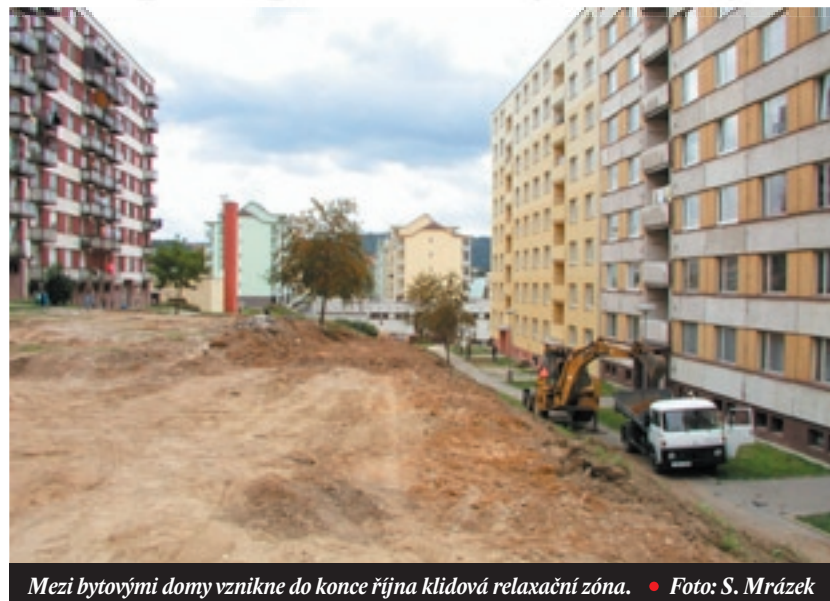
Mezi bytovými domy vznikne do konce října klidová relaxační zóna.

V pondělí 28. 8. 2006 byla zahájena realizace stavby Regenerace sídliště Písečná v Blansku – I. etapa. Práce jsou zahájeny demolicí povrchů asfaltů, betonových desek. Tyto jsou dočasně ukládány na volnou plochu vedle penzionu, nepozdějí do doby ukončení realizace této etapy a ta dle smlouvy činí 20. 10. 2006. Je nutné připomenout, že v tomto „nitrobloku“ nevznikne dětské hřiště, ale klidová relaxační zóna parkového typu s lavičkami, stromy, labyrintem.