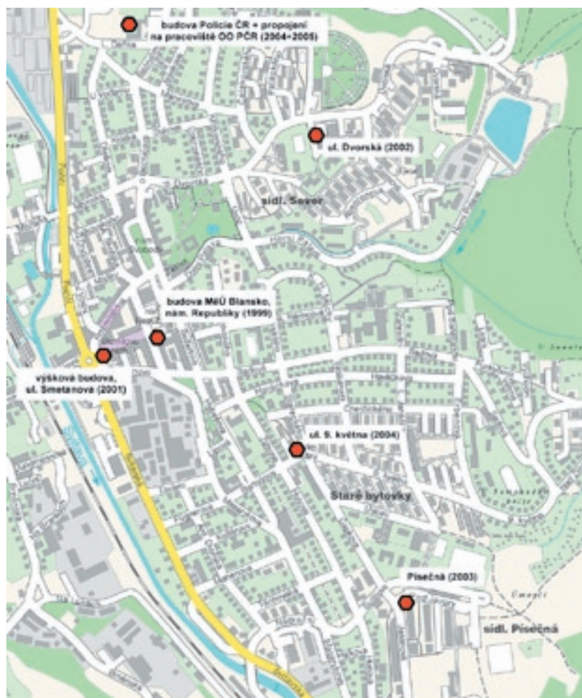
Přehled kamerových dohlížecích bodů v Blansku k 1. 1. 2006.

V roce 2005, kdy bylo město zařazeno do programu Partnerství MV ČR, byly získány dotace na propojení MKDS mezi budovami MP a OR PCR. Určené pracoviště PCR takto získalo plnohodnotný vstup do MKDS a je jim umožněno sledovat obraz vybraných kamer na svém monitoru a aktivně vstupovat do jejich ovládní pomocí inteligentní klávesnice. Priorita ovládní však byla plně ponechána na straně MP. Důvodem pro propojení mezi policií byl předpoklad, že takto bude MKDS využíván na kvalitativně vyšší úrovni.