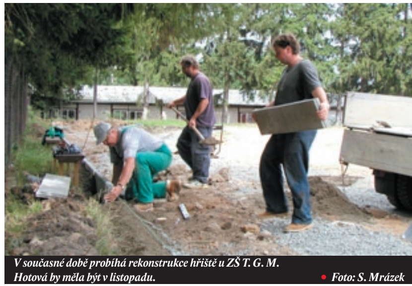
V současné době probíhá rekonstrukce hřiště u ZŠ T. G. M. Hotová by měla být v listopadu.

• odbor školství, kultury, mládeže a tělovýchovy