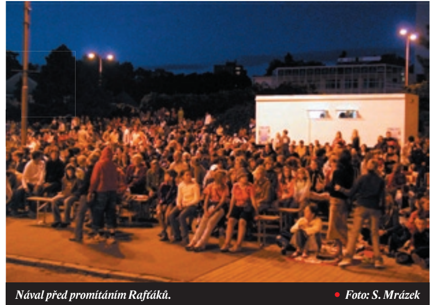
Nával před promítáním Raftáků.