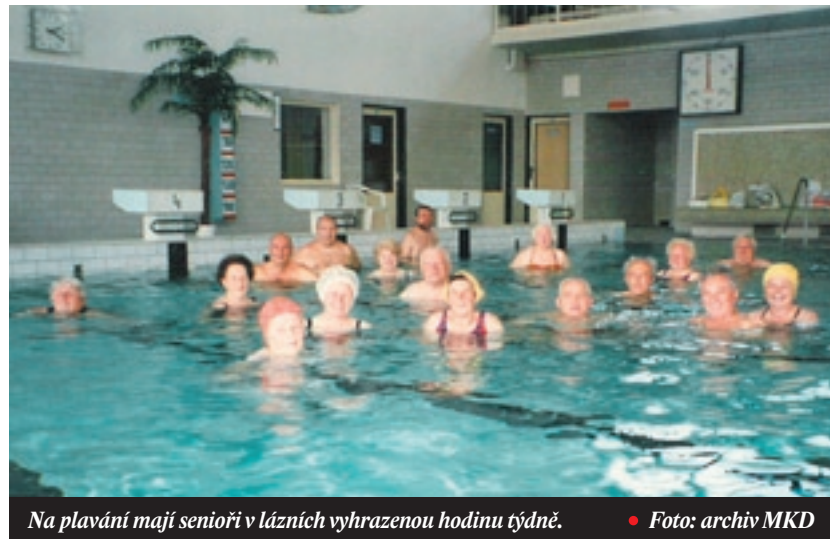
Na plavání mají senioři v lázních vyhrazenou hodinu týdně.

Proto si samospráva MKD váží všech, kteří v kroužcích a souborech klubu pracují, připravují programy, ruční výrobky, cvičí písně a hudební vystoupení. Jen s dobrým, aktivním zázemím dosahujeme v klubu stále dobrých výsledků a získáváme vděčné publikum. Ať je tomu tak i nadále! • MKD