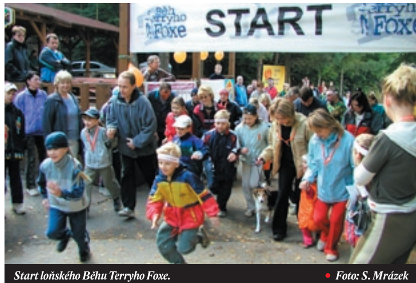
Start loňského Běhu Terryho Foxe.