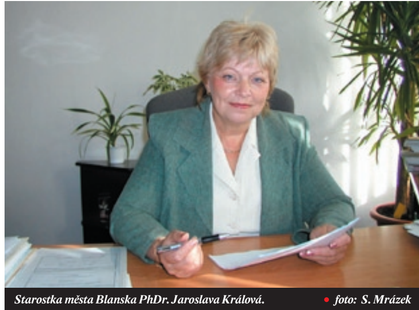
Starostka města Blanska PhDr. Jaroslava Králová.