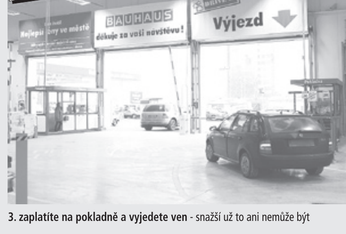
3. zaplatíte na pokladně a vyjedete ven - snažíš už to ani nemůže být