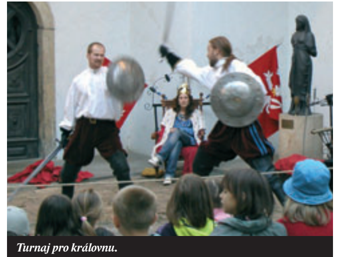
Turnaj pro královnu.