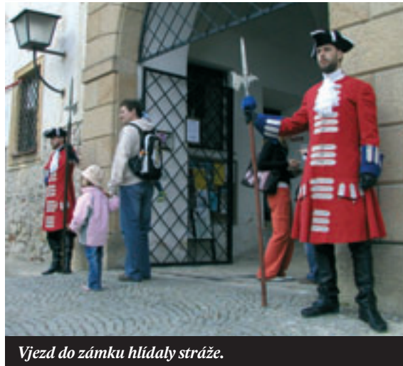
Vjezd do zámku hlídaly stráže.