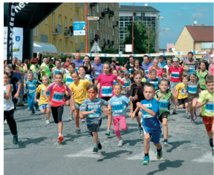
Krátke po startu lidového běhu Půlmaratonu MK 2014.