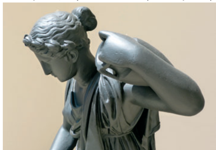
Socha Dívka s vázou na nádvoří blanenského zámku.