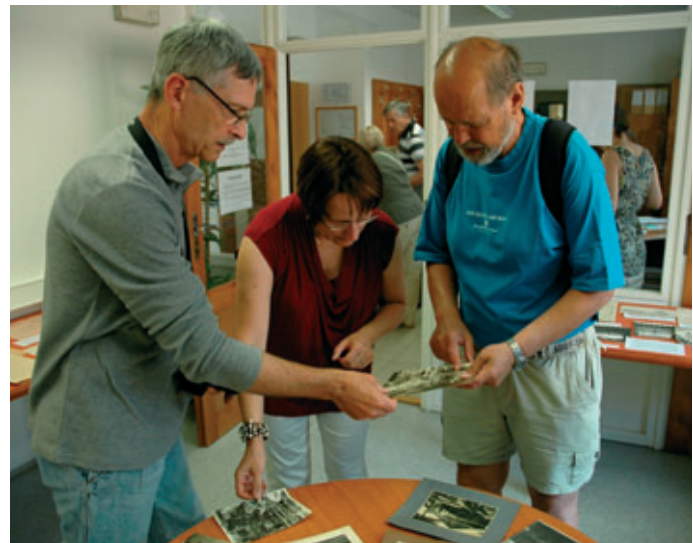
Součástí akce byl také koutek s fotografiemi neznámých lokalit, u kterých se mohli návštěvníci – pamětníci zastavit a pokusit se pomoci tato neznámá místa určit.

„Letos jsme záměrně zvolili, dle mého názoru, atraktivní téma výstavy, které snad osloví co nejširší okruh blanenských občanů, a proto doufám, že se tak naše instituce dostane do širokého povědomí veřejnosti,“ věří Kovářová. • red