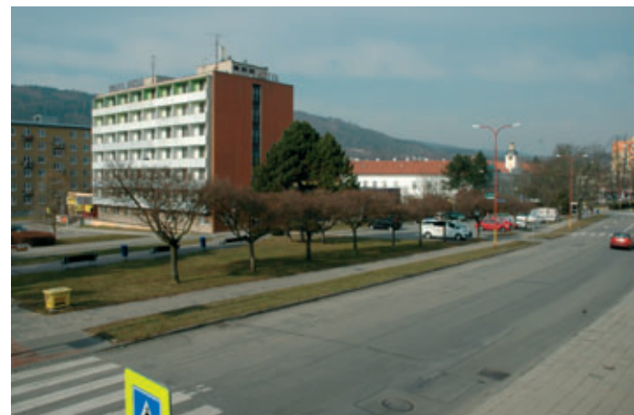
Příjezd na horní parkoviště k hotelu Dukla bude směrem od nám. Svobody částečně omezen.