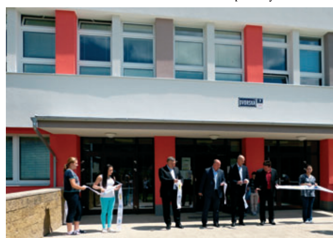
Zbrusu nová budova ZŠ Dvorské byla předána do užívání ještě před koncem školního roku.