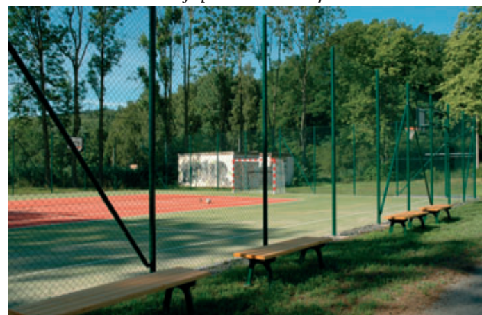
Nové hřiště je již přístupné veřejnosti.