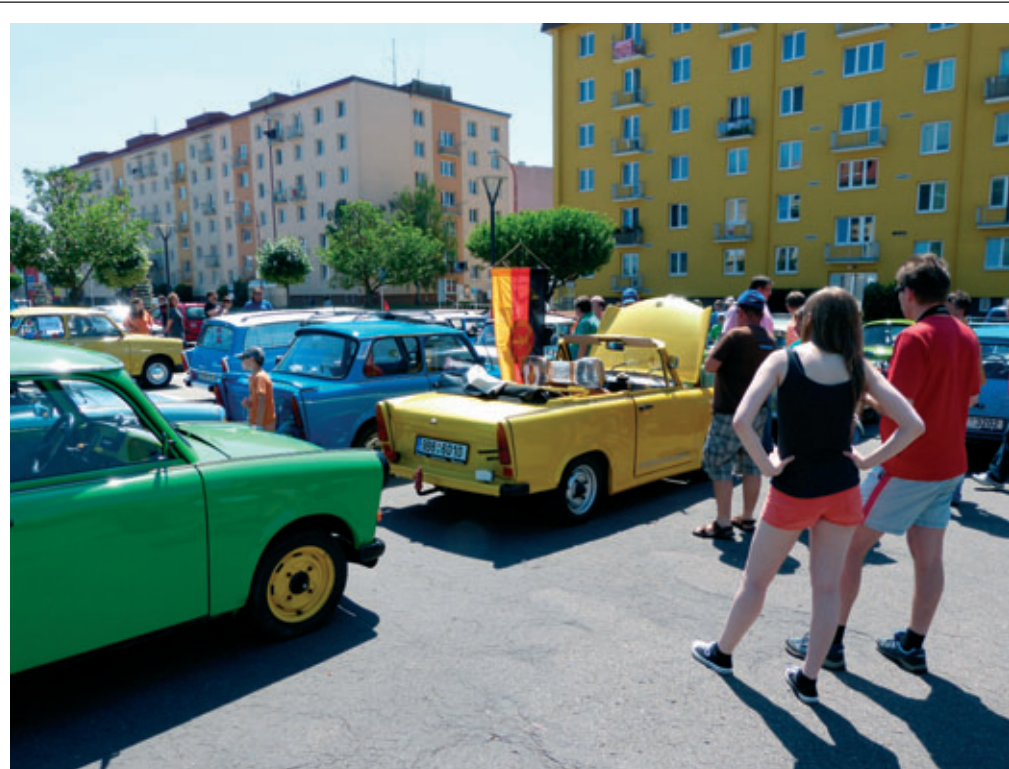
Legendární vozy Trabant neztrácí své kouzlo. Trabant klub Blansko uspořádalo 6. června v pořadí již sedmý sraz vozidel legendární tovární značky Trabant. Necelou třicítku těchto krásných strojů bylo možno zhlédnout na nám. Republiky. Výjimkou nebyl ani přívěs v lůžkové či nákladní úpravě. Po představení jednotlivých vozů následovala spanilá jízda městem a společné focení u Zámku Rájec nad Svitavou.