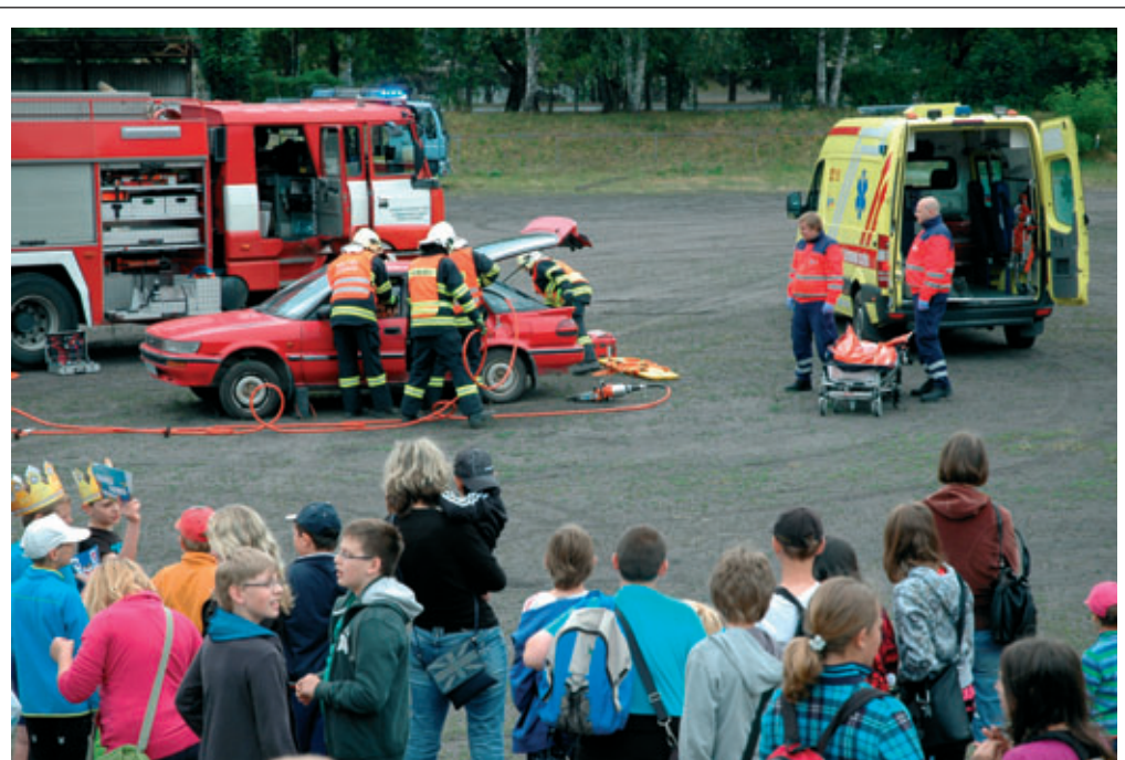
Již tradiční seznámení s jednotlivými složkami integrovaného záchranného systému připravila především pro děti ze základních škol Police ČR . Areál hřiště ASK Blansko tak na celé dopoledne obsadili hasiči, policisté státní i městští, celní správa, hasiči či záchranáři. Dětem předvedli atraktivní ukázky zásahů, vybavení služebních vozidel i členů jednotek. Na akci se účastnily i další organizace jako např. letečtí modeláři a Dům dětí a mládeže v Blansku.