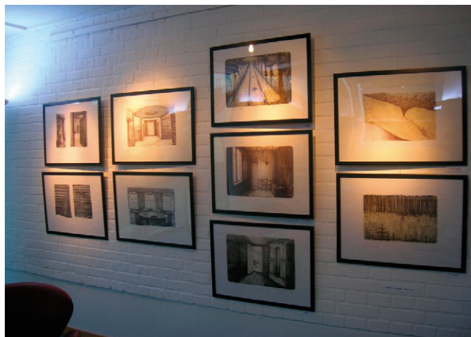
Výstava Swedish Tim v Mjölby Jitky Jakubcové-Jakšíkové.