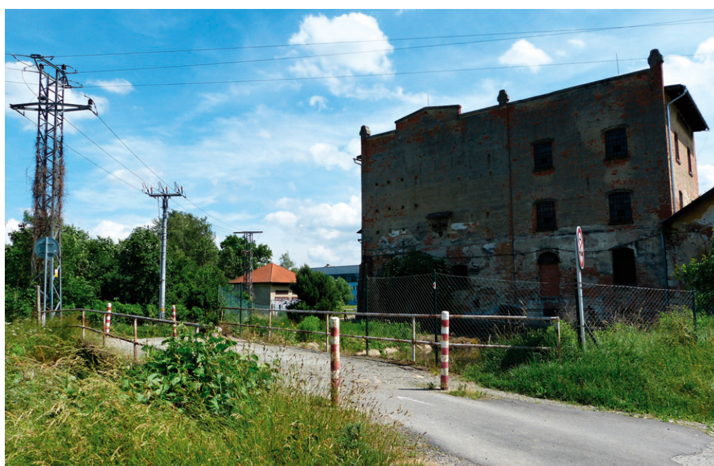
Most u Salmova mlýna se stane po zpevnění obousměrným jednopruhovým mostem s pruhem pro pěší.

Dostatečné parkovací plochy tak vzniknou nejen v rámci stávajícího parkoviště u baseballo-