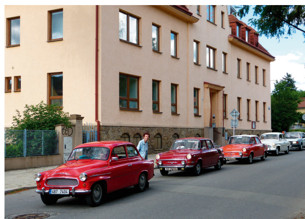
Škoda sraz Moravský kras letos vstoupil do jedenáctého ročníku. V sobotu 18. června se vozy značky Škoda sjely na parkovišti na nám. Republiky, poté následovala spanilá jízda městem.