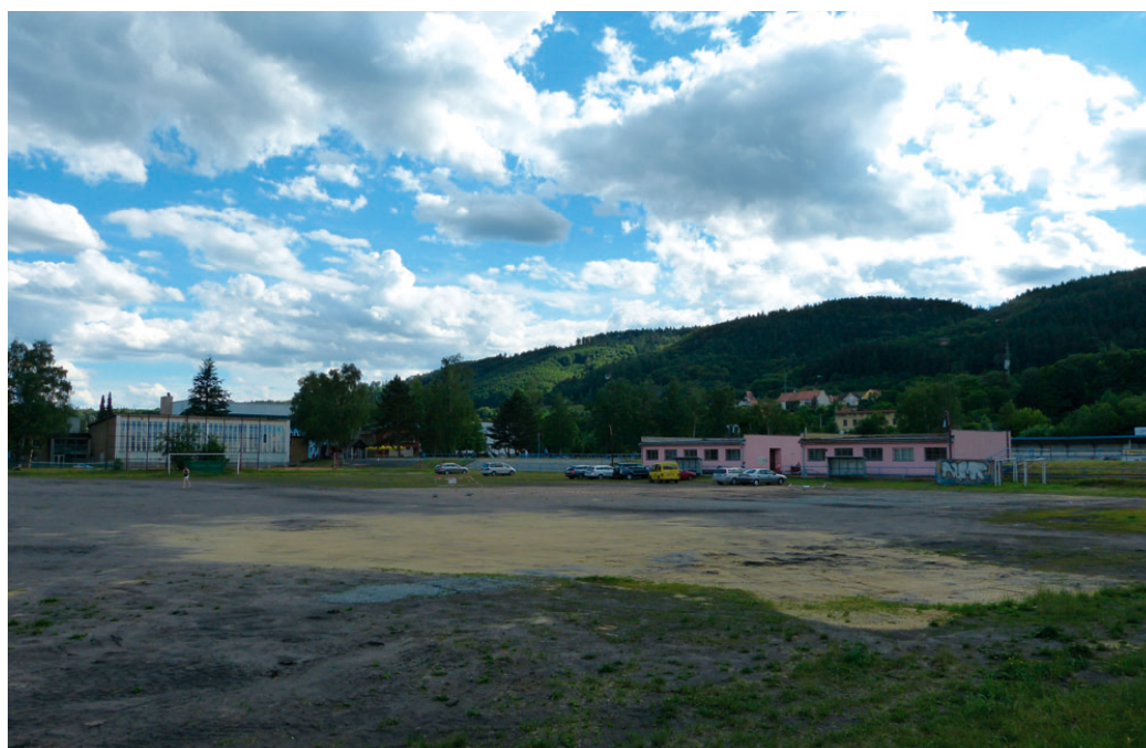
K předání plochy staveniště došlo v červnu. Práce na hřišti se tak rozjedou již během července.

„Město Blansko letos žádalo ministerstvo o dotaci ve výši 12 mil. Kč, vzhledem k velkému počtu žadatelů nám však byla poskytnuta stejná částka jako loni. Mezitím však přišla dobrá zpráva z kraje, který se rozhodl na záklá-