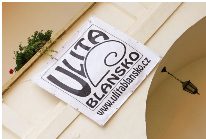
Muzika pro Karolínku probíhá vždy v průběhu léta na nádvoří blanenského zámku.

Jak se píše na webových stránkách klubu, zájmový spolek Ulita sdružuje děti, mládež i dospělé, kteří nemají rádi nudu a nemyslí jen na sebe. Veškerou jeho činnost zajišťují dobrovolníci bez nároku na finanční odměnu. Prostě je to baví a vidí v tom smysl. Už dvacet let.