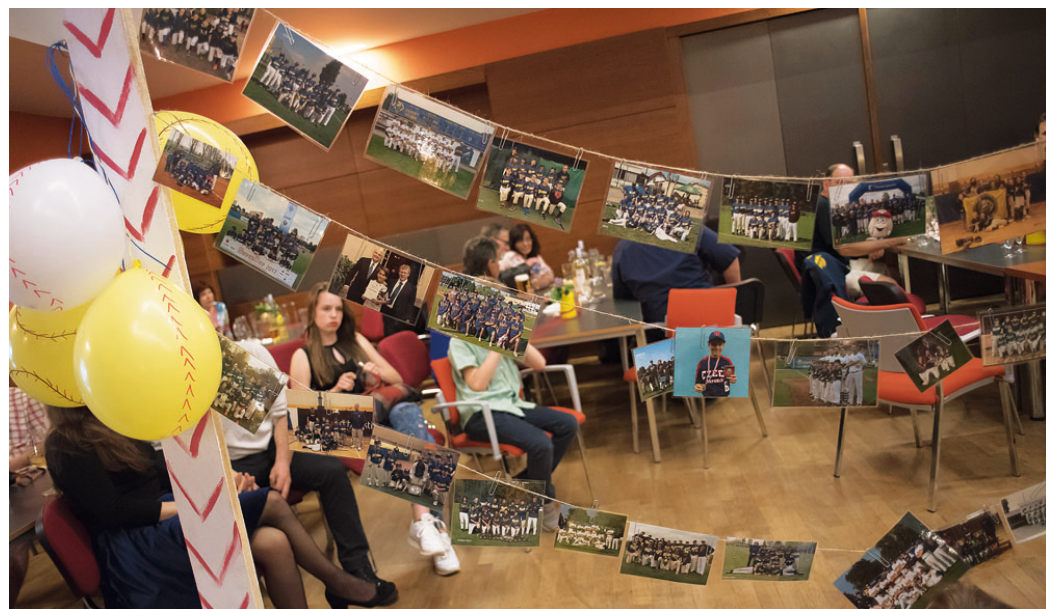
Olympia Blansko si připomněla třicet let svého působení.

» Radka Sitarová Olympia Blansko (redakčně zkráceno)