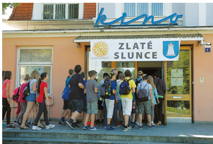
Zlaté slunce tradičně hostí budova blanenského kina.

Finálové kolo soutěže amatérských školních filmů Zlaté slunce letos v Blansku proběhne ve dnech 7.–8. června. Účastní se ho nadějnými filmaři z celé republiky mladší devatenácti let.