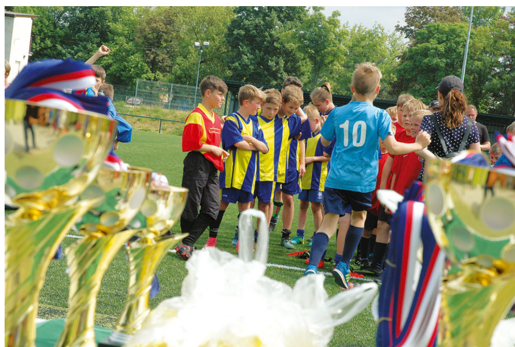
Okresní kolo turnaje v kopané pro žáky prvního stupně Mc Donald's Cup proběhlo 11. května na fotbalovém hřišti ASK Blansko. V kategorii mladších žáků (1.–3. třída) se nejlépe dařilo družstvu z Lysic. Kategorii starších žáků (4.–5. třída) ovládlo boskovické družstvo.