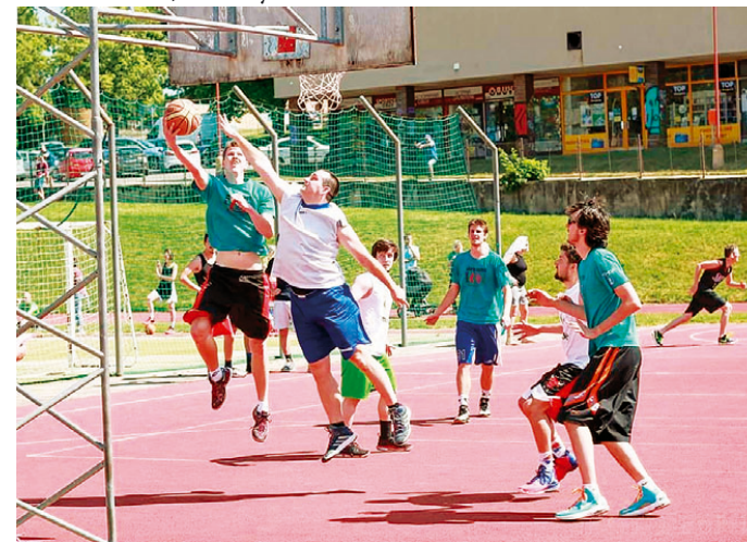
Blanenská čunča přinesla skvělou podívanou všem příznivcům streetballových turnajů.