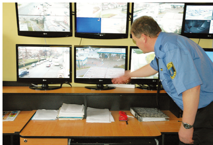
Z důvodu zastaralosti původního zařízení z roku 2002 prošel původní systém pultu centralizované ochrany upgradem na systém nové generace LATIS SQL.

Bez dotací města Blanska se neobejde ani Hnutí humanitární pomoci, chráněné bydlení – Domov OLGA a Centrum Velan, jejichž