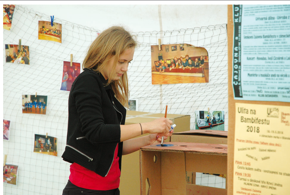
Bambifest , dvoudenní akce pro děti, mládež i dospělé, proběhl v pátek 18. a v sobotu 19. května v zámeckém parku a v budově Muzea Blanenska. Kromě prezentace nabídky volnočasových aktivit pro děti došlo i na pestrou hudební produkci v rámci festivalu be.FEST. V budově muzea se pak konal další ročník konference.

Rada schvaluje po úpravě Dodatek č. 1 Organizačního řádu Městského úřadu Blansko s účinností od 01.06.2018.