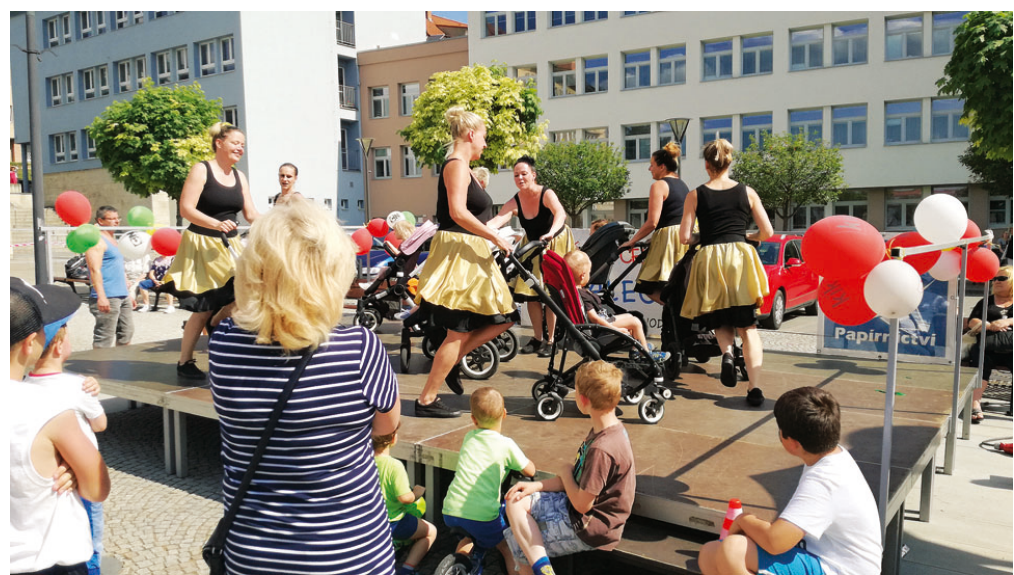
Závody kočárků ve sportovní chůzi na trase dlouhé zhruba sto kroků uspořádalo v neděli 13. května na náměstí Republiky v Blansku Mateřské centrum Veselý Paleček. Výtěžek ze startovního poputuje Azylovému domu pro matku a dítě v Blansku.