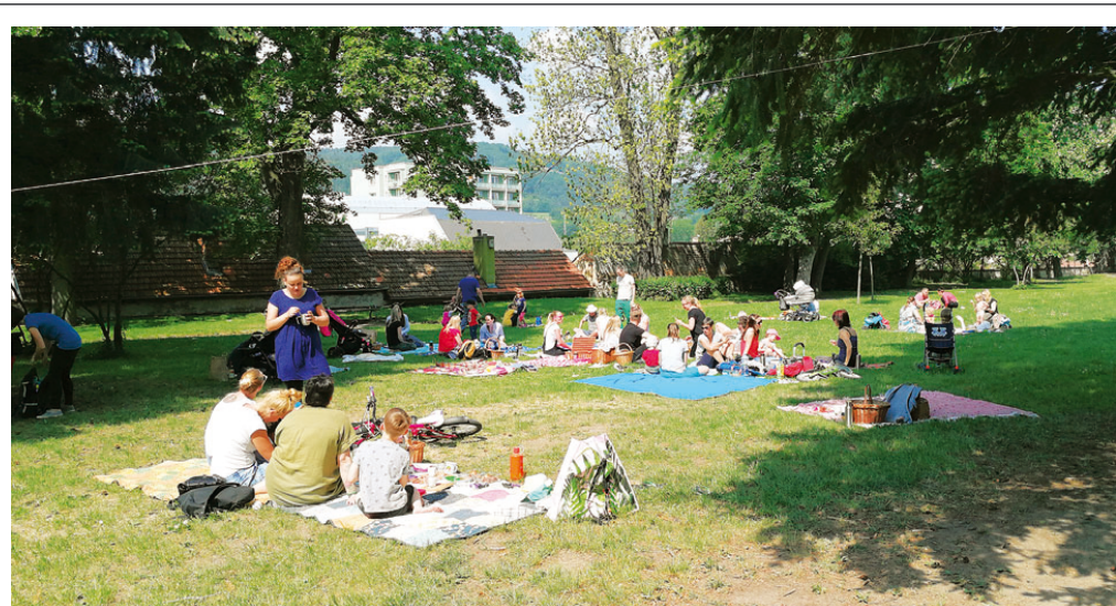
Férová snídaně v zámeckém parku Blanska proběhla v sobotu 12. května již poosmé. Piknikového happeningu na podporu fairtradových pěstitelů kávy, kakaa nebo banánů se letos zúčastnilo dvaasedmdesát lidí.