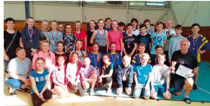
Blanenská výprava ve slovenském Komárně.