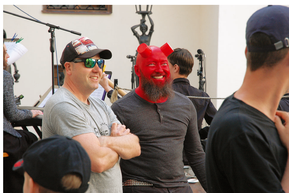
Muzejní noc , kterou uspořádalo v pátek 18. května Muzeum Blanenska, se letos nesla v duchu komiksu. K vidění zde byla řada postav, které známe i z filmového plátna.