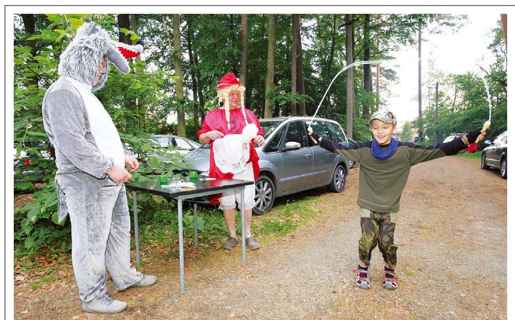
Pochod Pohádkovým lesem na Klepačově se uskutečnil v sobotu 12. května. Zábavnou procházku pohádkovou říš s plněním jednoduchých úkolů připravili místní dobrovolní hasiči.