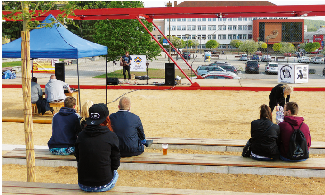
Jednou z prvních akcí, které oživily „Poduklí“, byl dukla.FEST. V průběhu léta tento prostor ožije několika koncerty, proběhne zde také promítání v rámci letního kina.

Program akcí MKD je nyní k dispozici také v elektronické podobě na http://www.blansko.cz/meu/odbor-skolstvi-kultury/mkd .