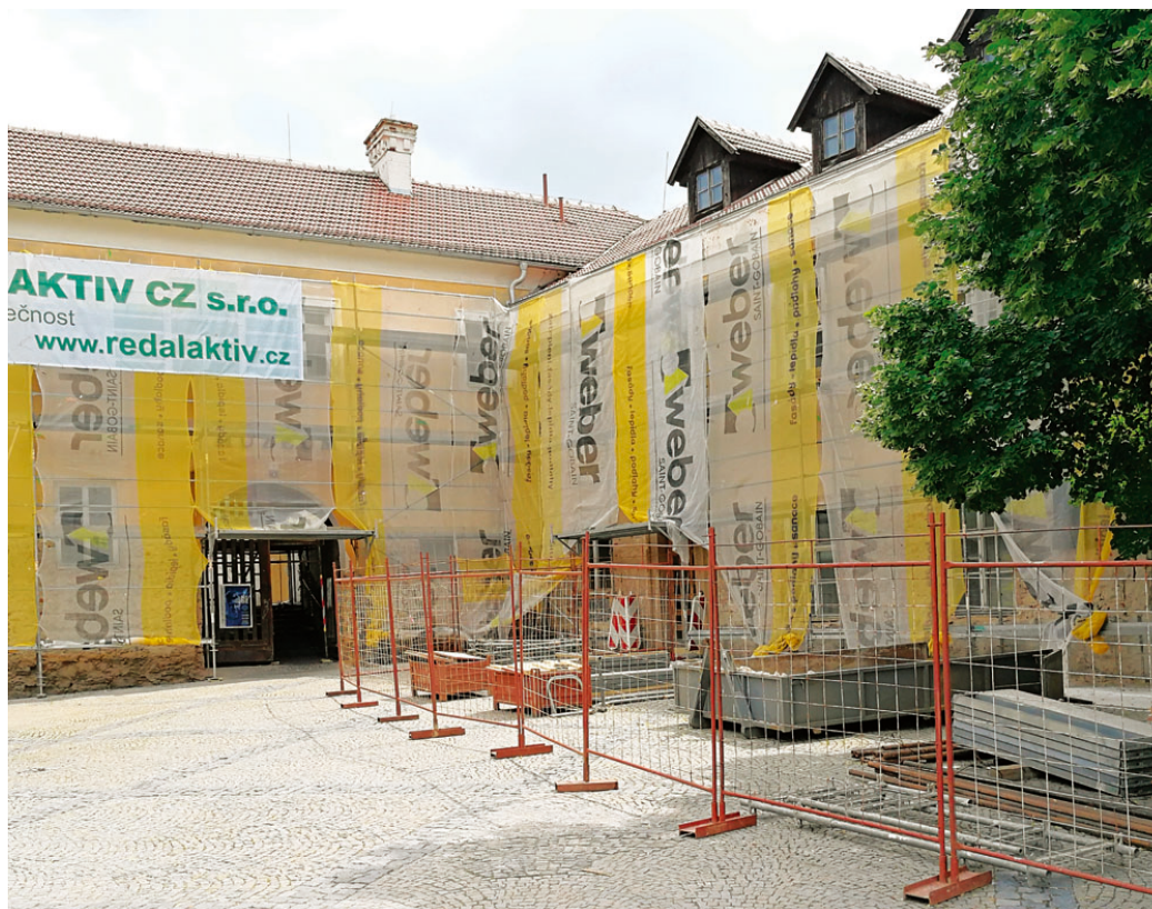
Budova Základní umělecké školy je v majetku města Blanska, jejím zřizovatelem je ale Jihomoravský kraj.