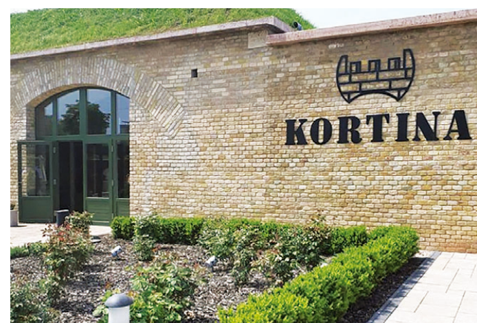
V jedné z původních hlásek pevnosti vznikla díky aktivitě soukromého subjektu moderní restaurace.

„Navštívili jsme komárenskou pevnost, kde nás náš průvodce seznámil s postupem prací spojených s opravami obrovského komplexu, který původně využívali sovětsí vojáci. Obnova