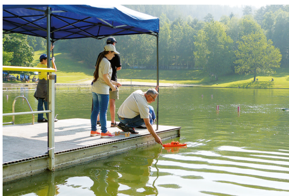
O Moravský pohár se utkali lodní modeláři na blanenské přehradě o víkendu od 12. do 13. května. Soutěžili zde žáci, junioři i senioři celkem v pěti kategoriích modelářského sportu.