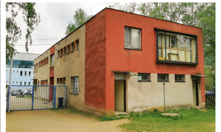
Ubytovna na Sportovním ostrově Ludvíka Daňka v Blansku.

Přestavbou tohoto objektu město získá zázemí pro činnost sportovních klubů, správu areálu sportovního ostrova, pro Českou unii sportu a v neposlední řadě i pro širokou veřejnost. » red