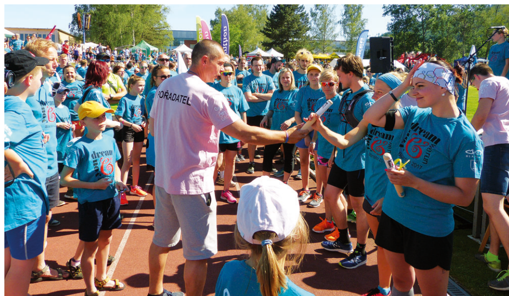
Štafetové koliky jsou předány leaderům jednotlivých týmů vždy před startem běhu.

Aktuální informace sledujte na www.youdreamwerun.cz nebo na facebooku. » red