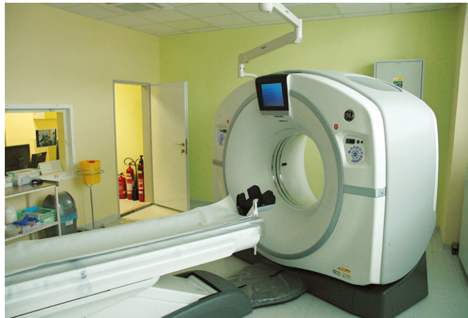
Původní CT zařízení byla Nemocnice Blansko nucena vyměnit za nové s ohledem na jeho stáří a především stupeň jeho opotřebení.

V uplynulém roce zde již potřetí úspěšně proběhlo akreditační šetření hodnocení kvality a bezpečí poskytovaných služeb, které navazuje na dlouhodobý Strategický plán města Blanska. Toto zdravotnické zařízení rovněž uspělo v celostátní anketě Nemocnice ČR 2017. V kategorii Bezpečnost a spokojenost ambulantních pacientů získalo třetí příčku. V kategorii Nejlepší nemocnice 2017 v Jihomoravském kraji obsadila blanenská nemocnice první místo u ambulantních pacientů a druhé místo u pacientů hospitalizovaných. Kvalitnější služby mohou v Nemocnici Blansko poskytovat od začátku tohoto roku i díky novému tomografu za více než šestnáct milionů korun. Jedná se o přístroj vyšší generace, který umožňuje širší škálu vyšetření. V září tohoto roku zde zahájí provoz také zbrusu nové pracoviště s technologií magnetické rezonance. Blanenským ušetří nejen cestu do Brna nebo do Prostějova, zkrátí se i čekací lhůty. Nezbytnou rekonstrukcí zde prochází oddělení rehabilitace.