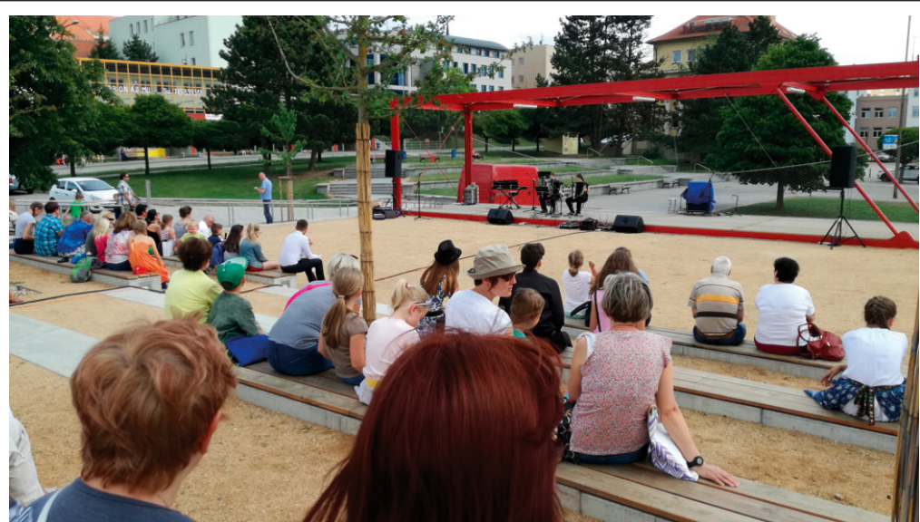
V rámci festivalu ZUŠ OPEN nabídl ve čtvrtek 24. května v Blansku program obě základní umělecké školy. Žáci Základní umělecké školy se představili odpoledne v prostoru Poduklí na náměstí Republiky. Soukromá základní umělecká škola odehrála v Dělnickém domě dětem baletní pohádku Kráska a zvíře.