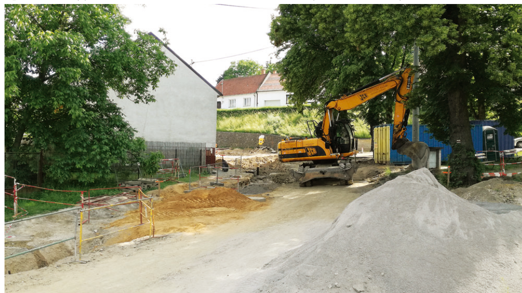
Rekonstrukce ulice Komenského na Starém Blansku se netýká pouze výstavby nové komunikace, její součástí je i výměna inženýrských sítí.

železničních kolejí za křižovatku s ulicí Na Brankách, byla časově vymezena na letní období s úmyslem využít letních dovolených a prázdnin, kdy je menší četnost