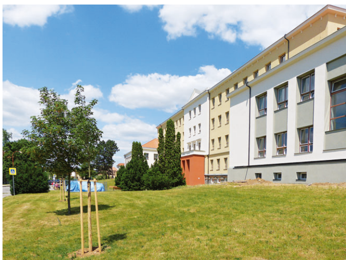
Budova Základní školy na Erbenově ulici v Blansku prošla před třemi lety rekonstrukcí. Od loňského roku se její žáci mohou těšit i z nové tělocvičny.

vislosti s jejím napojením na síť centrálního zásobování teplem » pokračování na straně 5