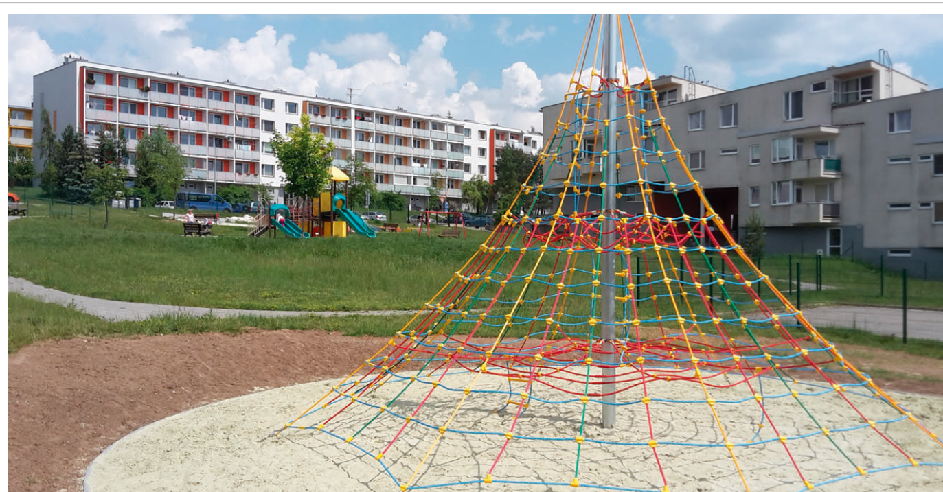
Zbrusu nový herní prvek slouží dětem na dětském hřišti v sídlišti Zborovce. Blanenští na jeho výstavbu a úpravu povrchu, včetně dopadové plochy kolem lanové pyramidy, uvolnili ze svého rozpočtu 450 tisíc korun.