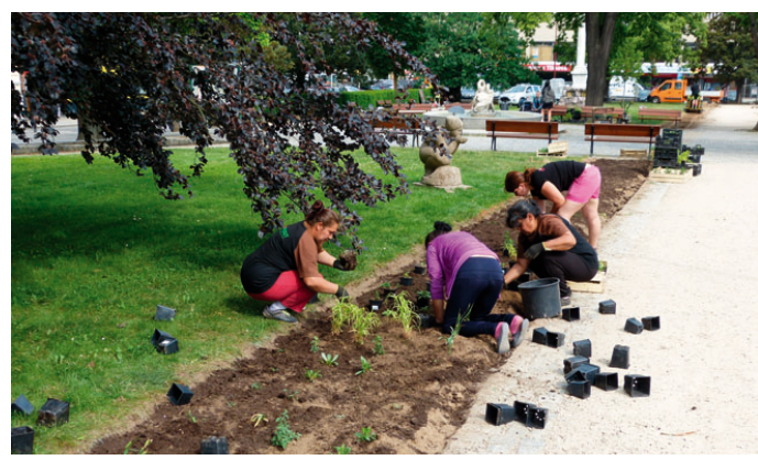
Květinová výsadba je dalším krokem ke zvelebení centra města. Škoda jen, že stačily pouze dva dny na to, aby ze zbrusu nového záhonu zmizelo šest sazenic levandule a dvě sazenice kosatců.