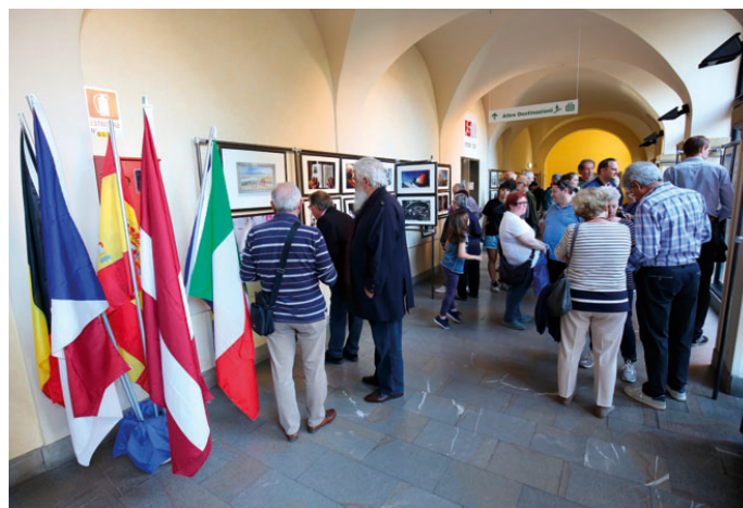
Blanenští fotografové loni přijali pozvání k účasti na fotografické výstavě instalované v historické budově nemocnice v italském Scandianu.

Facebookový profil má město také o oblast spolupráce mezi seniory, studenty nebo umělci. Galerie města Blanska letos měla tu čest poskytnout své prostory přehlídce nejlepších prací loňského ročníku mezinárodní soutěže v rámci legnického festivalu satirického humoru Satyrykon. Scandiano se v posledních letech zaměřuje, mimo jiné, i na téma fotografie. Profesionální fotografové z Blanska se tak loni mohli prezentovat na výstavě Fotografia Europea . Naopak mladí amatérští milovníci fotografie dostali letos příležitost účasti na fotografickém workshopu v rámci mezinárodního projektu Sociography . Po několika letech stagnace postupně ožívají i vztahy s rakouským Mürz-zuschlagem. Aktuálně se do Blanska chystá tamní dechová hudba. Se svým vystoupením se v červnu představí v rámci tradičních proměnných koncertů.