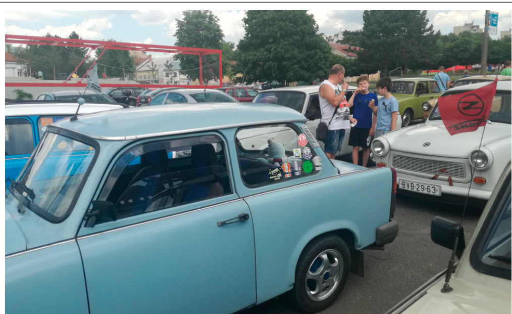
Do Blanska zavítaly Trabanty. Jubilejní 10. setkání majitelů a fanoušků těchto kompaktních vozidel s dvoutaktním motorem se uskutečnilo v sobotu 26. května na náměstí Republiky. Kromě tradičních sériových vozů byly k vidění i některé vzácné modely, mj. i předchůdce dnešního Trabantu. Po prohlídce vozů se účastníci srazu vydali v koloně na spanilou jízdu Blanskem.