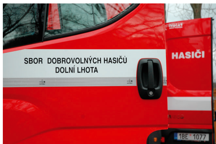
Město Blansko získalo 500tisícovou dotaci na nákup nového požárního vozidla pro Jednotku sboru dobrovolných hasičů Dolní Lhoty. Z městské pokladny přispělo částkou 1,3 milionu korun. Foto: S. Mrázek

✓ Podpora moderních forem komunikace s občany