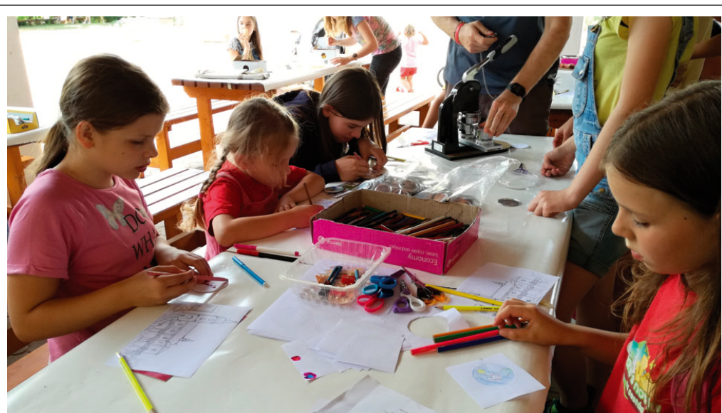
Noci kostelů patřil pátek 25. května. Zapojila se do ní Farnost svatého Martina s odpoledním programem, zaměřeným na děti a stopovací hru, v areálu farní zahrady. V kostele pak mohli návštěvníci vystoupat do věže ke zvonům, poslechnout si varhanní koncert či vystoupení skupiny Way to go. Závěr večera patřil posezení a rozjímání v tichu kostela a rozhovorům s knězem v kapli.