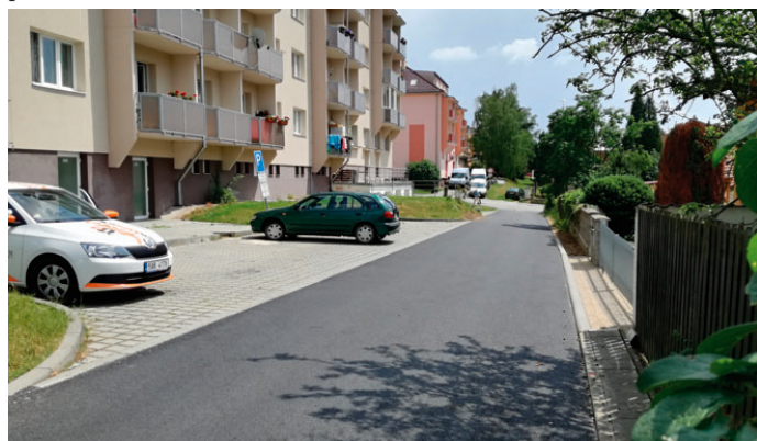
Silnice na náměstí Míru má již nový asfaltový povrch.