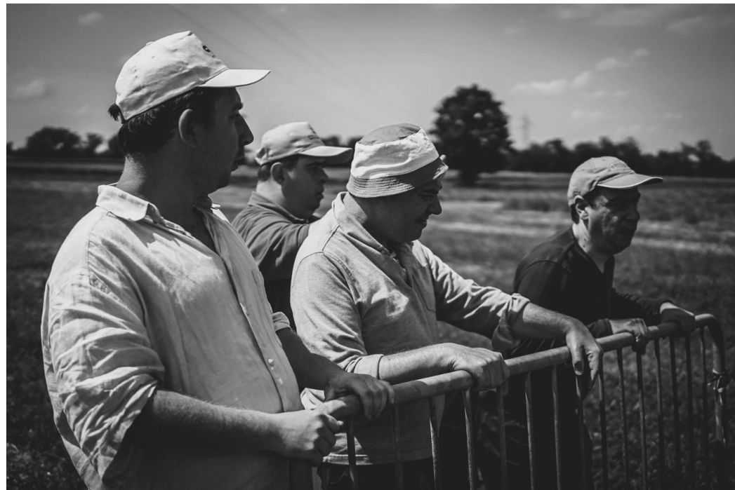
Život obyvatel Lo Stradella v italském Scandianu fotograficky zdokumentovali fotografové čtyř různých národností. Nechyběli mezi nimi tři Češi z Blanska.