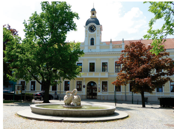
Budova blanenské radnice na náměstí Svobody.