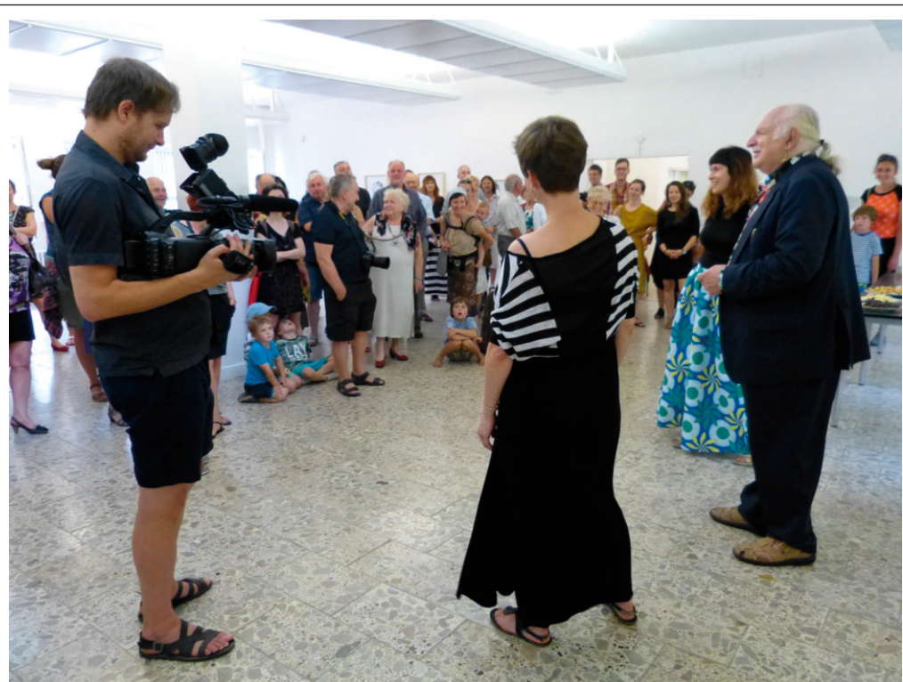
Vernisáž výstavy Milana Knížáka proběhla v Galerii města Blanska v sobotu, 2. června. K vidění je zde třicet portrétů osobností, které profesora Knížáka během jeho života jakkoli fascinovaly. Zajímavé je, že se jedná výhradně o muže. Nevšední výstava této mimořádné osobnosti naší současné výtvarné scény, a vůbec kulturního života, je zde k vidění do 29. června.